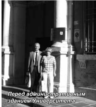
Перед административным зданием Университета

Во время визита, который состоялся 18-21 сентября, было подписано соглашение о сотрудничестве, в рамках которого возможны следующие направления совместной работы: проведение ста-