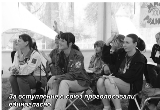
За вступление в союз проголосовали единогласно