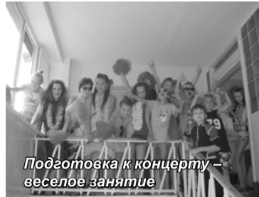
Подготовка к концерту – веселое занятие

В этом году мне и еще нескольким студентам нашего Университета представилась возможность попробовать себя в качестве вожатых в детском оздоровительном лагере «Голубое озеро», который находится под Рощино, недалеко от поселка Цвелодубово. Мы работали с детьми из Детского дома № 26. Пять лет наш Университет тесно сотрудничает с Детским домом, но в этом году впервые наши студенты имели возможность больше времени провести с его воспитанниками.