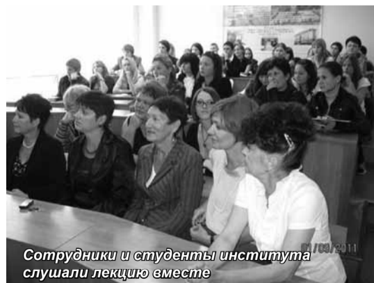
Сотрудники и студенты института слушали лекцию вместе

Впервые в России 8 сентября этого года отмечался профессиональный праздник – День финансиста. Отмечать его стали по Указу Президента РФ Д.А. Медведева. Именно 8 сентября в 1802 году Александр I образовал Министерство финансов в России.