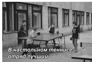
В настольном теннисе – отряд лучший

Каждый день в лагере я знакомилась с детьми все больше и сильно привязывалась к ним. Очень жаль, что такие хорошие ребята остались без родительской любви и поддержки. Многие из них очень талантливые