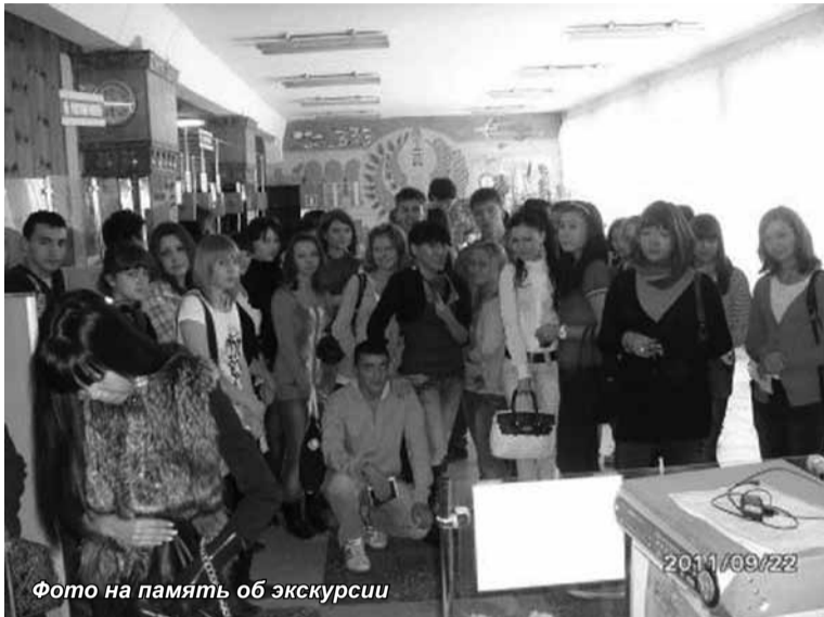
Фото на память об экскурсии

Осень в городе Якутске всегда начинается празднично: жители столицы поздравляют любимый город с днем рождения и устраивают народные гуляния. Марафон осенних мероприятий продолжила Национальная библиотека им. А.С.Пушкина, где с 15 сентября проходят традиционные Дни первокурсников. Студенты Якутского института экономики не остались в стороне и приняли участие в предложенных экскурсионных программах.