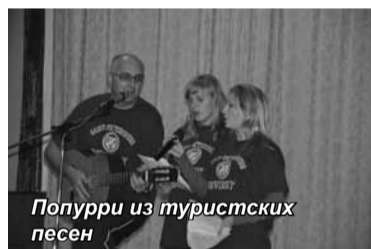
Попурри из туристских песен

В слете принимали участие Совет по туризму Санкт-Петербурга и Ленинградской области, команды предприятий туристской индустрии: Го-