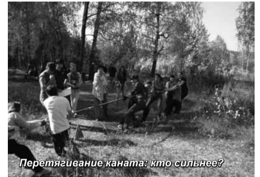
Перетягивание каната: кто сильнее?

соревнование кашеваров, встречи по волейболу, перетягивание каната! И, конечно, всеми любимым конкурсом туристской песни! Шесть часов пролетели, как один миг, и вот парад закрытия турслета, подведение итогов и награждение. Первое место и огромный торт получает команда 2 курса «Менеджайзеры». 2 и 3 места соответственно получили команда