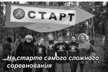
На старте самого сложного соревнования

штрафные очки. Вот и наши пошли, нет, — полетели! Мы их ждали через полчаса, а они прибежали через 17 минут. Каков же результат? Все точки найдены и зафиксированы. Судья торжественно сообщил всем нам — и команде и болельщикам, что пока мы лидеры. До нас лучший результат по времени был у команды Балтийской