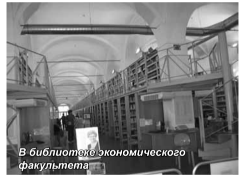
В библиотеке экономического факультета