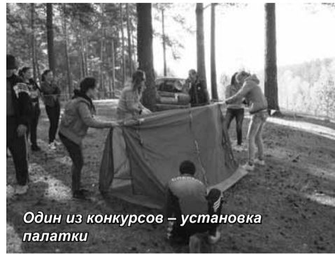
Один из конкурсов – установка палатки

Потрясающе красиво бабье лето в Сибири! Сверкает, играет, переливается всеми цветами радуги! В международный День туриста – 27 сентября, студенты Новосибирского филиала Санкт-Петербургского университета управления и экономики выехали на туристический слет в Заельцовский бор.