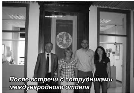
После встречи с сотрудниками международного отдела

Перед завершением 3-летней программы обучения по направлению бакалавриата осуществляется стажировка студентов на предприятиях Италии. В настоящее время многие предприятия этой страны ориентированы на Россию, поэтому для итальянских студентов очень актуально получить практический опыт на российских предприятиях, прослушать курс лекций по экономике и менеджменту российских предприятий в нашем Университете.