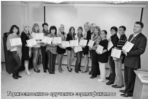
Торжественное вручение сертификатов