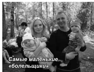
Самые маленькие «болельщики»

В составе гостей «поболеть» за своих пап-туристов прибыли 5-ме-