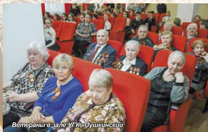
Ветераны в зале УГК «Пушкинский»