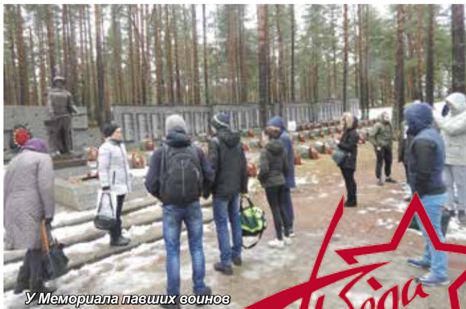
У Мемориала павших воинов