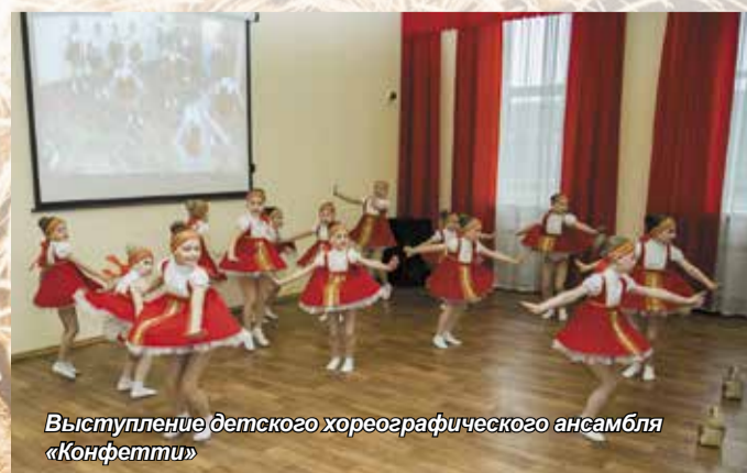
Выступление детского хореографического ансамбля «Конфетти»