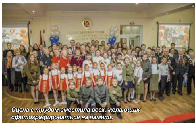
Сцена с трудом вместила всех, желающих сфотографироваться на память