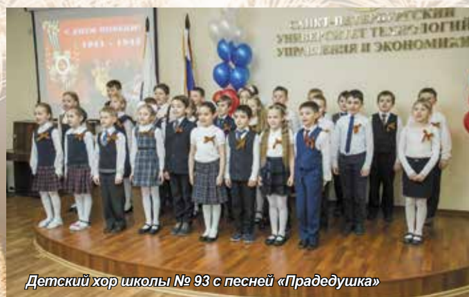
Детский хор школы № 93 с песней «Прадедушка»

По уже сложившейся традиции в завершение концерта прозвучала песня «День Победы», под мелодию которой студенты вручили гвоздики присутствующим в зале ветеранам и пригласили их на сцену для общей фотографии. Сцена с трудом вместила всех, желающих сфотографироваться на память об этом праздничном вечере. Более сорока ветеранов, около двухсот пятидесяти школьников, студентов, курсантов и жителей поселка вспомнили эту священную для всех дату – 9 мая, сохранив в своем сердце память и уважение к подвигу победившего народа.