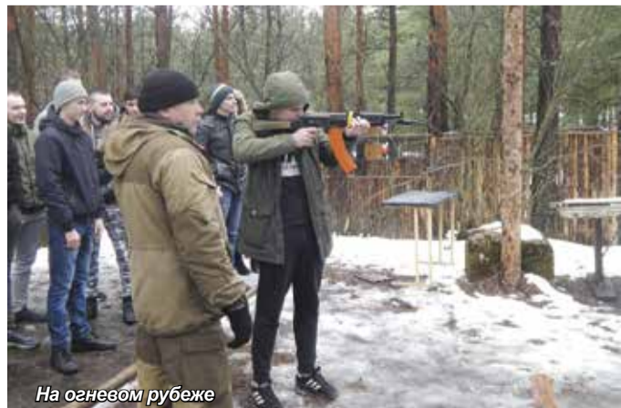
На огневом рубеже

В конце экскурсии всех ждал обед на полевой кухне. В меню гречневая каша с тушенкой и чай с печеньем.