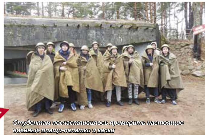
Студентам посчастливилось примерить настоящие военные плащи-палатки и каски