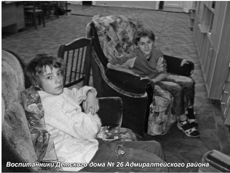
Воспитанники Детского дома № 26 Адмиралтейского района

«Дом - это там, где твое сердце» Плиний Старший