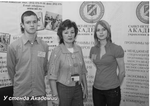
У стенда Академии