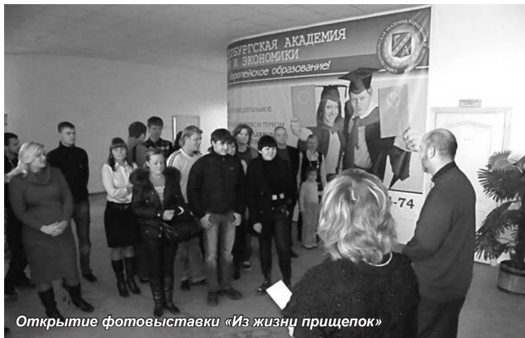
Открытие фотовыставки «Из жизни прищепок»

В ноябре 2009 года Студенческий совет Рязанского филиала Санкт-Петербургской академии управления и экономики в рамках студенческой недели организовал мероприятия, сыгравшие позитивную роль в воспитании студентов как граждан высокой общественной культуры.