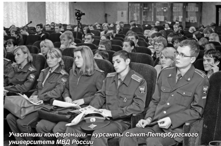
Участники конференции – курсанты Санкт-Петербургского университета МВД России

В рамках конференции состоялось заседание круглого стола «Правовая культура правозащитника: понятие, назначение, пути повышения». Участниками дискуссии стали студенты, аспиранты и преподаватели юридических