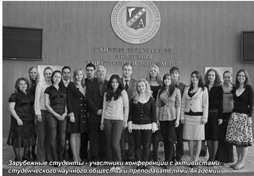
Зарубежные студенты - участники конференции с активистами студенческого научного общества и преподавателями Академии

19 мая в Санкт-Петербургской академии управления и экономики состоялась пленарное заседание Межвузовской научно-практической конференции студентов, аспирантов и молодых ученых «Формирование посткризисной модели хозяйства новой экономики России».