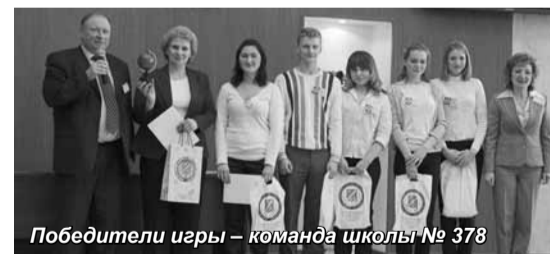
Победители игры – команда школы № 378

В рамках IX Межвузовской студенческой конференции «PR и социальное управление: экономика, политика, культура. Кризис и молодежь» была проведена деловая игра «PRоба», организаторами которой стали кафедра «Связи с общественностью» и отдел по работе с заказчиками СПбАУЭ, а участниками старшеклассники школ № 284 и № 378 Кировского района, школы № 285 Красносельского района, учащиеся колледжа № 7 и первокурсники Академии – студенты группы 751/1.