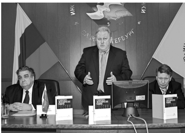
Презентация книги академика РАН А.Г. Аганбегяна «Социально-экономическое развитие России» в СПбАУЭ в феврале 2005 года

3 июня в Санкт-Петербургской академии управления и экономики состоится очередная открытая лекция и презентация книги академика Российской академии наук, специалиста в области социально-экономического развития России, почетного профессора СПбАУЭ Абе-