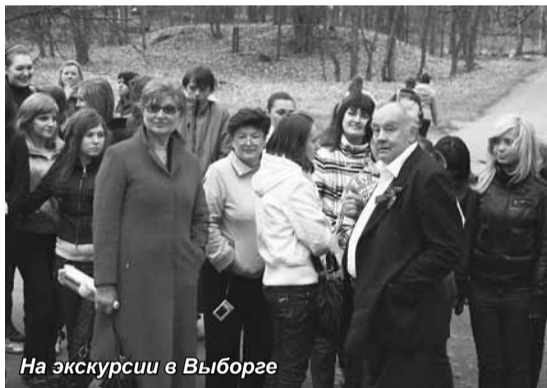
На экскурсии в Выборге

В конце апреля студенты Санкт-Петербургской академии управления и экономики побывали в автобусных экскурсиях в г. Кронштадте - неповторимом по своему образу и архитектуре облику городе-крепости, и в г. Выборге - уникальном своей архитектурой, историческими событиями.