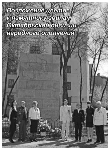
Возложение цветов к памятнику воинам Октябрьской дивизии народного ополчения