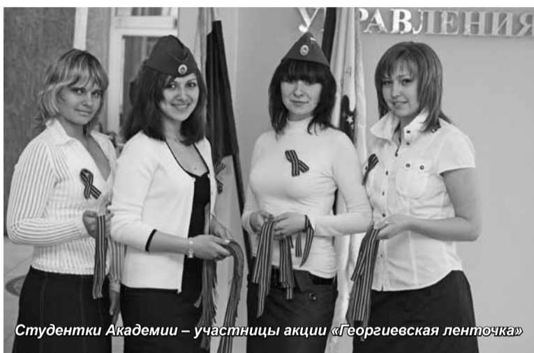
Студентки Академии – участницы акции «Георгиевская ленточка»