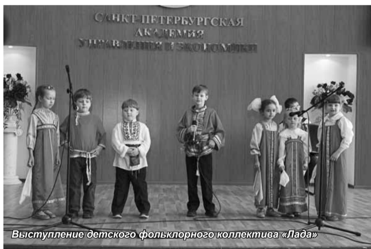
Выступление детского фольклорного коллектива «Лада»

студентов с праздником. «Приятно, что нас постоянно приглашают на такие мероприятия в Академию, что мы имеем возможность рассказать молодежи об этом дне. Эту победу удалось одержать невероятно тяжело. Этот