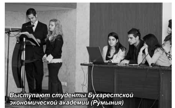
Выступают студенты Бухарестской экономической академии (Румыния)

Комитета по науке и высшей школе правительства Санкт-Петербурга, которую вместе с ценным подарком ей вручили в торжественной обстановке на пленарном заседании.