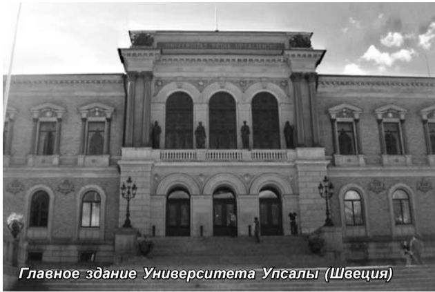
Главное здание Университета Упсалы (Швеция)