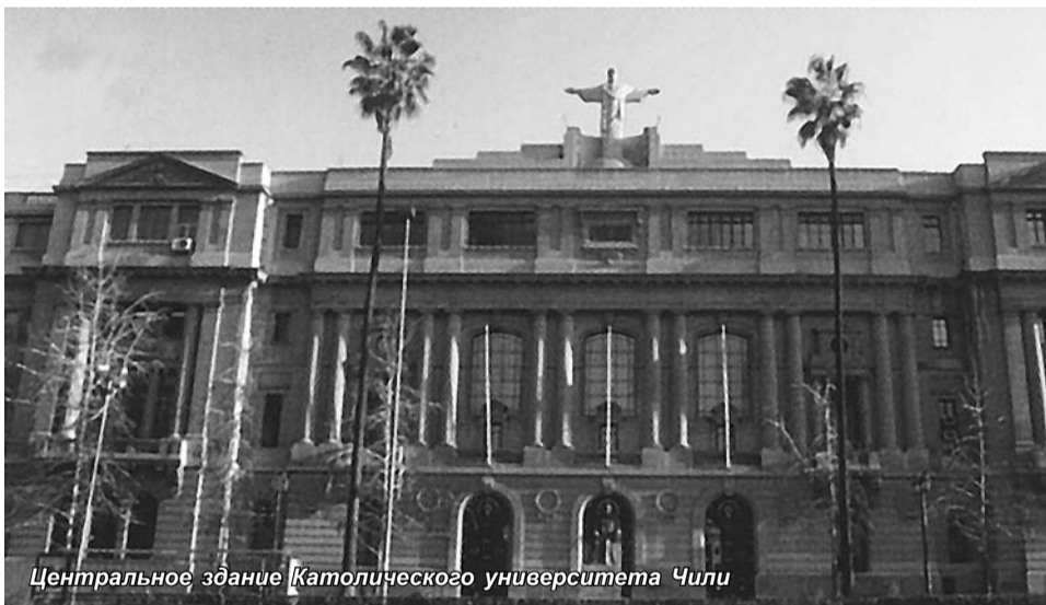
Центральное здание Католического университета Чили

Для студентов и преподавателей Академии появилась дополнительная возможность пройти обучение в престижных зарубежных вузах. К ранее заключенным более 30 соглашениям о сотрудничестве СПбАУЭ с иностранными университетами, в том числе Северной Америки (Гарвард, Сан-Франциско, Лос-Анджелес, Анкорридж, Нью-Йорк, Вашингтон), Центральной и Южной Америки (Бразилия, Аргентина, Мексика) добавилось еще одно – с Католическим университетом Чили (Pontificia Universidad Católica de Chile).