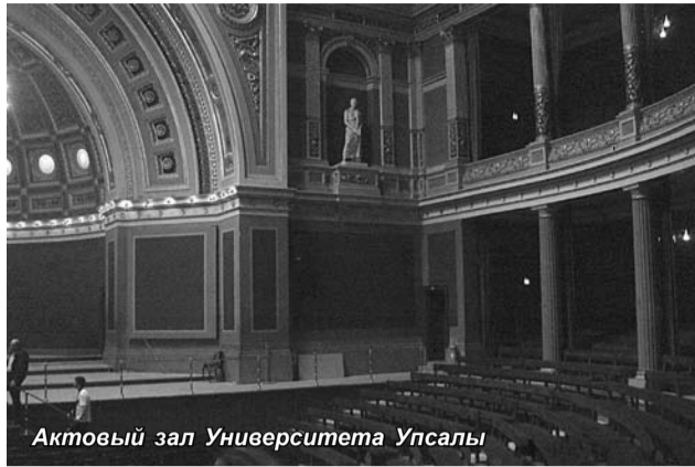
Актовый зал Университета Упсалы