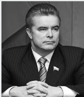
Депутат Государственной думы РФ, член комитета по