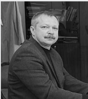
обеспечения эффективной занятости населения.

Академию управления и экономики 6 мая посетил председатель Комитета по занятости населения Санкт-Петербурга П.Б. Панкратов. На встрече обсуждались вопросы реализации соглашения между Комитетом и Академией, которое было подписано ранее. В соответствии с этим соглашением Академия будет проводить научные исследования рынка труда и образовательных услуг с целью