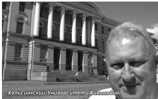
Хельсинкский Университет (Финляндия)

Кроме этого, для изучения европейской модели образования планируются командировки специалистов Академии и в другие