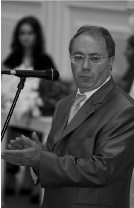
Помощник полномочного представителя Президента РФ в Северо-Западном федеральном округе В.Н. Голощанов – частый гость на торжественных мероприятиях Академии, которую считает одним из лучших учебных заведений в Санкт-Петербурге и на Северо-Западе, выпускающих высококвалифицированные кадры.