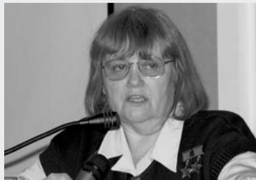
26 марта в Санкт-Петербургской академии управления и экономики перед профессорско-преподавательским составом и студентами выступила

заместитель председателя Комитета Государственной думы РФ по обороне С.Е. Савицкая. К пожеланию, которое депутат адресовала студентам, стоит прислушаться всем без исключения: «Не будьте пассивными, интересуйтесь тем, что происходит. Читайте прессу, причем самых различных направлений, анализируйте и делайте для себя выводы сами».