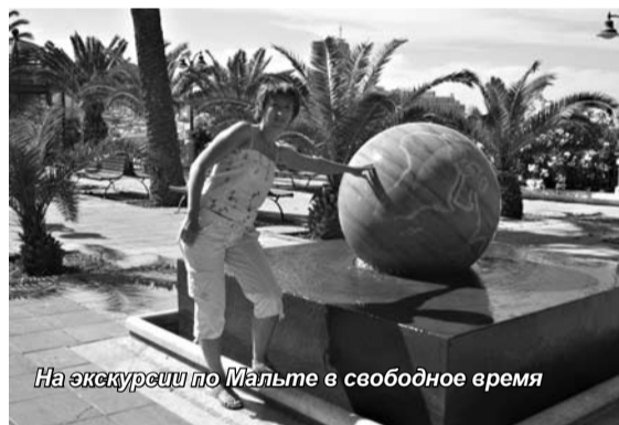
На экскурсии по Мальте в свободное время