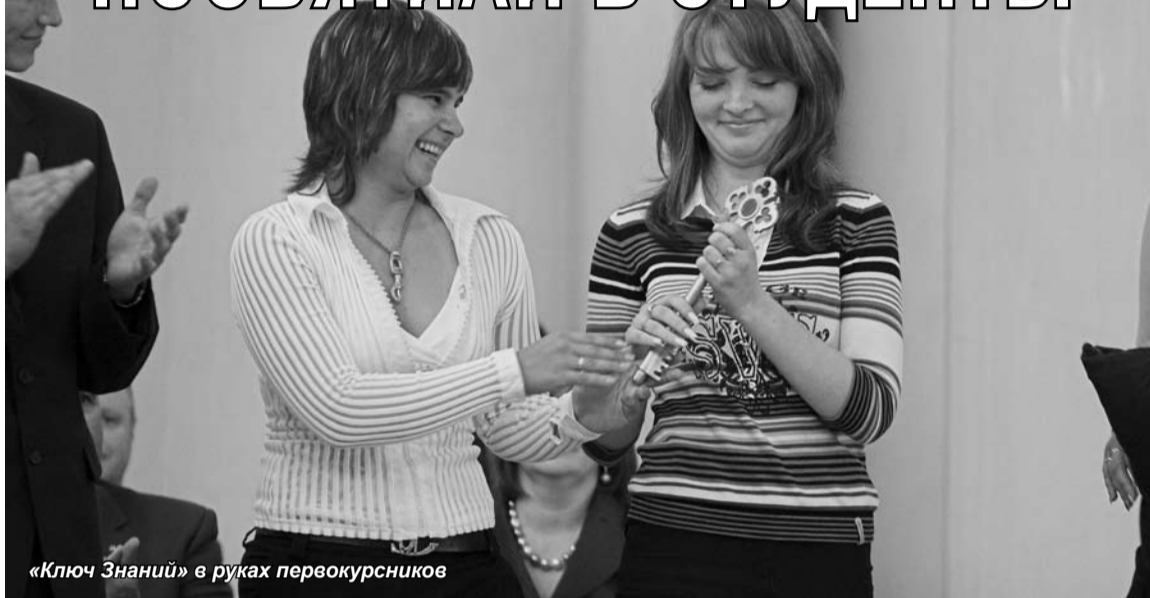
«Ключ Знаний» в руках первокурсников