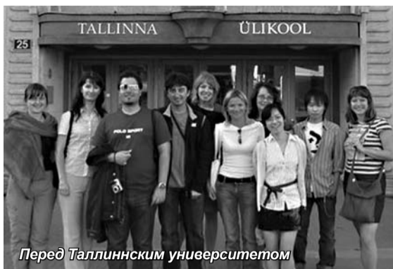
Перед Таллинским университетом