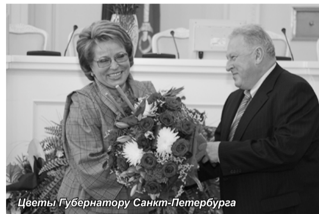
Цветы Губернатору Санкт-Петербурга