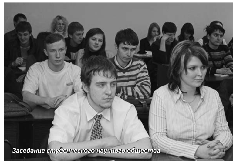
Заседание студенческого научного общества