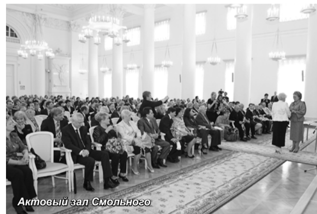
Актовый зал Смольного