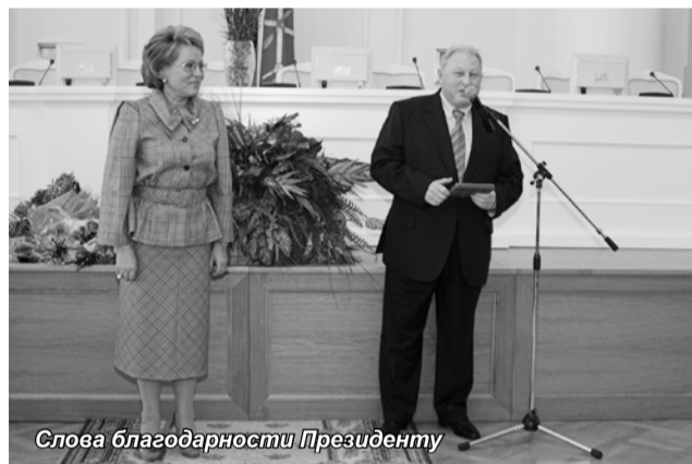
Слова благодарности Президенту