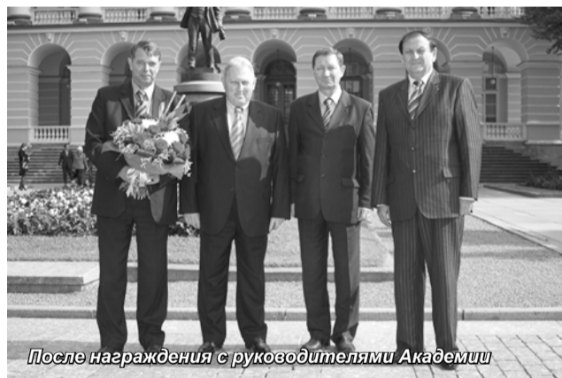
После награждения с руководителями Академии