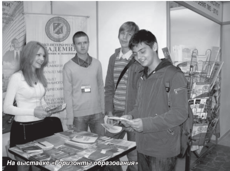
На выставке «Горизонты образования»

В соответствии с Федеральным законом от 18.07.2009 № 184-ФЗ «О внесении изменений в отдельные законодательные акты Российской Федерации по вопросам организации образовательного процесса в образовательных учреждениях» прием на обучение в имеющие государственную аккредитацию образовательные учреждения ВПО для обучения по образовательным программам соответствующих ступеней (в том числе специалистов) прекращается 30 декабря вместо 31 августа 2009г. Это изменение обозначает, что у нас есть возможность до конца года выполнить план набора студентов. На сегодняшний день он выполнен на 89%.