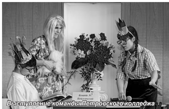
Выступление команды Петровского колледжа

день не было, хорошее настроение было у всех – и у тех, кто стал победителем в номинации «Самая дружная команда», и у тех, кто был признан самыми музыкальными, самыми эрудированными, самыми находчивыми. Третье место разделили две команды – Выборгского педагогического колледжа и Педагогического колледжа