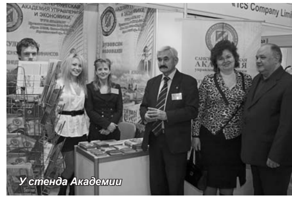
У стенда Академии