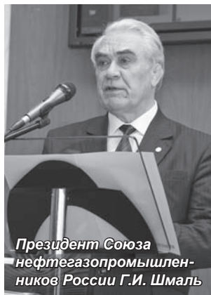
Президент Союза нефтегазопромышленников России Г.И. Шмаль

30-31 марта в Санкт-Петербургской академии управления и экономики состоялась V Международная научно-практическая конференция «Фундаментальные науки и бизнес в учебном процессе. Династия Нобелей: