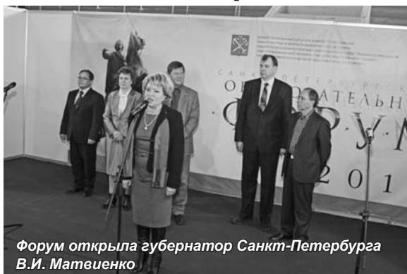
Форум открыла губернатор Санкт-Петербурга В.И. Матвиенко

Академия награждена Дипломом Санкт-Петербургского образовательного форума – 2010, который проводился 1-4 апреля в СКК «Юбилейный». Форум был организован Комитетом по науке и высшей школе, Комитетом по образованию, Комитетом по молодежной политике и взаимодействию с общественными организациями Правительства Санкт-