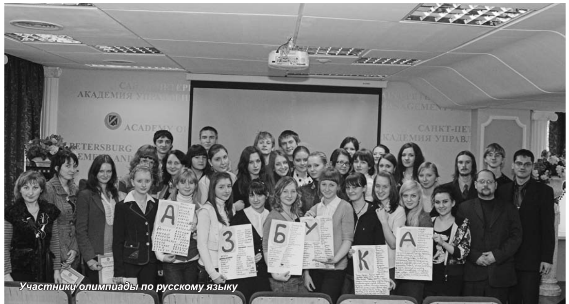
Участники олимпиады по русскому языку

Созданный в конце XX века факультет социального управления с уверенностью смотрит в свое будущее. Его выпускники достойно представляют Санкт-Петербургскую академию управления и экономики в различных сферах российского общества, в его политической, научной и культурной элитах.