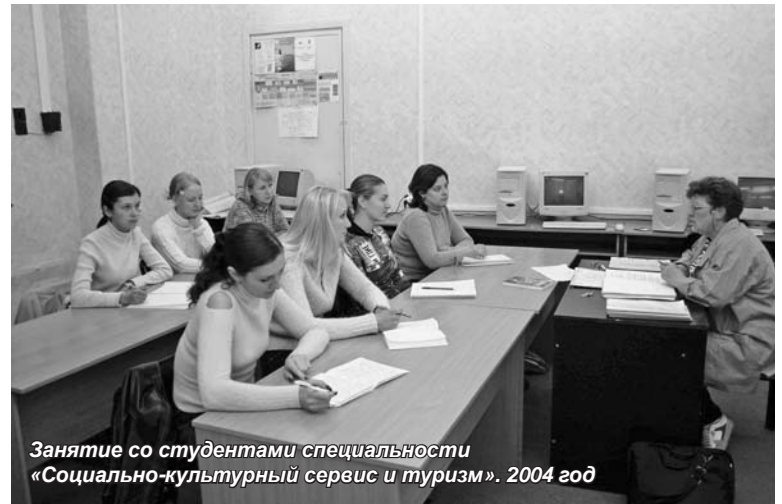
Занятие со студентами специальности «Социально-культурный сервис и туризм». 2004 год

Это и традиция использования результатов научных контактов с институтами РАН, музеями Санкт-Петербурга в учебном процессе на факультете. Так, только в последние два года факультетом заключены соглашения о творческом и научно-практическом сотрудничестве с Институтом социально-экономических проблем народонаселения РАН, Социологическим институтом РАН, государственным учреждением культуры «Российский этнографический музей». Кафедры факультета ежегодно орга-