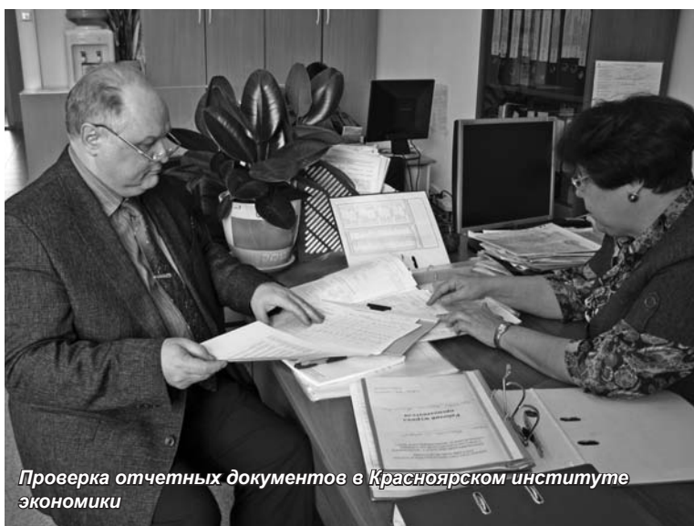
Проверка отчетных документов в Красноярском институте экономики