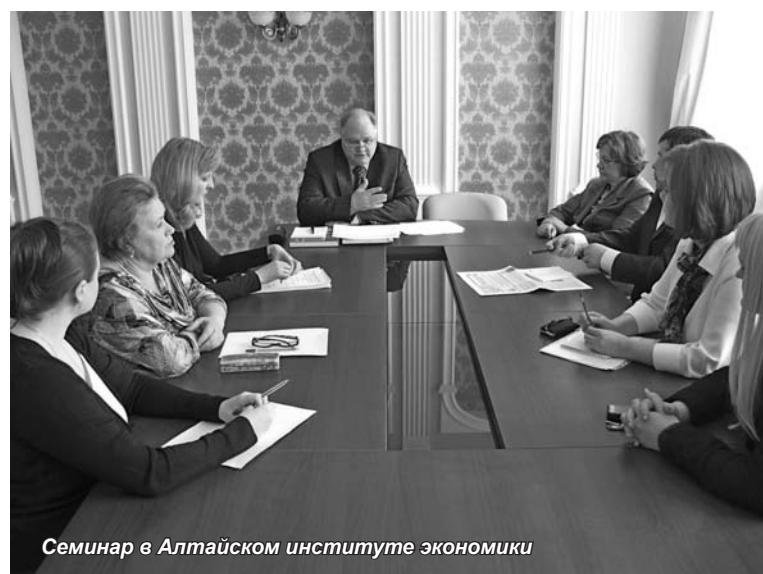
Семинар в Алтайском институте экономики