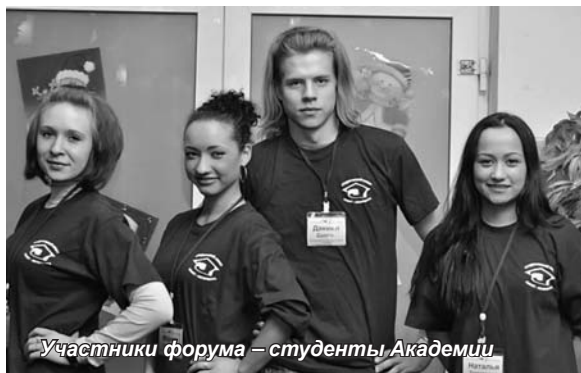
Участники форума – студенты Академии

2-4 апреля в лагере «Зеленый город» состоялся открытый выездной форум Студенческого совета Санкт-Петербурга. Форум проводился с целью дальнейшего совершенствования и повышения эффективности работы органов студенческого самоуправления, развития межвузовской коммуникации, а также усиления общественной составляющей в системе профессионального образования.