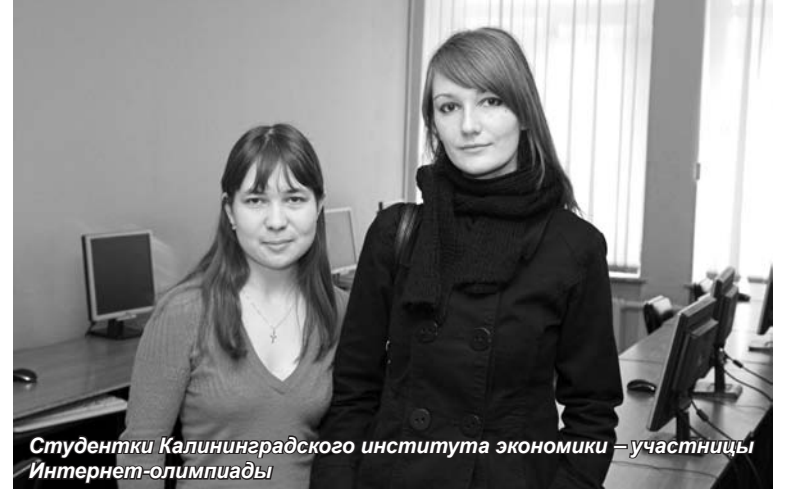
Студентки Калининградского института экономики – участницы Интернет-олимпиады