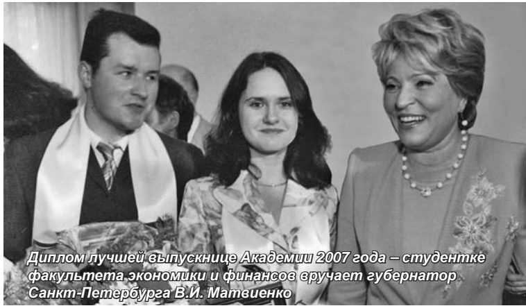
Диплом лучшей выпускнице Академии 2007 года – студентке факультета экономики и финансов вручает губернатор Санкт-Петербурга В.И. Матвиенко