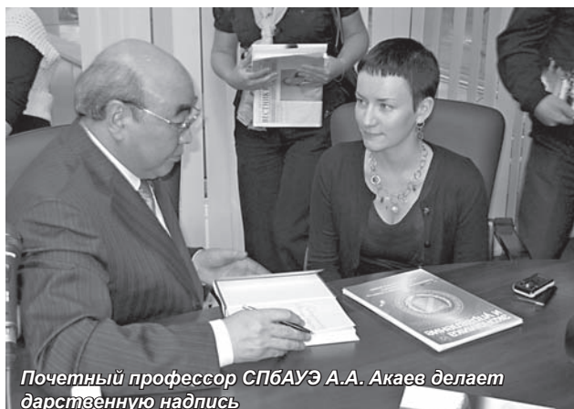
Почетный профессор СПбАУЭ А.А. Акаев делает дарственную надпись

23 апреля в рамках Международного книжного салона состоялась презентация книги члена Союза писателей России, доктора философ-