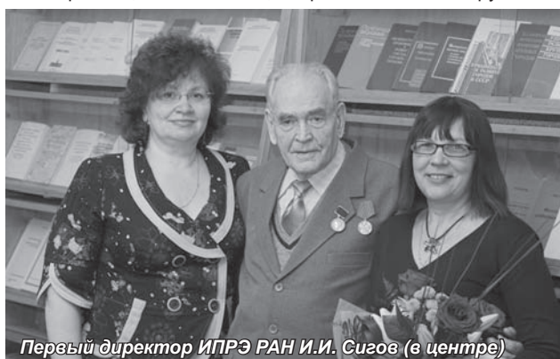
Первый директор ИПРЭ РАН И.И. Сигов (в центре)