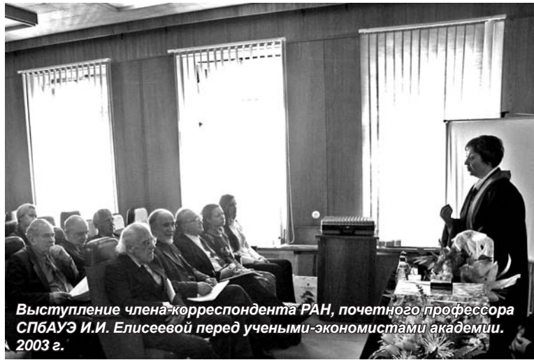
Выступление члена-корреспондента РАН, почетного профессора СПбГАУЭ И.И. Елисеевой перед учеными-экономистами академии. 2003 г.

Следует отметить не только существенное увеличение числа отраслей науки, в рамках которых выполняются научные исследования, но и значительное расширение спектра фундаментальных и прикладных исследований, их качественное изменение, выраженная направленность на обеспечение инновационного развития отраслей и сфер экономики, использование инновационных форм и методов менеджмента.