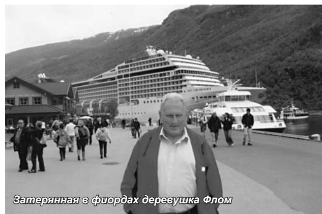
Затерянная в фиордах деревушка Флом