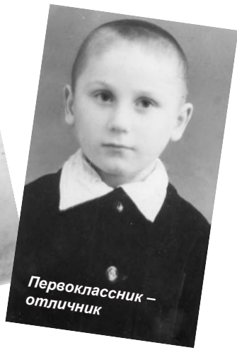
Первоклассник – отличник