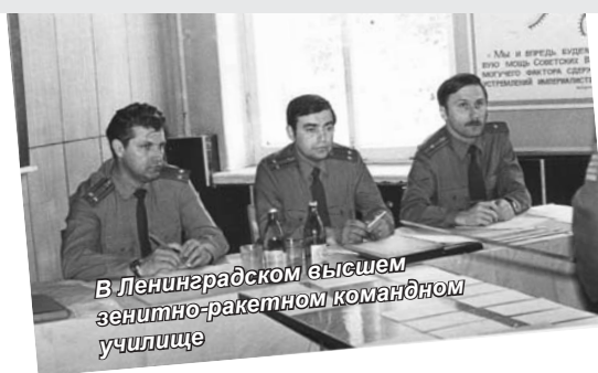
В Ленинградском высшем зенитно-ракетном командном училище