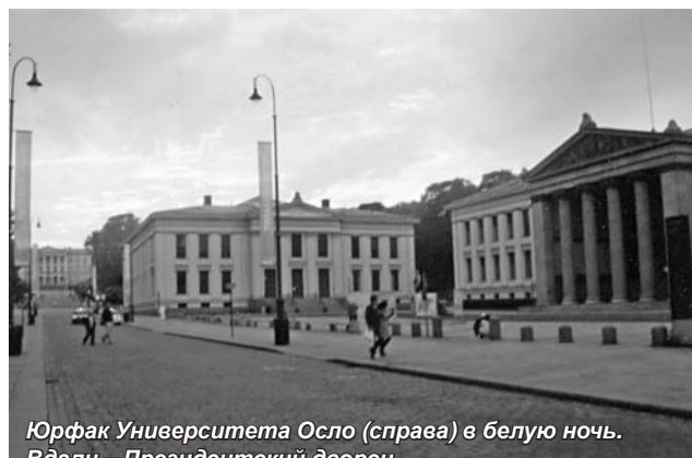
Юрфак Университета Осло (справа) в белую ночь. Вдали – Президентский дворец