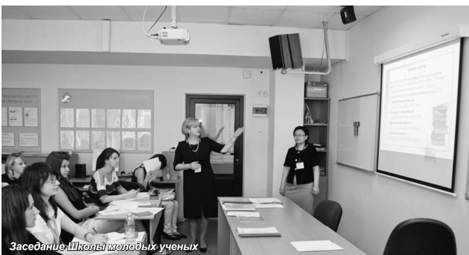
Заседание Школы молодых ученых

Уже не первый год самое активное участие в работе конференции принимают студенты и аспиранты из многих вузов Санкт-Петербурга. Для студентов и аспирантов на конференции были организованы и с большим успехом прошли четыре мастер-класса: «Наука и здоровье», «Наука и искусство», «Наука и PR», «Наука и процесс глобали-