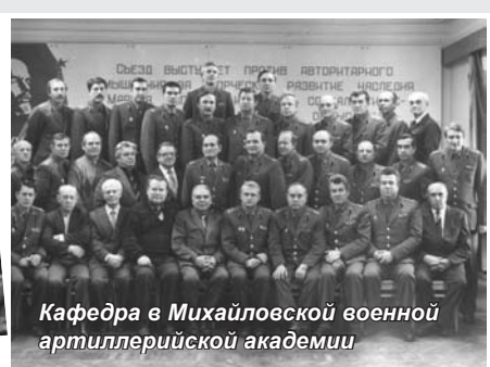
Кафедра в Михайловской военной артиллерийской академии