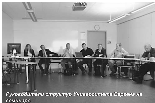
Руководители структур Университета Бергена на семинаре