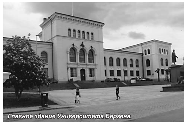
Главное здание Университета Бергена