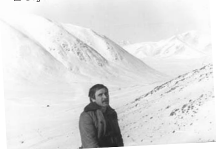
В горах Алтая