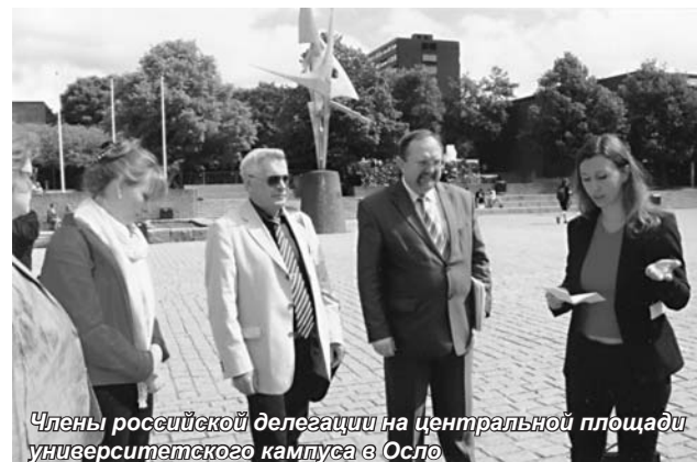
Члены российской делегации на центральной площади университетского кампуса в Осло