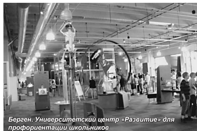
Берген. Университетский центр «Развитие» для профориентации школьников