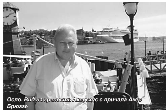
Осло. Вид на крепость Акерсхус с причала Акер Брюгге