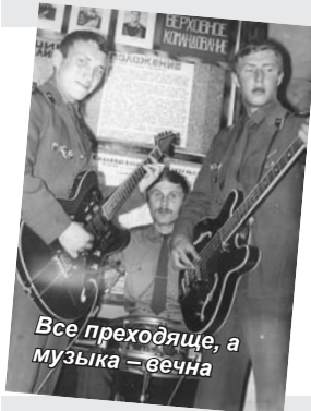
Все проходящее, а музыка – вечна