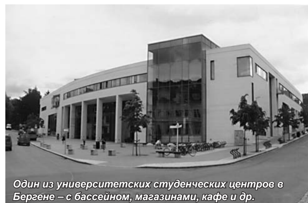
Один из университетских студенческих центров в Бергене – с бассейном, магазинами, кафе и др.