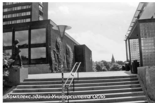
Комплекс зданий Университета Осло