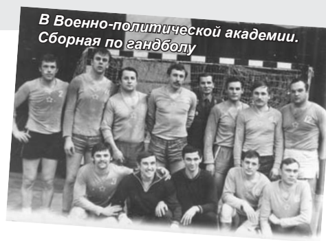
В Военно-политической академии. Сборная по гандболу