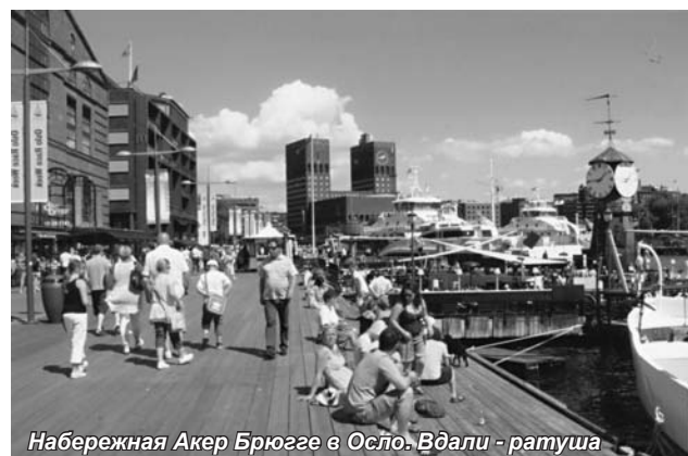
Набережная Акер Брюгге в Осло. Вдали – ратуша