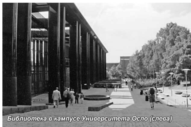
Библиотека в кампусе Университета Осло (слева)