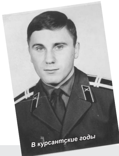
В курсантские годы