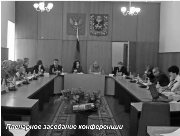
Пленарное заседание конференции

В Псковском филиале Санкт-Петербургской академии управления и экономики состоялась межвузовская научно-практическая конференция «Опыт и перспективы развития высшего профессионального образования в условиях модернизации системы российского образования». В работе конференции приняли участие представители региональных органов власти, руководители предприятий и организаций, ученые и преподаватели высшей школы, представители бизнеса. Пленарное заседание конференции было проведено в малом зале Псковского областного Собрания депутатов.