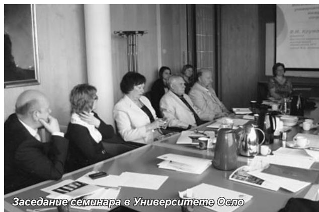
Заседание семинара в Университете Осло