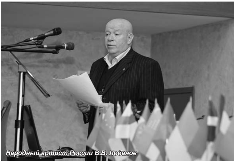
Народный артист России В.В. Лобанов