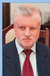
С.М. Миронов – председатель Совета Федерации Федерального собрания РФ