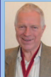
Э. Фелпс – лауреат Нобелевской пре- мии по экономи- ке, профессор Колумбийского университета, по- четный профессор СПбАУЭ

Уважаемые первокурсники, а также продолжающие обучение студенты и преподаватели Санкт-Петербургской академии управления и экономики!