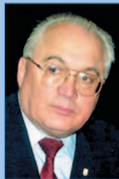
В.А. Садовничий – вице-президент РАН, президент Российского Союза ректоров, ректор МГУ им. М.В. Ломоносова, академик РАН

Желаю коллективу Санкт-Петербургской академии управления и экономики славных творческих достижений на благо отечественного образования. Студентам – интересных и полезных занятий в наступающем учебном году, а профессорам и преподавателям – внимательных и сообразительных студентов. Желаю всем успехов и благополучия.