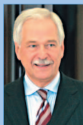
Б.В. Грызлов – председатель Государственной думы Федерального собрания РФ

Желаю всем благополучия, энергии, удачи, творческого вдохновения, осуществления самых смелых планов и начинаний во имя Отечества.