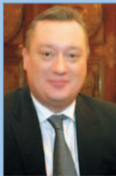
В.А. Тюльпанов - председатель Законодательного собрания Санкт- Петербурга

Развитие кадрового потенциала сегодня – это развитие стратегического ресурса российской экономики. Выражение «кадры решают все» как никогда актуально в настоящий момент. Решение задач по выводу страны из кризиса по силам только компетентным и универсально образованным специалистам.