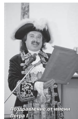
Поздравление от имени Петра I

Вполне разделяя точку зрения о том, что студенческая пора – лучшее время жизни,