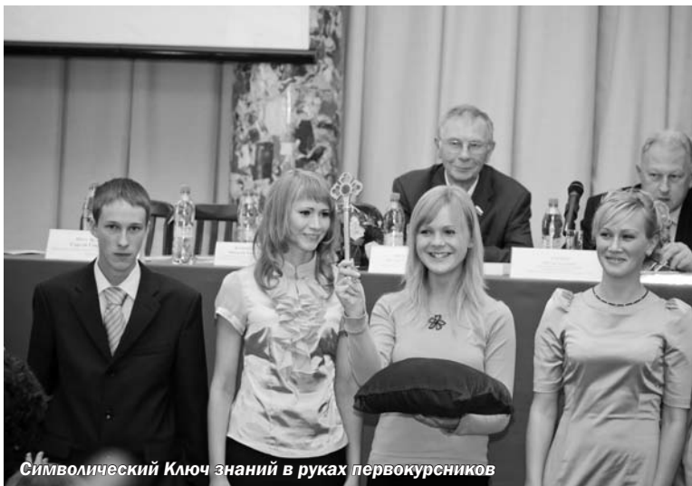
Символический Ключ знаний в руках первокурсников

На торжественной церемонии посвящения в студенты первокурсникам представили деканов факультетов и заведующих кафедрами. По итогам ра-