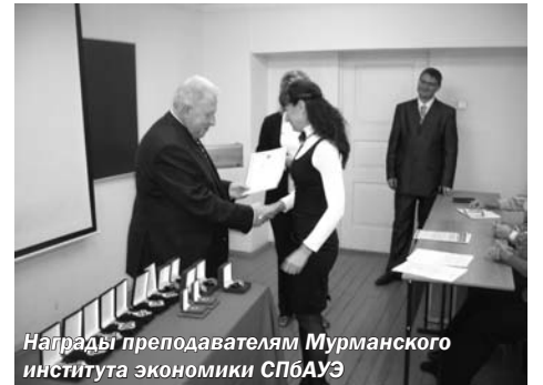
Награды преподавателям Мурманского института экономики СПбАУЭ