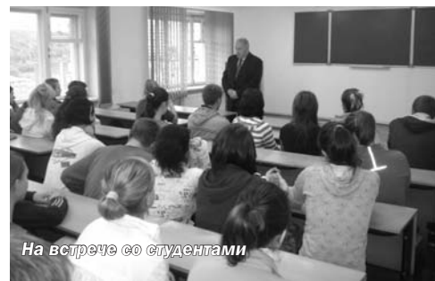
На встрече со студентами

потенциала развития Мурманского института экономики, обсуждались ректором Санкт-Петербургской акаде-