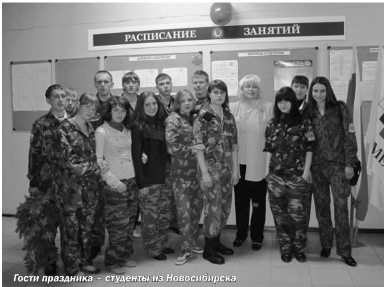
Гости праздника – студенты из Новосибирска

«Мужество, героизм, воля», с которым Киришский филиал связывают многолетняя дружба и ежегодный День знаний. От администрации города Кириши и Киришского района студентов и преподавателей филиала поздравила председатель Комитета финансов Киришского