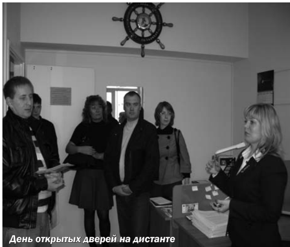
День открытых дверей на дистанте

В 1998 году, ещё будучи Институтом управления и экономики, наш вуз тесно сотрудничал с органами местного самоуправления и государственной службы. В конце 90-х годов остро стоял вопрос о подготовке специалистов для новых для Российской Федерации представительских органов – муниципалитетов. Группа новаторов-энтузиастов, поддер-