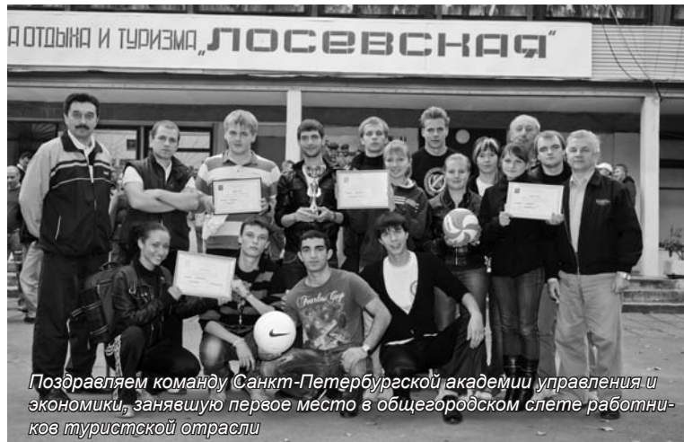
Поздравляем команду Санкт-Петербургской академии управления и экономики, занявшую первое место в общебродском слете работников туристской отрасли

Псково-Печорский мужской монастырь – один из самых крупных и богатых в России мужских монастырей с многовековой историей, действующий по сей день. Расположен он в 50 км. на запад от Пскова, ведет свою историю уже 537 лет. Монастырь ни разу за всю свою историю не закрылся (в межвоенный период и до 1945 находился на территории Эстонии, благодаря чему сохранился). На территории мона-