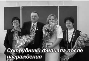
Сотрудники филиала после награждения