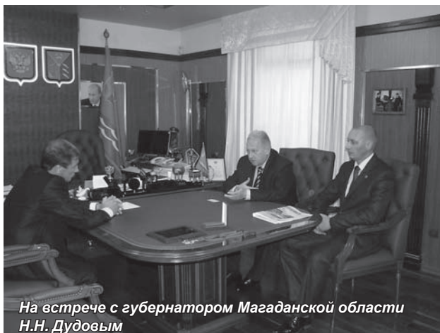
На встрече с губернатором Магаданской области Н.Н. Дудовым