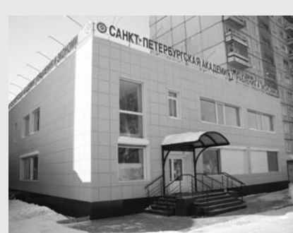
Новосибирский филиал Санкт-Петербургской академии управления и экономики создан в

1999 году. Основная цель создания филиала в городе, в котором работают 32 высших учебных заведения (11 университетов, 8 академий, 13 институтов) и 14 филиалов вузов других городов России – дать возможность каждому молодому человеку получить качественное образование в столичном вузе. В филиале Академии все создано для того, чтобы каждый студент стал настоящим профессионалом и хорошим