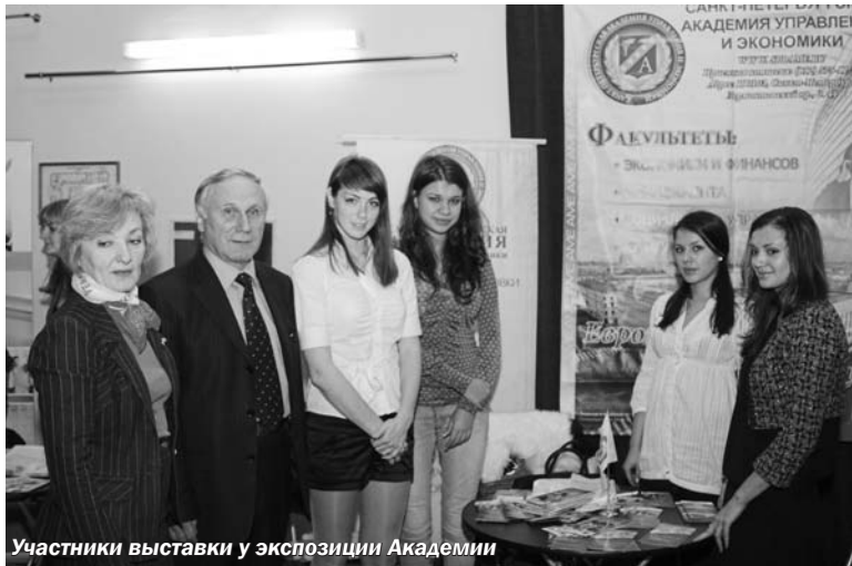
Участники выставки у экспозиции Академии

Она пожелала выпускникам успехов в учебе и выборе будущей профессии. Представители двенадцати вузов района пригласили ребят ознакомиться с экспозициями выставки и просмотреть рекламные видеоролики. Присутствующие отмечали высокое качество видеоролика именно нашей Академии и даже просили подарить им копии для показа в своих учебных заведениях.