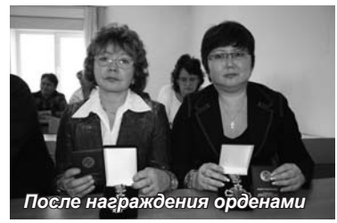
После награждения орденами

Торжественную встречу с профессорско-преподавательским