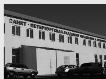
Алтайский филиал Санкт-Петербургской академии управ-

ления и экономики был создан в 1998 году. В декабре 2005 года решением Ученого совета СПбАУЭ он был преобразован в Алтайский институт экономики – филиал Санкт-Петербургской академии управления и экономики. За период своего существования Алтайский институт экономики прошел большой путь становления и развития, завоевал высокий авторитет в регионе. В институте сформиро-