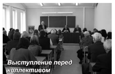
Выступление перед коллективом

На торжественном собрании присутствовал председатель Комитета по образованию, науке и культуре За-