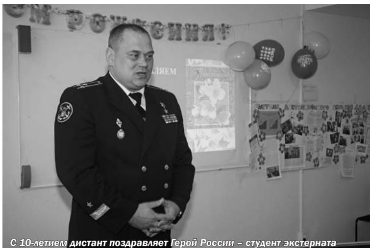
С 10-летием дистант поздравляет Герой России – студент экстерната

Также следует заметить, что в последнее время вопросам повышения качества высшего образования, проблемам внедрения в процесс обучения новых технологий, форм и способов передачи знаний уделяется много внимания. Этого требуют реалии времени, в результате которых сформировалась потребность в сотрудниках нового типа. И удовлетворить эту потребность – основная задача современных вузов. Решение данной задачи напрямую связано с повышением эффективности обучения, использованием современных средств коммуникации и обучающих технологий. Поэтому одним из актуальных направ-