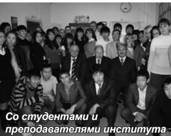
Со студентами и преподавателями института