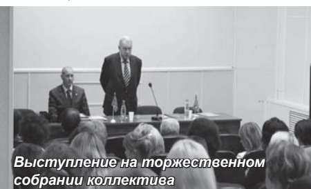
Выступление на торжественном собрании коллектива

научно-исследовательских работ, повышении квалификации государственных и муниципальных служащих. На встрече было принято решение о том, что Магаданский институт экономики подготовит новые предложения в адрес Администрации области по введению новых образовательных программ.