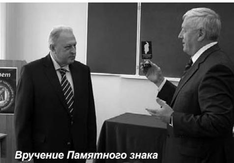
Вручение Памятного знака