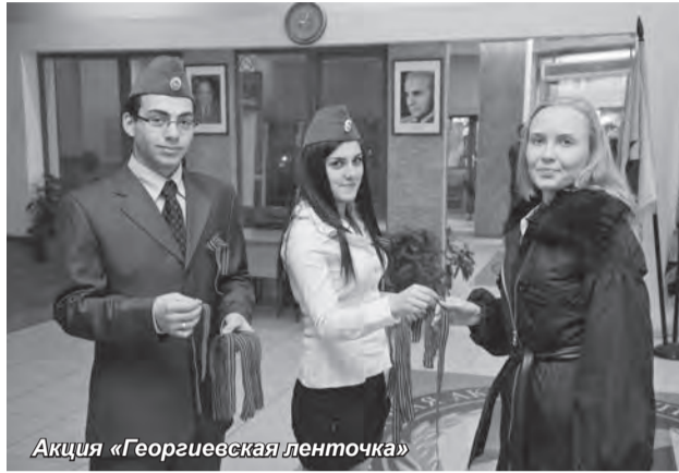
Акция «Георгиевская ленточка»

В преддверии празднования 66-годовщины Победы в Великой Отечественной войне, 5 мая, в Санкт-Петербургской