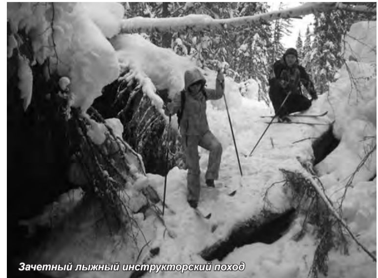
Зачетный лыжный инструкторский поход

ществом при трудоустройстве на должность менеджера туристического агентства.