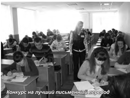
Конкурс на лучший письменный перевод

аспиранты других учебных заведений Смоленска и регионов России. В этом учебном году V Межрегиональная студенческая научная неделя «Молодые ученые – будущее России», посвященная 300-летию со дня рождения М.В. Ломоносова проходила с 18 по 22 апреля 2011 года. В рамках студенческого праздника науки прошли следующие мероприятия: научно-практические конференции «Актуальные проблемы