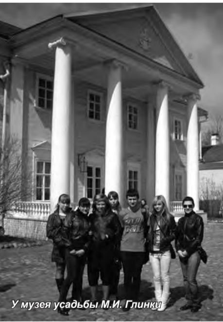
У музея усадьбы М.И. Глинки