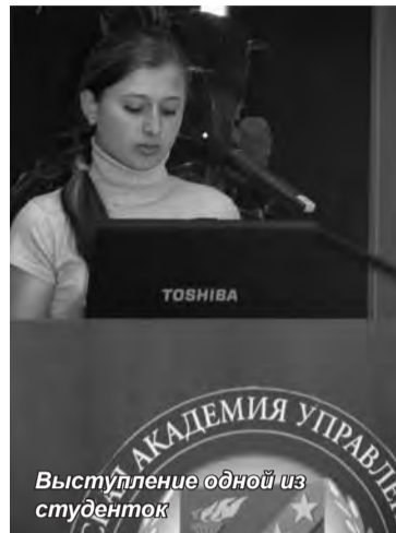
Выступление одной из студенток