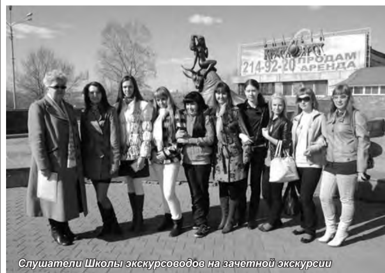
Слушатели Школы экскурсоводов на зачетной экскурсии

Говорить так, чтобы часами удерживать внимание 30-40 человек, уметь добывать проверенные данные, а не выуживать первые попавшиеся сведения из Всемирной паутины, и систематизировать их — для современной молодежи это очень полезные навыки. Некоторые из выпускников школы признаются — экскурсоводами работать не планируют, а полученные знания им пригодятся для построения карьеры в других областях, например, станут конкурентным преимуществом при трудоустройстве на работу в сфере туризма.