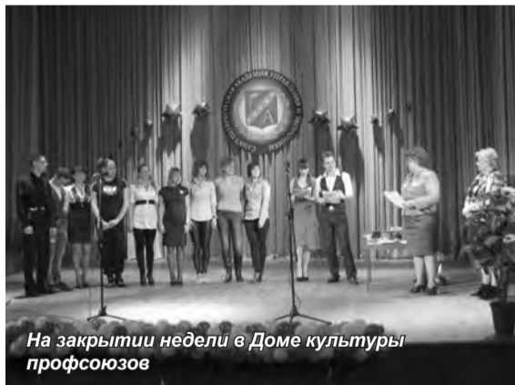
На закрытии недели в Доме культуры профсоюз

социально-экономического развития региона: взгляд молодых ученых», «Национальное наследие Смоленщины: культурно-исторические и социально-экономические аспекты», посвященная 50-летию полета Ю.А. Гагарина в космос, «Современные проблемы развития финансово-кредитной системы России и пути их решения», Интернет-конференция «Язык как зеркало культуры», «Перепись населения как инструмент прогнозирования социально-экономических и демографических процессов государства», «Человек. Культура. Общество», а также конкурс на лучший письменный перевод профессионально-ориентированного текста, III Межвузовская олимпиада по Мировой экономике, Межрегиональная студенческая олимпиада