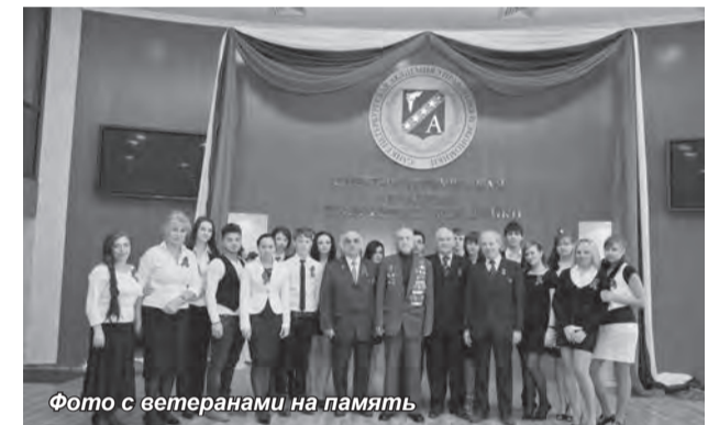
Фото с ветеранами на память