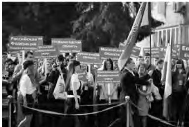
Информация Уральского института экономики

се социально-экономических преобразований. В рамках форума состоялась работа секций по актуальным проблемам образования, науки, бизнеса и власти. Студенты Уральского института экономики приняли участие в работе секции «Формирование современной системы туристической и гостиничного бизнеса», где рассматривались вопросы современного потребительского рынка и сферы услуг, а также формирования современной системы туристической и гостиничного бизнеса.