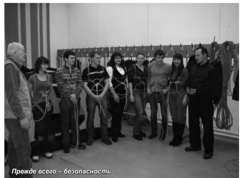
Прежде всего — безопасность

«В целом маршрут несложен, но наличие значительного количества подъемов и спусков, крутых пово-