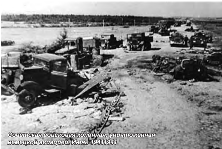
Советская войсковая колонна, уничтоженная немецкой авиацией. Июнь 1941

Однако готовность войск к отражению надвигающейся агрессии во многом зависела от организаторских и профессиональных качеств коман-