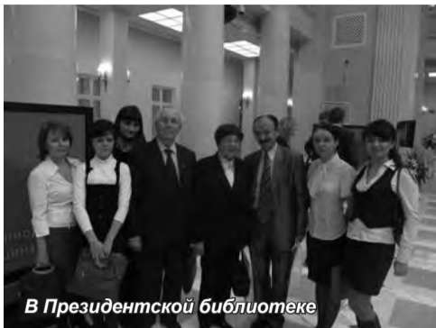
В Президентской библиотеке

14 апреля студенты, сотрудники и преподаватели юридического факультета Санкт-Петербургской акаде-