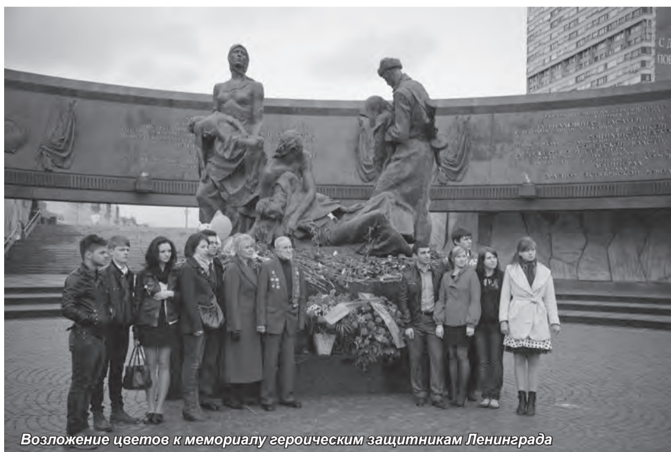
Возложение цветов к мемориалу героическим защитникам Ленинграда