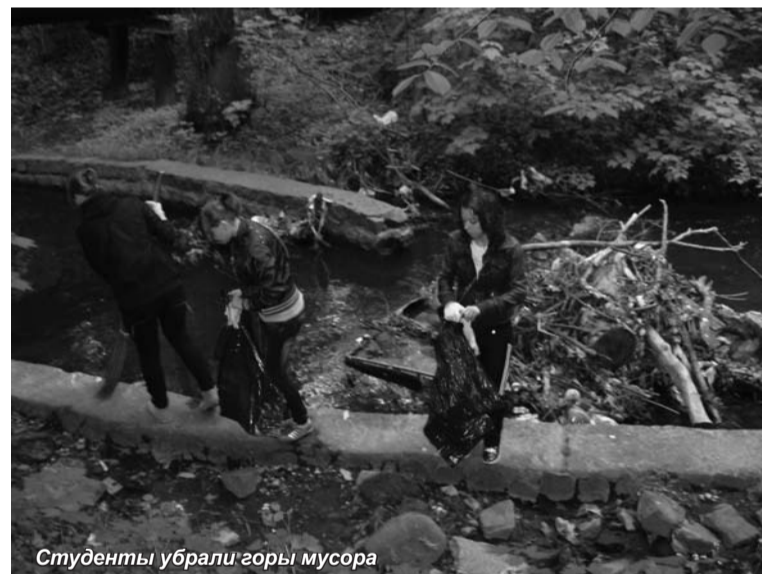
Студенты убрали горы мусора

В мае в Калининградской области прошла благотворительная экологическая акция «Сделаем вместе - 2011». Цель этой акции состояла в том, чтобы убрать весь мусор в городе Калининграде и области. В акции приняли участие сотни калининградцев, которые весь день убрали мусор. В том числе и мы - студенты Калининградского института экономики СПбГУЭ, откликнулись на это предложение. Нам достался довольно сложный участок в Центральном районе города. Это ручей, который течет возле зоопарка и тянется по всему городу. Получив перчатки, грабли и мусорные пакеты, мы отправились очищать речку и прилегающую к ней территорию.