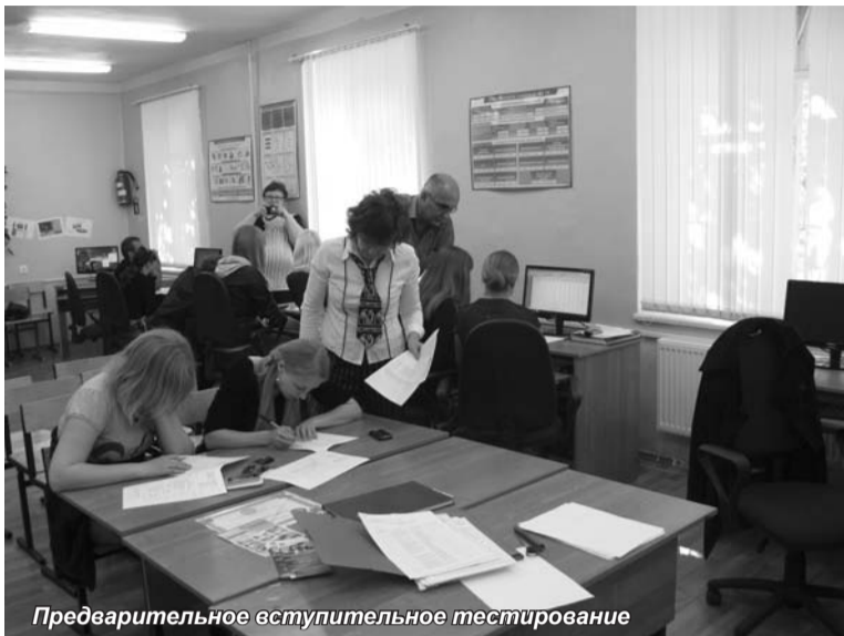
Предварительное вступительное тестирование

С 26 по 28 мая состоялась поездка представителей Санкт-Петербургского университета управления и экономики в г. Валдай. Основной целью поездки было проведение профориентационной работы в Колледже сервиса и управления и Валдайском филиале Новгородского агротехнического техникума.