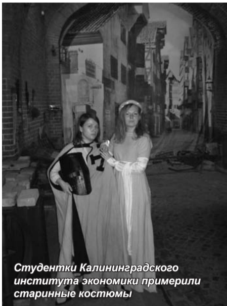
Студентки Калининградского института экономики примерили старинные костюмы

В Калининграде уже стало замечательной традицией проведение Музейной ночи, которая в этом году проводилась с 13 на 14 мая. И традиционным является участие наших студентов в этом удивительном проекте.