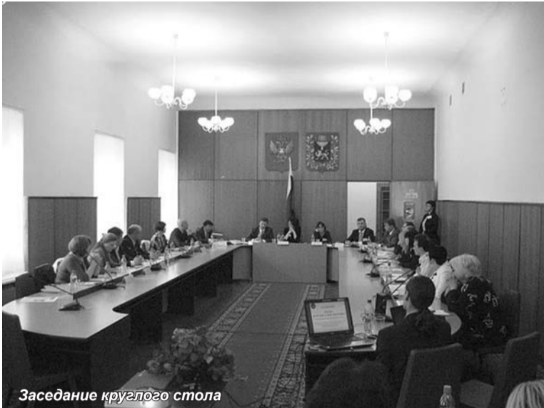
Заседание круглого стола

Международная научно-практическая конференция «Формирование инвестиционного климата приграничных территорий» вызвала сильный резонанс в научном и бизнес сообществе не только города Пскова, прилегающих областей, но и зарубежья.