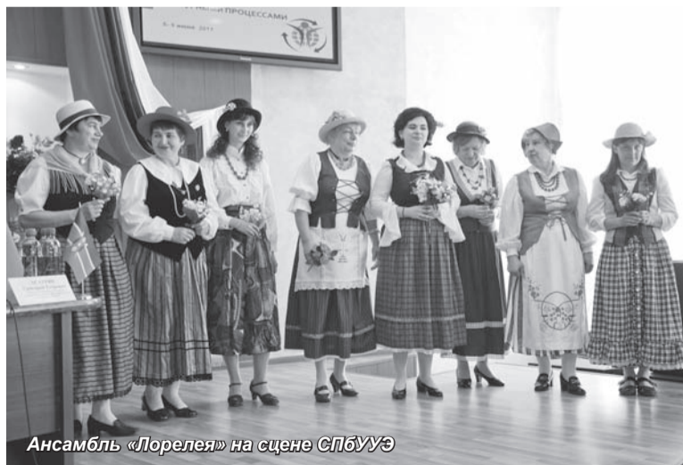
Ансамбль «Лорелея» на сцене СПбГУЭ

В рамках проходившей в Санкт-Петербургском университете управления и экономики Международной научно-практической конференции «Диалог культур – 2011: управление социально-культурными процессами» состоялось выступление ансамбля немецкой песни «Лорелея». В составе ансамбля – представители эт-