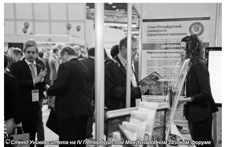
Стенд Университета на IV Петербургском Международном газовом форуме