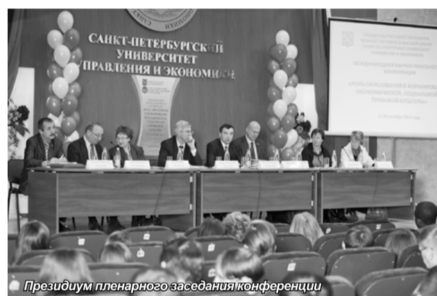
Президиум пленарного заседания конференции

В Санкт-Петербургском университете управления и экономики 23 – 24 октября прошла Международная научно-практическая конференция «Роль образования в формировании экономической, социальной и правовой культуры», организованная совместно с Комитетом по науке и высшей школе Санкт-Петербурга.