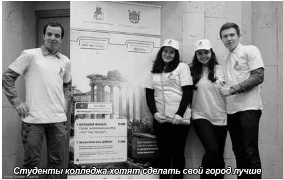
Студенты колледжа хотят сделать свой город лучше

С 16 по 17 октября в городе на Неве, в рамках общегородской программы «Я хочу сделать свой городу лучше», в Университете ЛЭТИ прошли Экологические дебаты. Студенты колледжа Санкт-Петербургского университета управления и экономики приняли