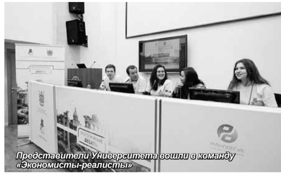
Представители Университета вошли в команду «Экономисты-реалисты»