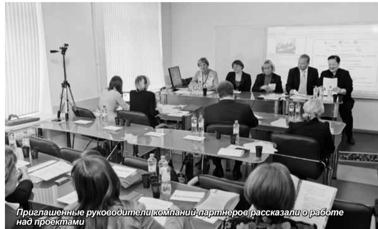
Приглашенные руководители компаний-партнеров рассказали о работе над проектами

с 2011 по 2014 год под руководством Северо-Западного агентства международных программ в партнерстве с финской международной организацией «АМКЕ Интернешнл», принимали участие образовательные организации среднего и высшего профессионального образования и партнерские компании и организации в секторах «Строительство» и «Гостиничный сервис». Санкт-Петербургский университет управления и экономики является участником проекта PROSKILLS с 2013 года.