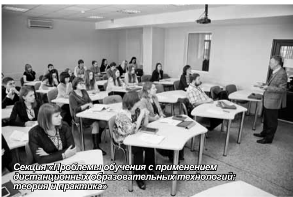
Секция «Проблемы обучения с применением дистанционных образовательных технологий: теория и практика»

Во второй день конференции активное обсуждение актуальных вопросов продолжилось на заседаниях