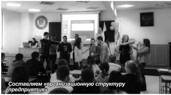
Составляем «организационную структуру предприятия»

Информация Алтайского института экономики