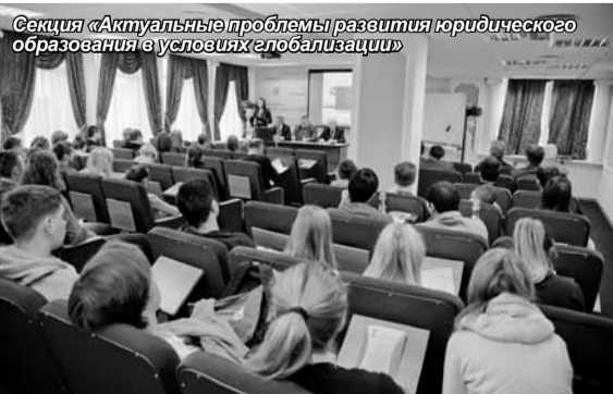
Секция «Актуальные проблемы развития юридического образования в условиях глобализации»