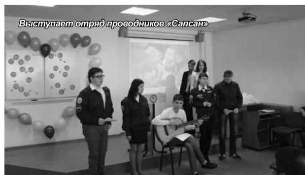
Выступает отряд проводников «Сапсан»

ными грамотами и ценными призами. Подвели итоги фотовыставки и выставки прикладного творчества, каждый участник получил диплом и сладкий приз. Капустник, как всегда, капустными пирогами!