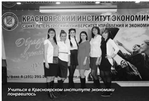
Учиться в Красноярском институте экономики понравилось

блиотека, современное компьютерное оснащение, высококвалифицированный преподавательский состав. Так, все преподаватели кафедры «Экономика» имеют опыт работы более 10-ти лет, а 50% из них - более 20-ти лет, 90% имеют ученые степени. Немаловажным преимуществом с точки зрения студентов является и доброжелательное отношение к ним.