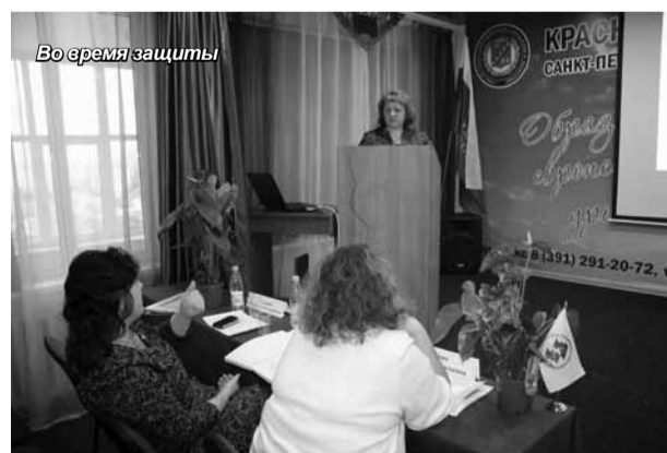
Во время защиты

Что же касается самих выпускников, то они покидают вуз с чувством благодарности. Говорят, что учиться в Красноярском институте экономики им очень понравилось. Здесь прекрасные условия для обучения - отличная би-