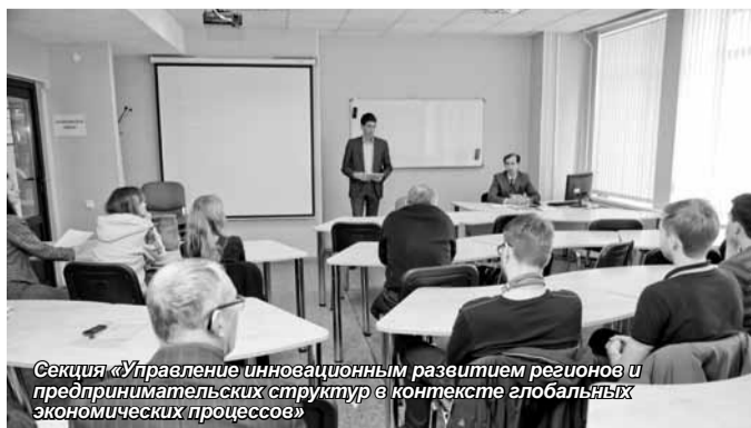
Секция «Управление инновационным развитием регионов и предпринимательских структур в контексте глобальных экономических процессов»