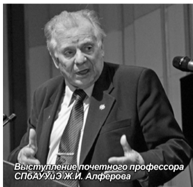
Выступление почетного профессора СПбАУУиЭ Ж.И. Алферова