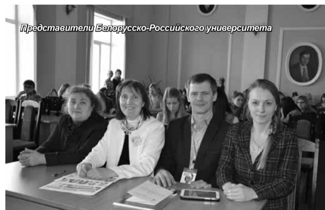
Представители Белорусско-Российского университета