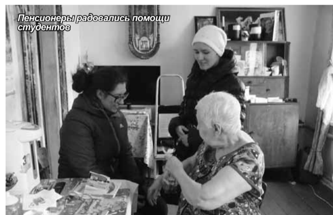
Пенсионеры радовались помощи студентов