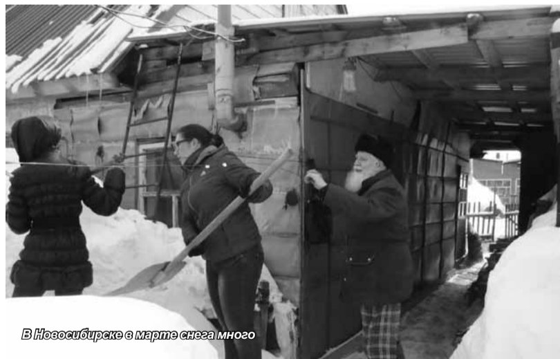
В Новосибирске в марте снега много

Студенты Новосибирского филиала, как всегда, были в первых рядах «добрых людей». Большой отряд наших волонтеров прибыл в администрацию Октябрьского района, получил задание от волонтерского штаба – и в путь! Предстояло побывать у ветеранов труда по четырем адресам. Каждая подгруппа получила свое задание. Бабушки и дедушки радушно и приветливо встретили молодых и веселых помощников. Каждому нашлась работа по душе. Девчонки мыли и чистили после долгой зимы квартиры, ребята сбрасывали снег с крыш и построек, расчищали дорожки, разгребали двухметровые сугробы.