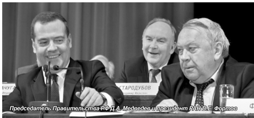
Председатель Правительства РФ Д.А. Медведев и президент РАН В.Е. Фортвов

В Большом зале Российской академии наук 24–25 марта проходило ежегодное общее собрание РАН