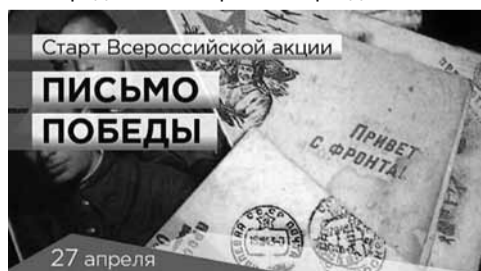
Старт Всероссийской акции ПИСЬМО ПОБЕДЫ

О других акциях и мероприятиях, таких как «Письмо Победы», гонка ГТО «Путь Победы», «Стена памяти», «Сирень Победы», акция реконструкторов «Солдатская каша» и многих других и о работе Волонтерского корпуса в Санкт-Петербурге можно подробнее узнать на официальном сайте Комитета во вкладке «70 лет Великой Победы»: http://gov.spb.ru/gov .