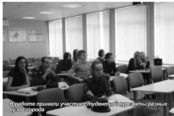
В работе приняли участие студенты и курсанты разных вузов города

В рамках проходящей в стенах Санкт-Петербургского академического университета управления и экономики международной научно-практической конференции