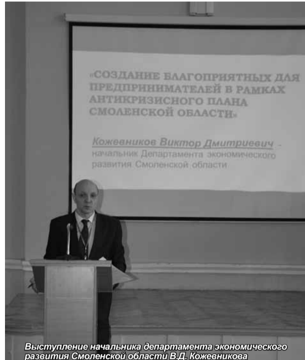
Выступление начальника департамента экономического развития Смоленской области В.Д. Кожевникова

В результате обсуждения выдвинутых проблем, участники конференции утвердили проект резолюции, в котором были сформулированы наиболее острые, требующие решения проблемы развития предпринимательства в Смоленской области и других регионах России, а также конкретные рекомендации по консолидации усилий всех заинтересованных сторон и решению этих проблем.