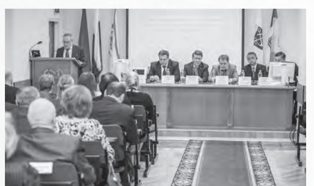
Газета «Менеджер» № 9, 11 июня