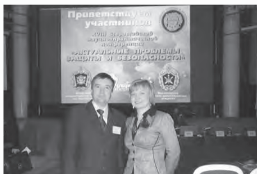
Газета «Менеджер» № 6, 16 апреля

Участники конференции поставили перед собой цель на основе глубокого анализа складывающейся геополитической обстановки, вызовов и угроз современности разработать актуальные элементы научного аппарата, практические рекомендации и конкретные предложения по совершенствованию комплексной безопасности РФ.