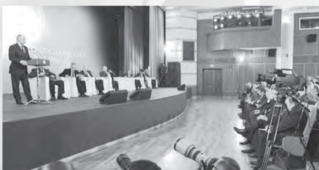
Газета «Менеджер» № 18, 14 ноября

В работе пленарного заседания X Съезда Российского Союза ректоров принял участие В.В. Путин.