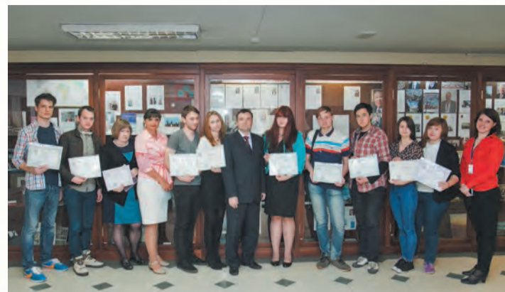
Газета «Менеджер» № 8, 29 мая

Подведение итогов конкурса на лучшую научно-исследовательскую работу среди студентов СПбАУиЭ в 2014/2015 учебном году и награждение победителей состоялось 14 мая.