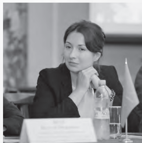
Газета «Менеджер» № 5, 30 марта