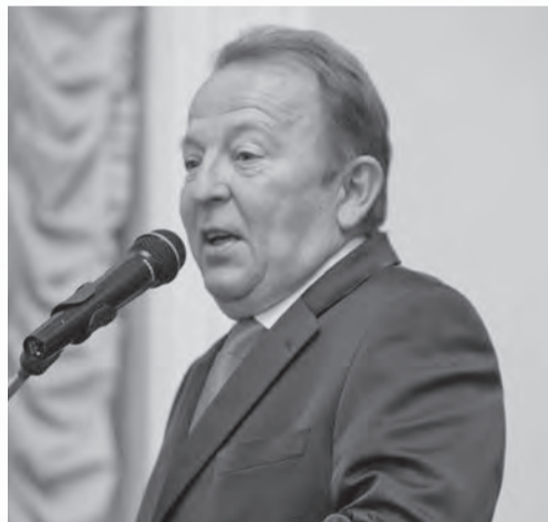
Газета «Менеджер» № 14, 17 сентября