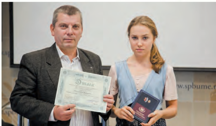
Газета «Менеджер» № 16, 23 октября

Наградой победителям конкурса стали Почетные грамоты, Знаки отличия «Законодательный резерв», а также посещение Государственной думы.