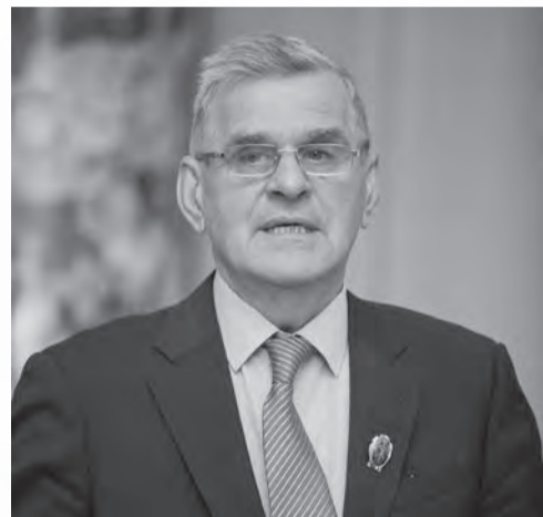
Газета «Менеджер» № 17, 31 октября

Председатель Профильной комиссии по науке и высшей школе Законодательного Собрания Санкт-Петербурга А.В. Воронцов в День первокурсника передал поздравление от председателя ЗакСа Макарова. Депутат отметил, что СПбАУУиЭ – один из авторитетнейших вузов Санкт-Петербурга, и это подтверждает тот факт, что все его выпускники трудоустроены. А.В. Воронцов особо отметил, что студентов и выпускников Университета отличает активная гражданская позиция, что очень важно в настоящее время.