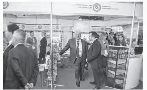
Газета «Менеджер» № 16, 23 октября