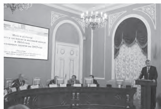
Газета «Менеджер» № 4, 6 марта