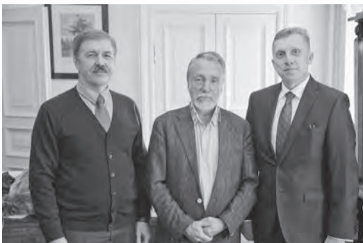
Газета «Менеджер» № 8, 29 мая