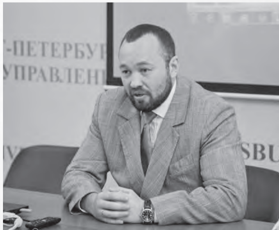
Газета «Менеджер» № 9, 11 июня