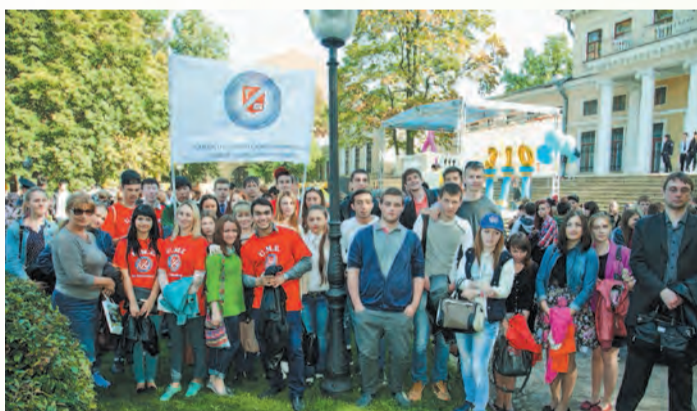
Газета «Менеджер» № 15, 30 сентября

Занятие по душе на празднике мог найти каждый – концерт, игры по станциям, танцевальные флеш-мобы, катания на лодках, презентации клуба юных моряков «Адмиралтеец», фотосессии, футбол, ярмарка досуга и многое другое. Все желающие смогли проверить свою физическую подготовку в спортивных мастер-классах и поиграть в «Веселые старты».