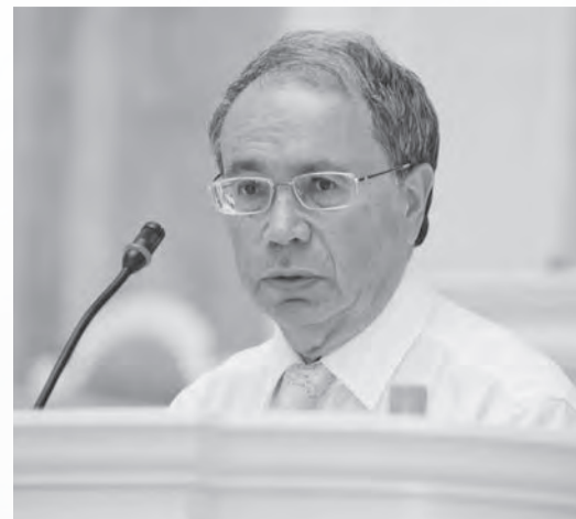
Газета «Менеджер» № 1, 30 января