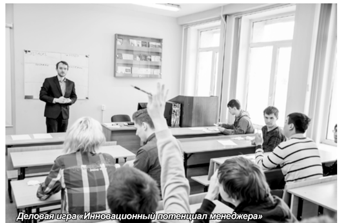
Деловая игра «Инновационный потенциал менеджера»