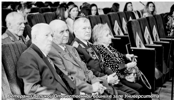
Ветераны Великой Отечественной войны в зале Университета