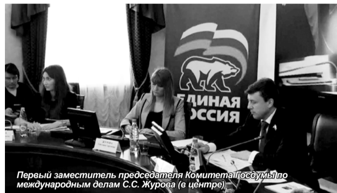
Первый заместитель председателя Комитета Госдумы по международным делам С.С. Журова (в центре)