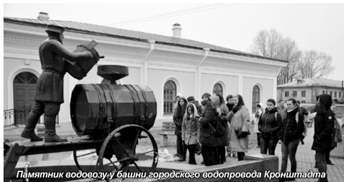
Памятник водовозу у башни городского водопровода Кронштадта