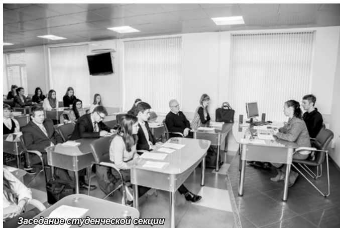
Заседание студенческой секции