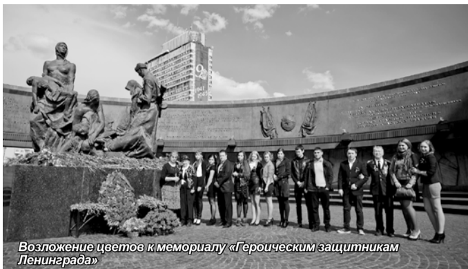
Возложение цветов к мемориалу «Героическим защитникам Ленинграда»