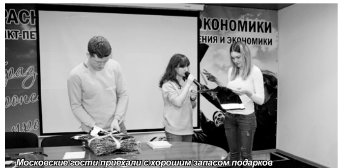
Московские гости приехали с хорошим запасом подарков