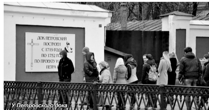
У Петровского дока