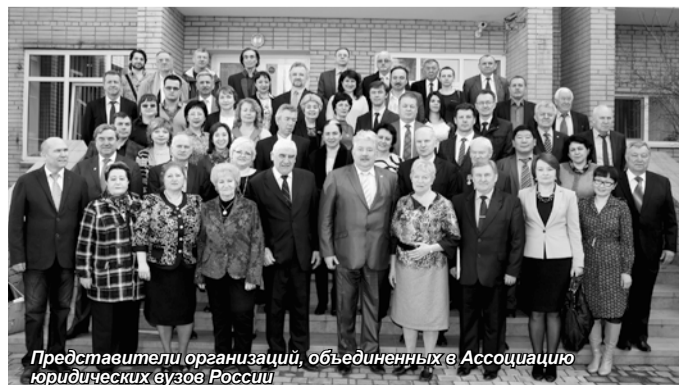
Представители организаций, объединенных в Ассоциацию юридических вузов России