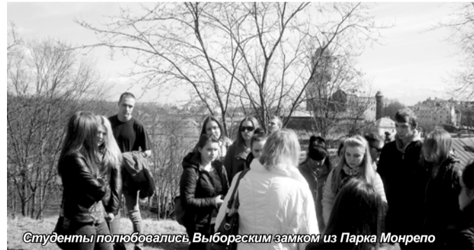
Студенты полюбовались Выборгским замком из Парка Монрепо