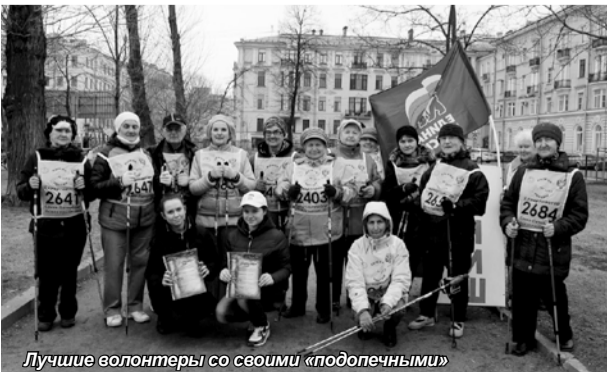
Лучшие волонтеры со своими «подопечными»

Что такое «скандинавская ходьба» или «северная ходьба»? Эта разновидность спортивной ходьбы появилась в Финляндии в 40-х годах XX века, и сейчас мил-