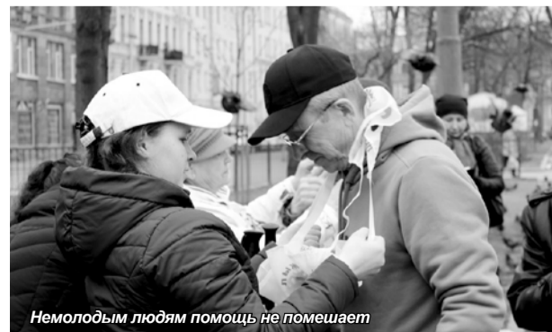
Немолодым людям помощь не помешает

В муниципальном образовании «Коломна» подобные соревнования стали хорошей традицией и направлены в первую очередь на приобщение людей старшего поколения к активному виду отдыха. На финише всех участников ждали горячие