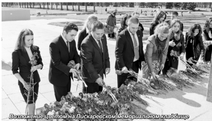
Возложение цветов на Пискаревском мемориальном кладбище

Пусть не прервется эта связь поколений, и во все времена потомки будут хранить в своих сердцах память о Великой Победе, передавать традиции своим детям и внукам.