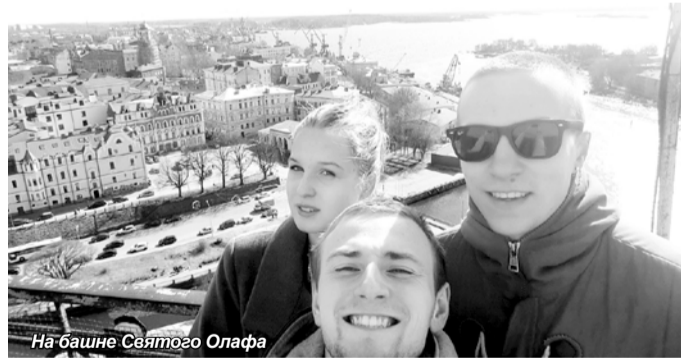
На башне Святого Олафа

Мероприятие прошло успешно, а главное, интересно! В нем приняли участие студенты направлений «Издательское дело», «Туризм», «Реклама и связи с общественностью» и других специальностей Института гуманитарных и социальных наук. Спасибо всем присутствовавшим и организаторам!»