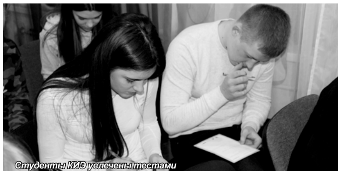
Студенты КИЭ увлечены тестами