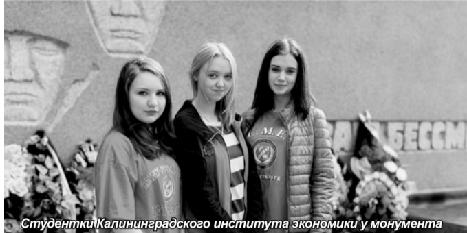
Студентки Калининградского института экономики у монумента

Как известно, кто забывает о своем прошлом, у того нет будущего. Страна без корней, без традиций – как оторванный от якоря корабль, который несет по воле волн или чьей-либо воле.