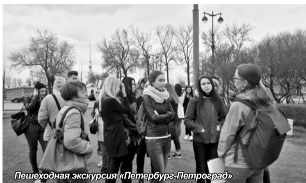
Пешеходная экскурсия «Петербург-Петроград»

нелегкой профессии, увековечены на стенах главного морского храма страны! На Якорной площади увидели и ажурный Макаровский мост через овраг, который был построен рабочими Морского завода специально к открытию Никольского собора для императора Николая II, чтобы он имел возможность пешком пройти к храму от Петровской пристани. Мы ходили по холодным улицам Кронштадта, ощущали суровость города и его силу, его славу. Но это не все. Нам еще предстояла экскурсия на легендарный форт Константин, где сохранились постройки разных периодов фортификации, включая уникальную батарею «Шведы» построенную в 60-х годах XIX века. В ходе увлекатель-