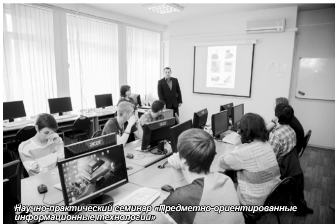
Научно-практический семинар «Предметно-ориентированные информационные технологии»

Для гостей вуза была также проведена экскурсия по Университету, которая включала знакомство с музеем САУ.