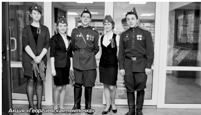
Акция «Георгиевская ленточка»