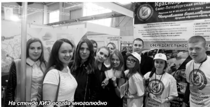
На стенде КИЭ всегда многолюдно