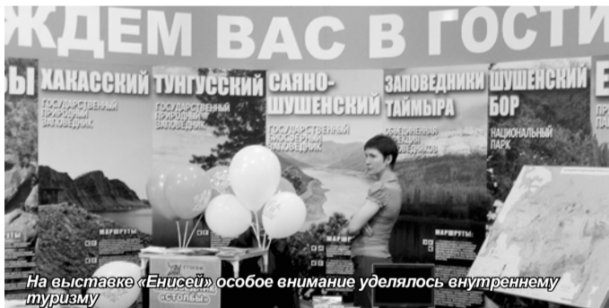
На выставке «Енисей» особое внимание уделялось внутреннему туризму