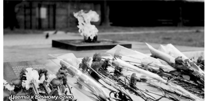
Цветы к Вечному огню