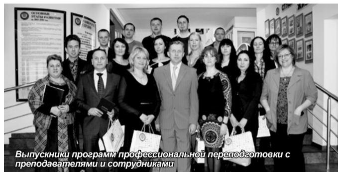
Выпускники программы профессиональной переподготовки с преподавателями и сотрудниками