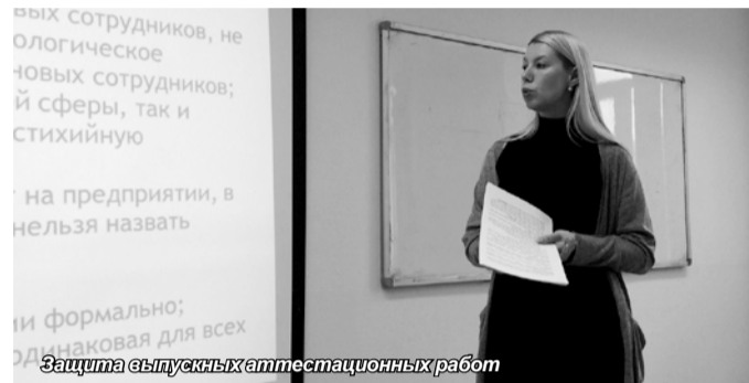
Защита выпускных аттестационных работ