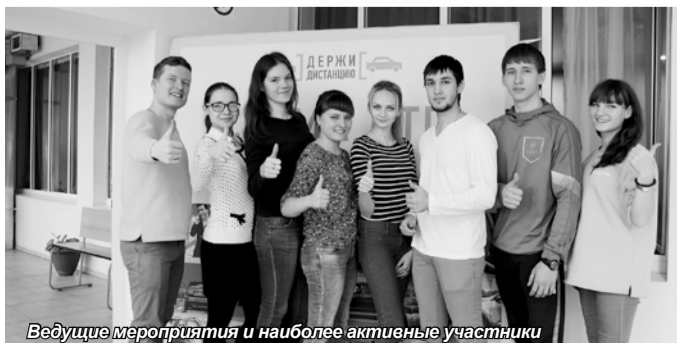
Ведущие мероприятия и наиболее активные участники