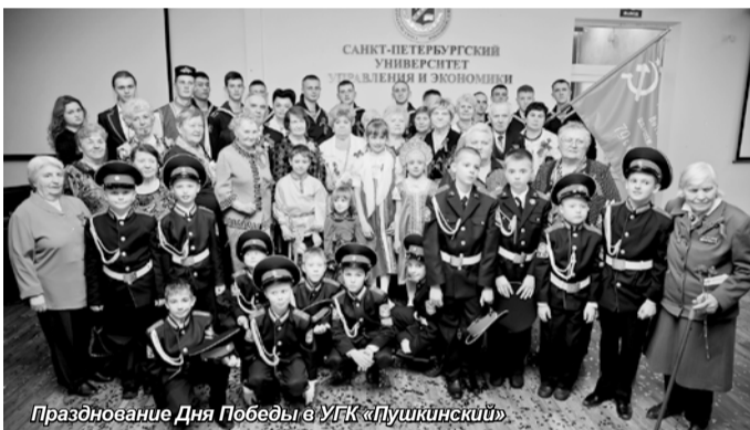
Празднование Дня Победы в УГК «Пушкинский»