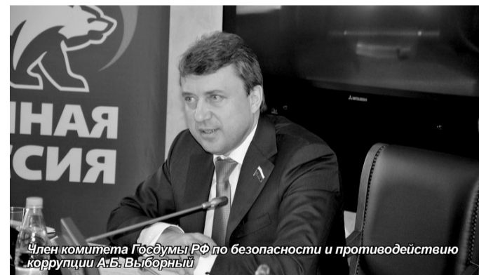
Член комитета Госдумы РФ по безопасности и противодействию коррупции А.Б. Выборный