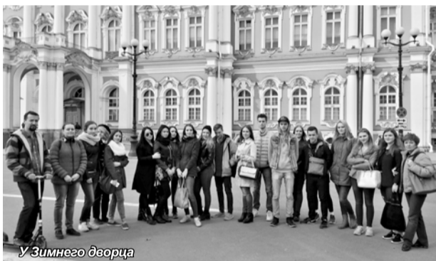
У Зимнего дворца

Помимо экскурсии по замку, нам предоставили время для прогулки по внутреннему дворику. Поднимающаяся в гору извилистая мощеная улочка – проход между Нижним и Верхним двором – является, пожалуй, самым тихим и очаровательным