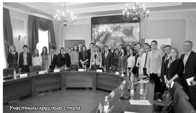
Участники круглого стола