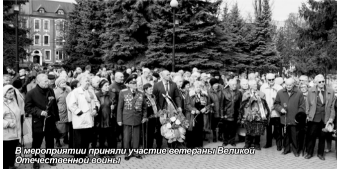
В мероприятии приняли участие ветераны Великой Отечественной войны