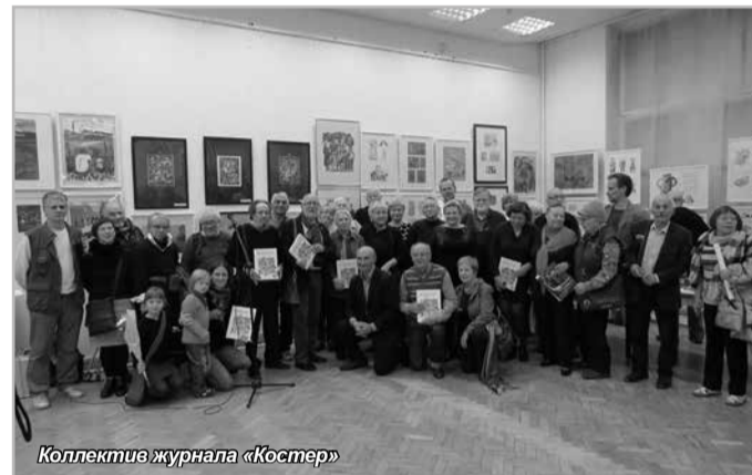
Коллектив журнала «Костёр»