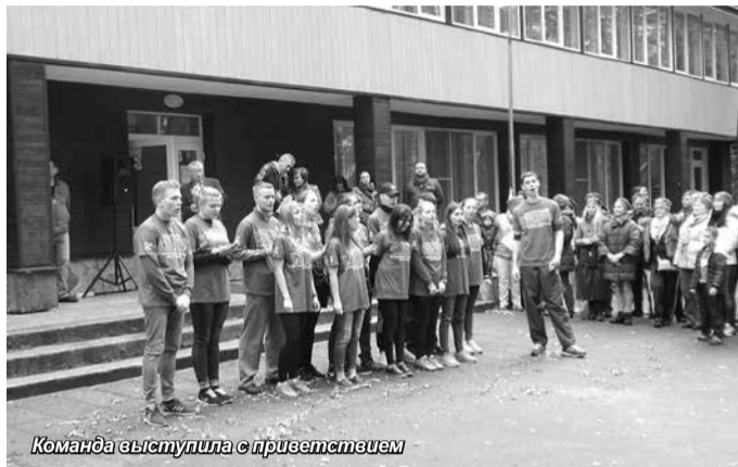
Команда выступила с приветствием