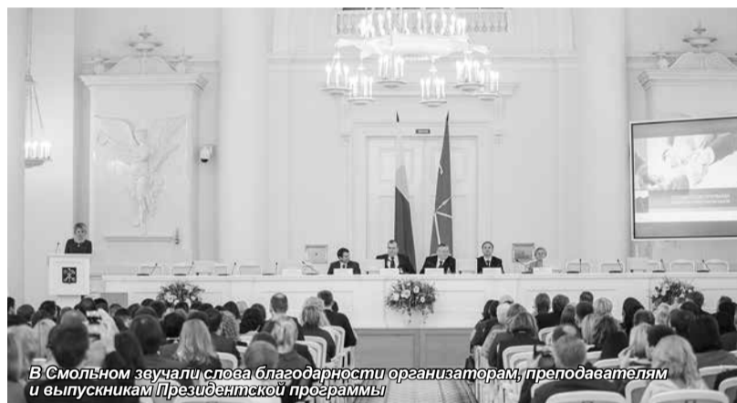
В Смольном звучали слова благодарности организаторам, преподавателям и выпускникам Президентской программы