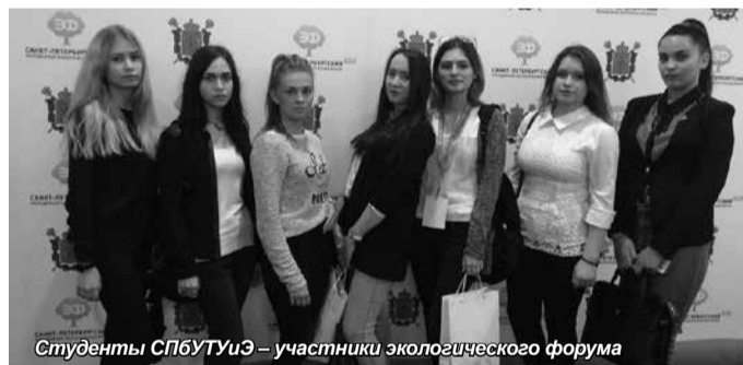
Студенты СПбУТИЭ – участники экологического форума