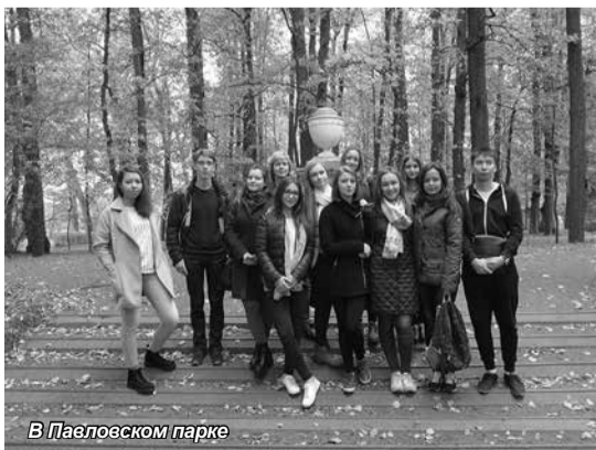
В Павловском парке

В этот экскурсионный день первокурсники узнали об истории императорской семьи, насладились красотой дворца, а также красотой осеннего дня, проведенного в парке музея-заповедника.