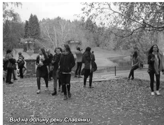
Вид на долину реки Славянки

Редакционный совет: В.А. Гневко (председатель), О.Г. Смешко (зам. председателя), Г.А. Костин (зам. председателя), Н.О. Воронова, Т.С. Алфимова, Е.В. Задорнова, С.О. Петров. Выпускающий редактор газеты «Менеджер» Е.О. Абрамова