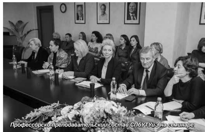
Профессорско-преподавательский состав СПБТУиЭ на семинаре