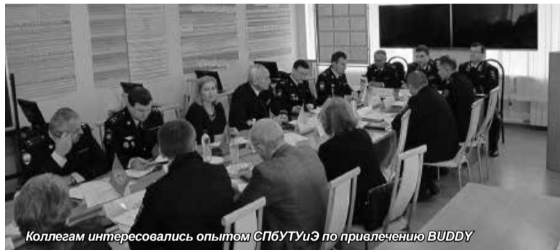
Коллегам интересовались опытом СПбУиЭ по привлечению BUDDY

Университет поделился опытом работы с иностранными студентами