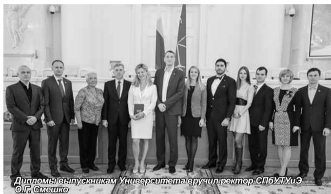
Дипломы выпускникам Университета вручил ректор СПбУТИЭ О.Г. Смешко