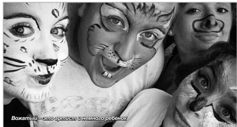
Вожатый – это артист и немного ребенок

Отличительной чертой студентов Санкт-Петербургского академического университета является высокая организованность, собранность и ответственность. Не лишне будет отметить, что в Университете большое внимание уделяется воспитательной работе, которая является составной частью учебного процесса и осуществляется на протяжении всего периода обучения в различных направлениях и видах. Наши студенты всесторонне развиты, эрудированны, имеют огромный творческий потенциал и поэтому достойно справляются с любой порученной им работой. Университет учит нас выдержке, дисциплине, преданности делу, честности, отзывчивости и, несомненно, гордится достижениями и успехами своих воспитанников.