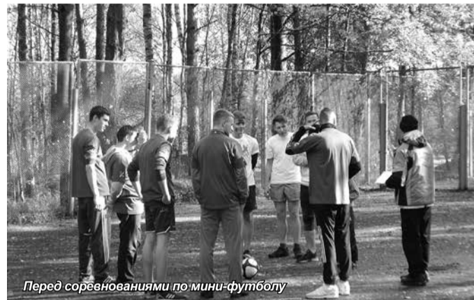
Перед соревнованиями по мини-футболу