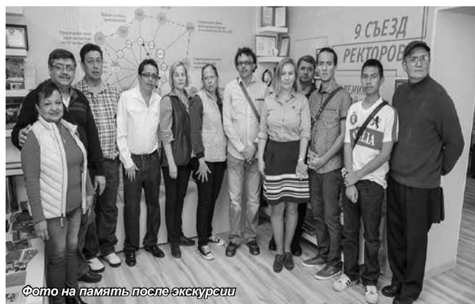
Фото на память после экскурсии