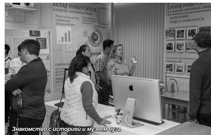
Знакомство с историей и музеем вуза