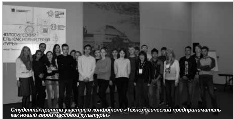
Студенты приняли участие в конференте «Технологический предприниматель как новый герой массовой культуры»

Делегация Университета приняла участие в работе двух престижных международных форумов