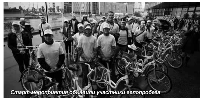
Старт мероприятия объявили участники велопробега