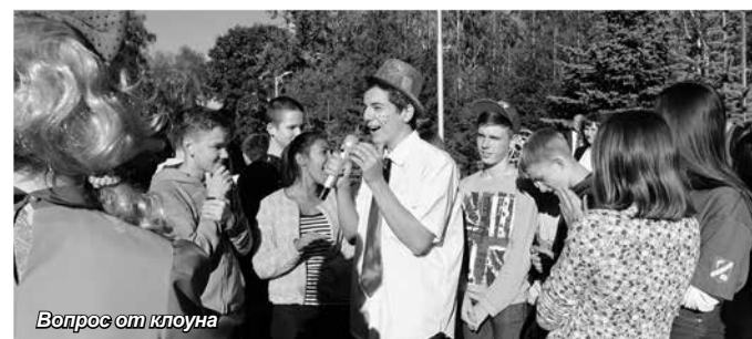
Вопрос от клоуна