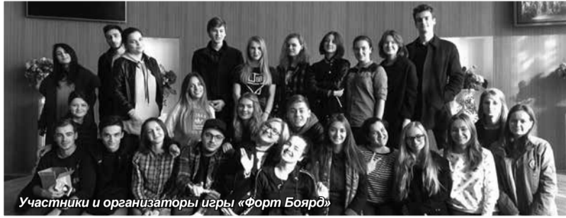
Участники и организаторы игры «Форт Боярд»

На первом этапе команды занимались поиском ключей, выполняя задания разного уровня сложности. Самыми запоминающимися испытаниями стали станции «Живой мертвец», «Царевна - Несмеяна» (по мнению студентов, эта станция была одной из самых тяжелых), «Гурман» и «Шесть ножек». На последних двух станциях особенно чувствовался дух оригинальной игры «Форт Боярд»,