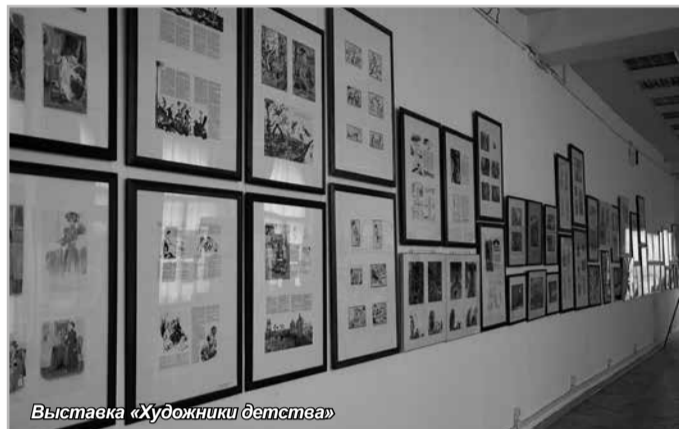
Выставка «Художники детства»

Выставка, посвященная 80-летию издательства, проходила до 16 октября в выставочном зале Санкт-Петербургского Союза художников, который находится на Большой Морской улице, дом 38. Посетили ее не только те, кто вырос на выпусках «Костра», но и те, кто не остаётся равнодушным к настоящему искусству иллюстрации, к рассказам и стихам, наполненным добротой, радостью и искренностью!