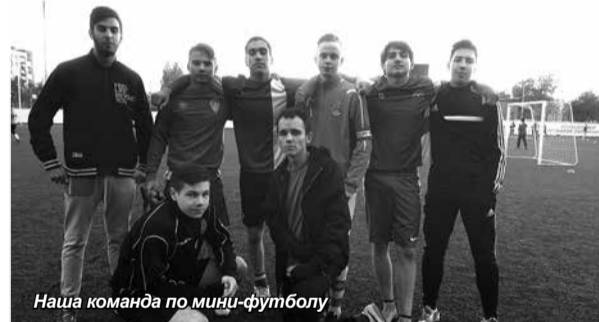
Наша команда по мини-футболу

Данное мероприятие было организовано при поддержке администрации Санкт-Петербургского государственного бюджетного учреждения «Центр физической культуры, спорта и здоровья «Царское Село» Пушкинского района. Идею проведения столь серьезного мероприятия поддержал спортивный клуб «Полиция без границ» (Interpol) и кори-