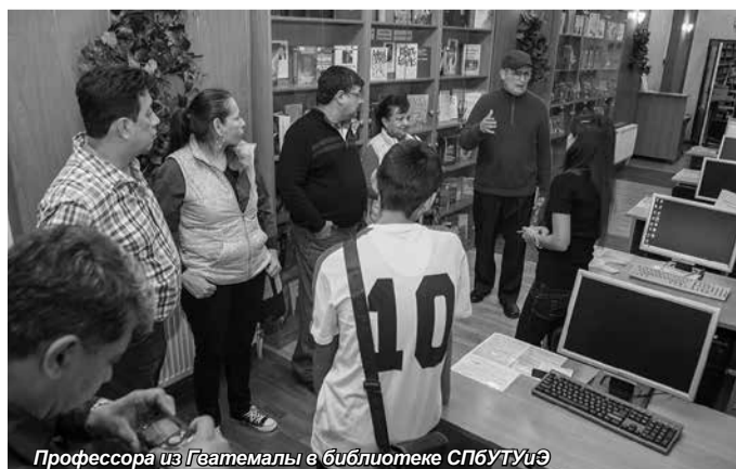
Профессора из Гватемалы в библиотеке СПБТУиЭ

что крайне интересно для СПБТУиЭ в плане академической мобильности студентов. Сотрудники международного отдела СПБТУиЭ выразили надежду на дальнейшее сотрудничество с высшими учебными заведениями Гватемалы по всем имеющимся в СПБТУиЭ направлениям и специализациям.