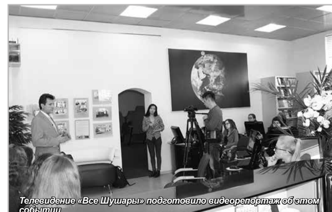
Телевидение «Все Шушары» подготовило видеорепортаж об этом событии