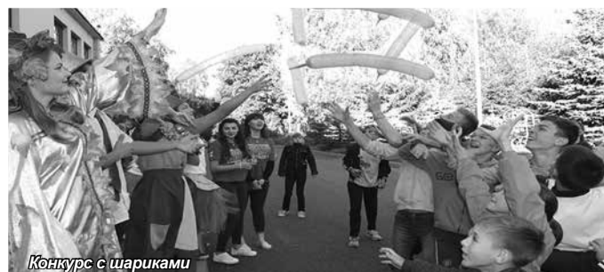
Конкурс с шариками