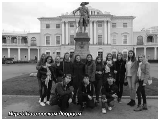
Перед Павловским дворцом