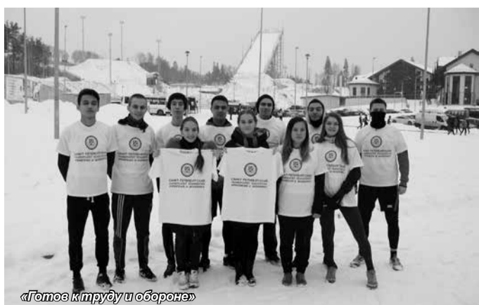
«Готов к труду и обороне»

Кафедра «Физическая культура» благодарит всех студентов, участвующих в гонке ГТО «Путь Единства» и поздравляет команду «Маккаби» с успешным завершением осеннего этапа, желает дальнейших успехов в учебе и спорте!