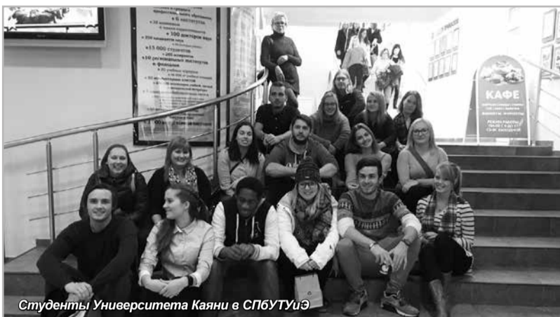
Студенты Университета Каяни в СПбУТУиЭ

Также в рамках изучения специфики работы предприятия на российском рынке иностранным студентам была организована экскурсия на пивоваренный завод «Балтика». Больше всего зарубежных