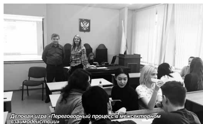
Деловая игра «Переговорный процесс в межсекторном взаимодействии»