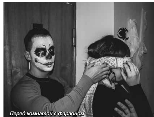
Перед комнатой с фараоном