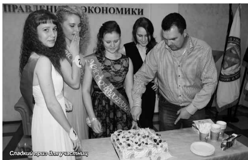
Сладкий прив для участниц

Этим замечательным конкурсом все присутствующие попрощались с золотой осенью 2016 года.