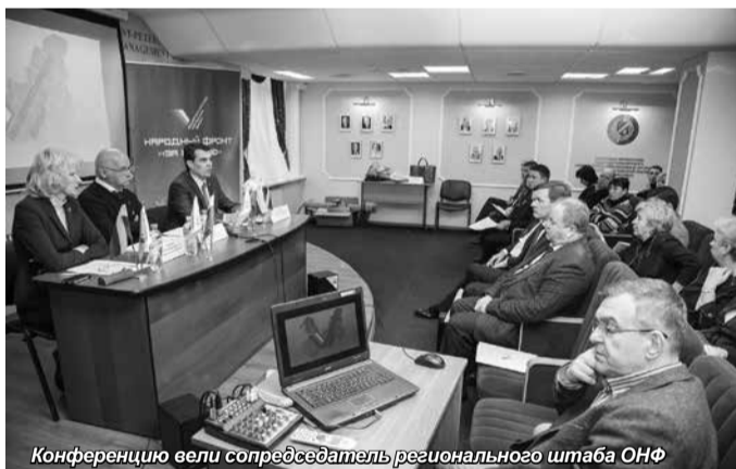
Конференцию вели сопредседатель регионального штаба ОНФ