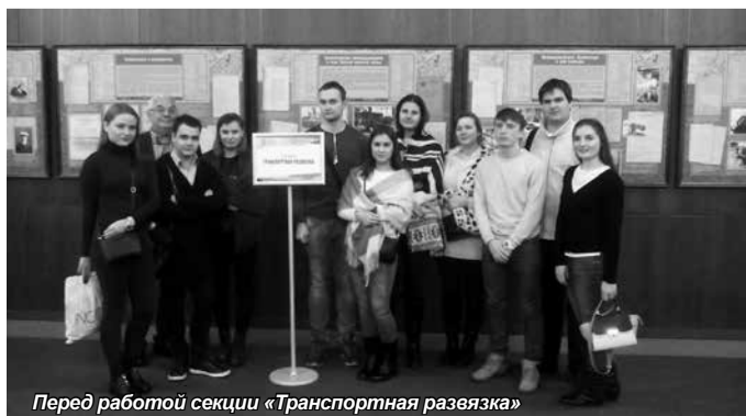
Перед работой секции «Транспортная развязка»

Студенты Санкт-Петербургского университета технологий управления и экономики приняли участие в работе двух секционных заседаний – «Промышленный Петербург» и «Транспортная развязка», заслушали интерактивные лекции и выступления представителей промышленных предприятий города, посетили мастер-классы, получили сертификаты участников молодежного форума.