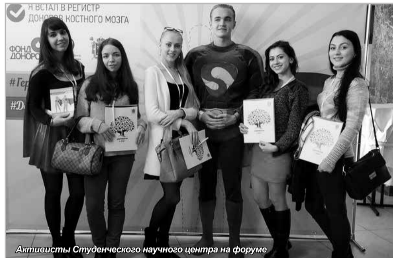
Активисты Студенческого научного центра на форуме

Каждый участник форума мог выбрать направление добровольческой деятельности, которое интересует именно его и узнать об этом много нового, посетить рабочие секции, обсудить все насущные и волнующие вопросы с компетентными людьми и обменяться контактами, именно