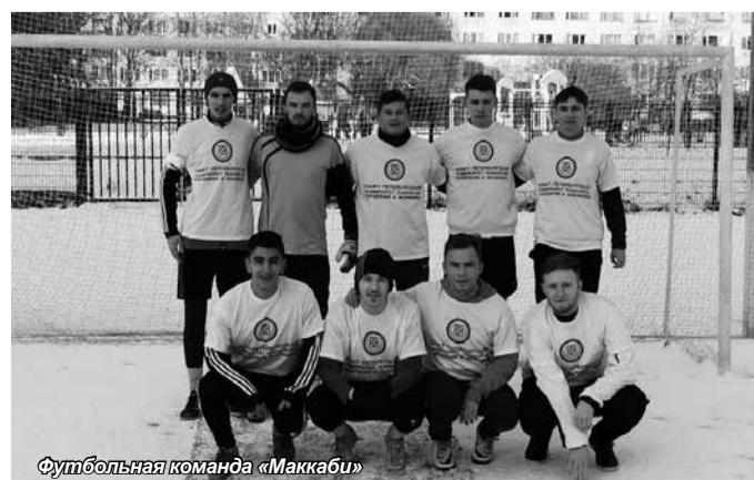
Футбольная команда «Маккаби»