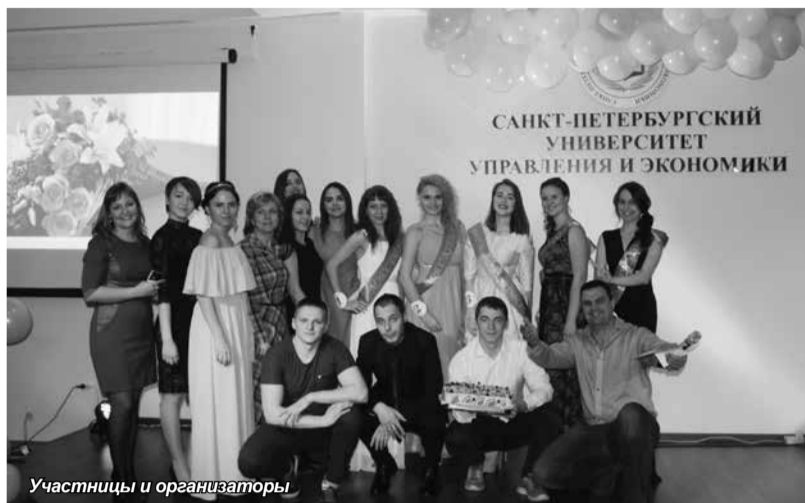
Участницы и организаторы