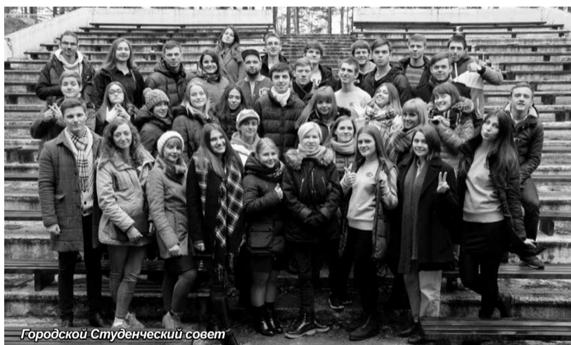
Городской Студенческий совет