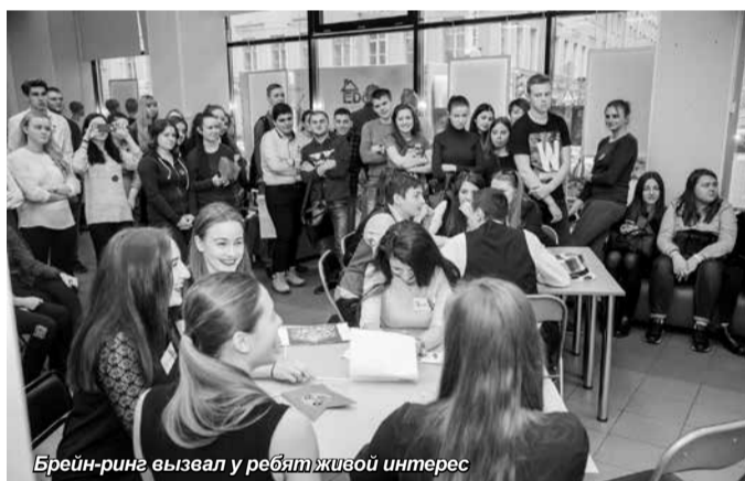
Брейн-ринг вызвал у ребят живой интерес