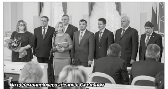
На церемонии награждения в Смольном

всегда быть на шаг впереди своих конкурентов. Ну и, конечно, залог успеха – это забота о потребителях», – подчеркнул Г.С. Полтавченко, поздравляя победителей.