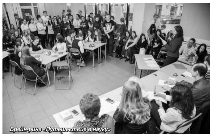
Брейн-ринг «Путешествие в науку»

Организаторы и члены жюри поддержали идею о необходимости дальнейшего проведения подобных мероприятий, в том числе и для школьников, превращая интеллектуальную игру в кузницу будущих абитуриентов Университета.