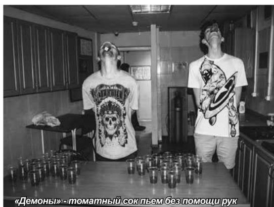
«Демоны» - томатный сок пьем без помощи рук