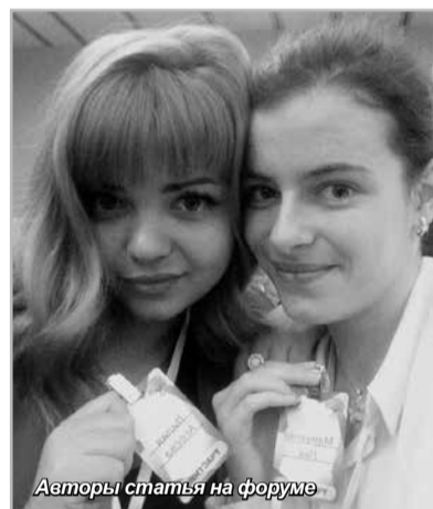
Авторы статьи на форуме

Совместно с Всероссийским форумом «Доброволец России – 2016» 24 октября в Санкт-Петербурге в пятый раз прошел региональный форум добровольцев «Доброфорум», который объединил на своей площадке более 400 волонтеров со всей России. Организатором мероприятия был Комитет по молодежной политике