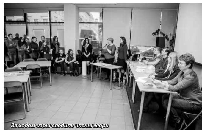
За ходом игры следили члены жюри