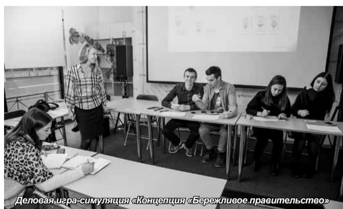
Деловая игра-симуляция «Концепция «Бережливое правительство»