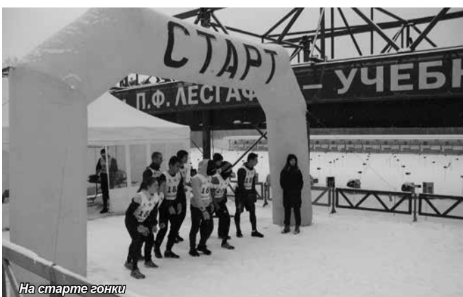
На старте гонки