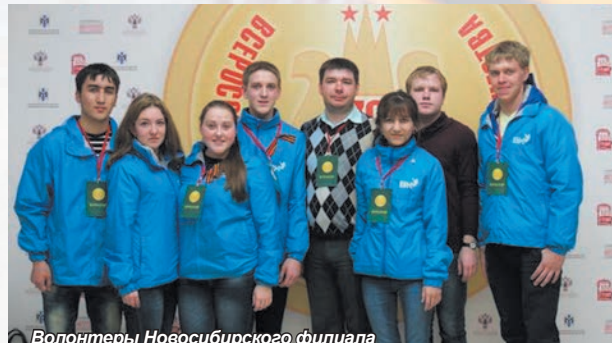
Волонтеры Новосибирского филиала

В Новосибирске в Государственном концертном зале им. А.М. Каца 9 апреля состоялось торжественное открытие межрегионального этапа Всероссийского фестиваля детского и юношеского творчества «Салют Победы», посвященного 70-летию Победы в Великой Отечественной войне. Более 500 человек стали его участниками, посетили мероприятия более трех тысяч зрителей. Солисты и исполнительские коллективы из ре-