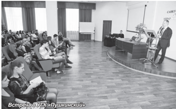
Встреча в УГК «Пушкинский»