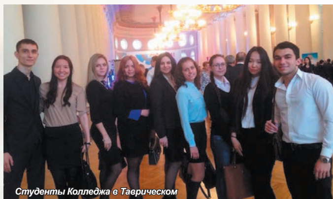
Студенты Колледжа в Таврическом