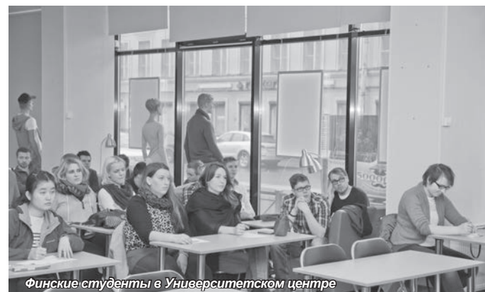
Финские студенты в Университетском центре

В последний день пребывания в Санкт-Петербурге наши гости совершили экскурсию в Царское Село, побывали в Екатерининском дворце и Лицее.