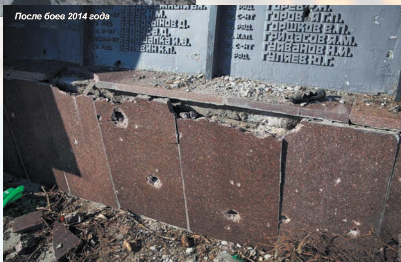
После боев 2014 года

Саур-Могиле – одна из самых удобных и высоких точек Донбасса, поэтому не удивительно, что на ней организовали огневую точку. Как известно, внутри обелиска, который находился на одноименном кургане высотой 278 м., располагалась небольшая музей, посвященный боям за Саур-Могилу в июле-августе 1943 года. В результате боевых действий 2014 года на кургане практи-