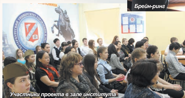
Участники проекта в зале института

Все участники получили сертификаты за участие в мероприятии, победителям за были вручены кубки и почетные грамоты. За подготовку школьников к мероприятию Благодарственными письмами ректора СПБАУиЭ были награждены директор школы, а Благодарственными письмами директора Якутского института экономики – учителя истории, литературы, информатики.