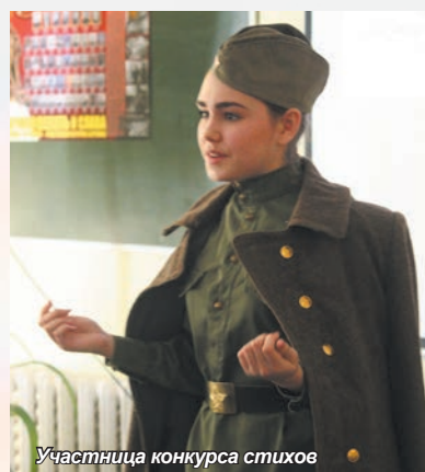
Участница конкурса стихов

В брейн-ринге «За Великую Победу – славились отцы и деды!» приняли участие команды школьников 9-11 классов школ № 6, №9, №29 и № 31 города Якутска. Ведущей брейн-ринга стала специалист ВПО Е.С. Мельникова. Конкурс состоял из нескольких туров: «Угадай-ка», «Знайки истории», «Мы эрудиты в истории Великой Отечественной войны», «Погоня за лидером». Председатель жюри – кандидат исторических наук, старший сотрудник Института гуманитарных исследований и проблем малочисленных народов Севера Сибирского отделения Российской академии наук, заведующая кафедрой Якутской Духовной семинарии, преподаватель истории