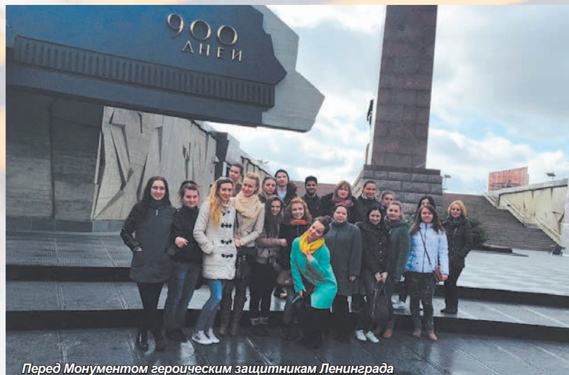
Перед Монументом героическим защитникам Ленинграда