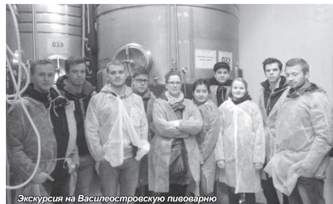
Экскурсия на Василеостровскую пивоварню