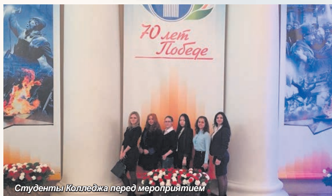
Студенты Колледжа перед мероприятием

войне, выпала и студентам Колледжа СПбАУУиЭ. «В свете последних политических событий очень важно поднимать патриотизм у молодежи и важно знать историю нашей страны. Сегодня мы послушали выступление ветеранов Великой Отечественной войны и стали свидетелями награждения их медалями. Они воевали не за себя! Они воевали за Родину, за будущие поколения! Чтобы мы могли вздохнуть спокойно и не испытывать тот жестокий гнет, что испытали ветераны, боролись за мирное небо над головой, за будущее! Ценной своей жизни они добыли нам победу, и многие не дожили до нее. Мы гордимся ими и гордимся нашей страной!» – высказали свое мнение наши студенты.