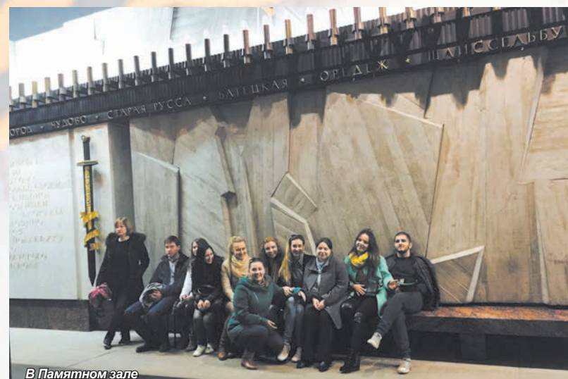
В Памятном зале

Монумент героическим защитникам Ленинграда на площади Победы в Санкт-Петербурге – это то место, где, как мне кажется, должен побывать каждый, чтобы освежить в памяти историю блокадного Ленинграда. Совершенно поражающие своей текстурой стены, комплекс оней, черная плитка и высоченная стена делают своё дело, приходи сюда, ты просто теряешь дар речи.