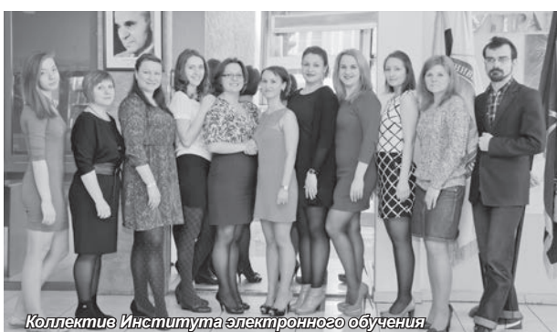
Коллектив Института электронного обучения

стимулы для успешного карьерного роста. Несмотря на кризисные явления в экономической ситуации, Институт приложил максимум усилий, чтобы достичь новых вершин в 2015 году. На качественно новый уровень вышли программы повышения квалификации, которые стали разнообразнее в сфере прикладных образовательных технологий и включили в себя профильные занятия по различным направлениям.