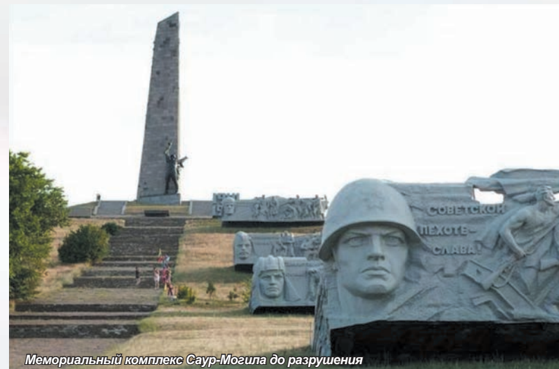
Мемориальный комплекс Саур-Могиле до разрушения

Во времена Великой Отечественной войны на протяжении двух лет территорию вокруг кургана держали в оккупации немцы. Именно здесь с 1941 по 1943 год строились оборонительные сооружения первой линии Миус-фронта. Сама Саур-Могиле для немцев имела очень важное стратегическое значение. На ее вершине был оборудован наблюдательный пункт. На склонах кургана немецкие солдаты обустроили блиндажи, дзоты, накаты, вырыли бронеколпаки с огневыми средствами. Для обороны высоты использовались минометы, огнемётные танки, артиллерийские орудия. Советские войска столкнулись с трудностью – наступать нужно было с крутого склона, в то время как немцы