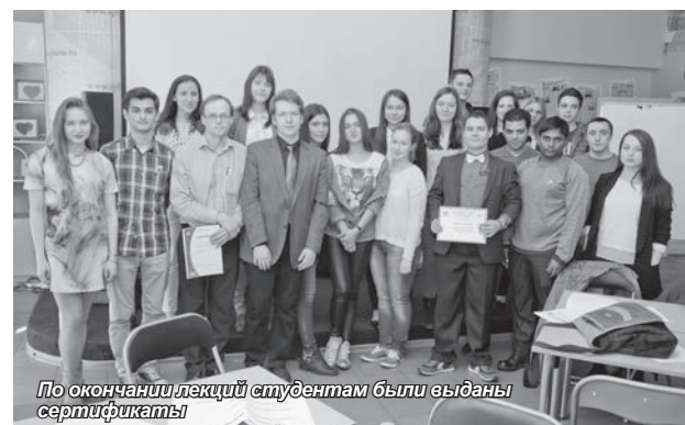
По окончании лекций студентам были выданы сертификаты

быть в роли мерчендайзера и провести анализ товаров и продуктов в известных супермаркетах города. Вместе с финским преподавателем обсуждались результаты их анализа.