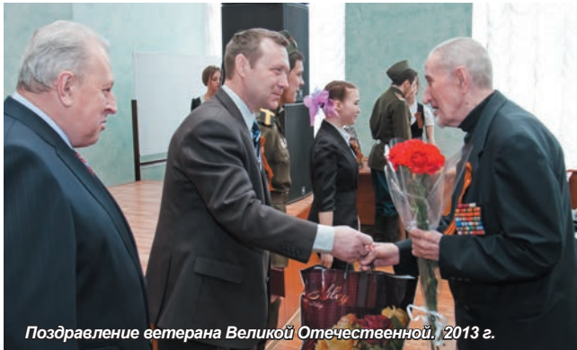
Поздравление ветерана Великой Отечественной, 2013 г.