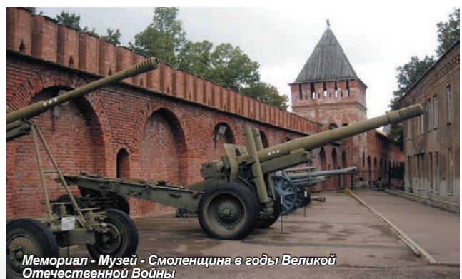
Мемориал - Музей - Смоленщина в годы Великой Отечественной Войны