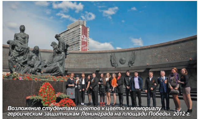
Возложение студентами цветов к цветам к мемориалу героическим защитникам Ленинграда на площади Победы, 2012 г.

На протяжении десятилетий День Победы остается самым главным, самым душевным и трогательным праздником страны. Никакие другие праздники не смогут сравниться с ним. Ветеран в орденах, ведущий за руку внука, – символ силы Отечества, прочной связи поколений. Именно 9 мая мы как-то особенно сильно чувствуем гордость за свою страну. Преподаватели, сотрудники, студенты и аспиранты Санкт-Петербургского университета управления и экономики, его региональных институтов и филиалов вместе со всеми россиянами готовятся отпраздновать годовщину Великой Победы. В эти весенние дни традиционно пройдут торжественные собрания, чествования ветеранов, военно-патриотические вечера, концерты.