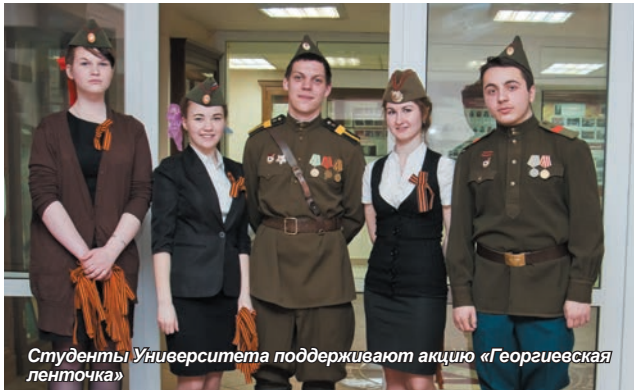
Студенты Университета поддерживают акцию «Георгиевская ленточка»