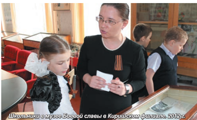
Школьники в музее Боевой славы в Киришском филиале, 2012 г.