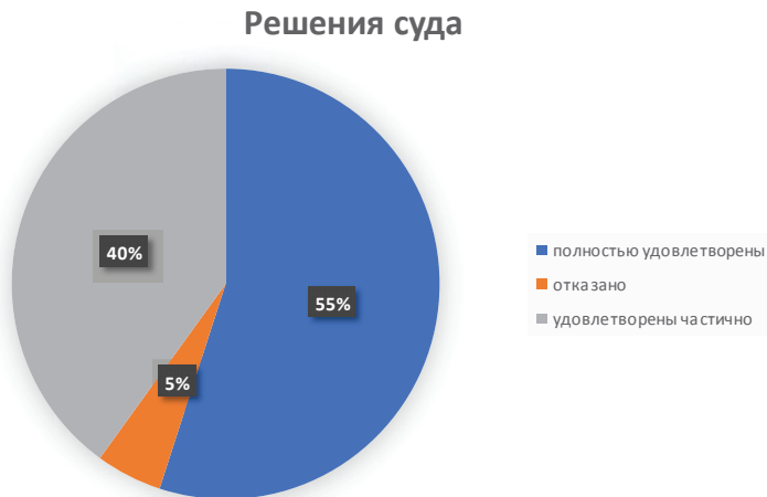
Рис. 1. Решения по делам долевого участия

дольщика неустойку, я выявил, что 55% требований по оплате сумм долга и неустойки были полностью удовлетворены, 45% удовлетворены частично и в 5% было отказано полностью (рис. 1).