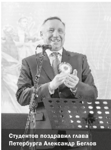
Студентов поздравил глава Петербурга Александр Беглов

В этом году на балу присутствовали семьсот лучших студентов, имеющих