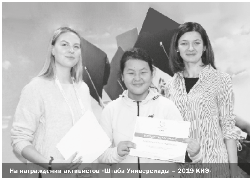
На награждении активистов «Штаба Универсиады – 2019 КИЭ»