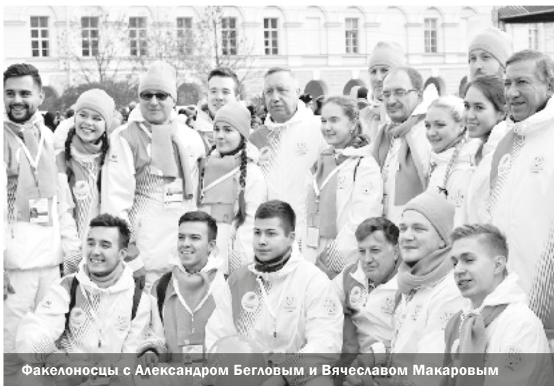
Факелоносцы с Александром Бегловым и Вячеславом Макаровым

Вопросы подготовки к XXIX Всемирной зимней универсиаде 2019 года и региональной Программы развития студенческого спорта в Красноярском крае на период до 2025 года также рассматривались 21 декабря 2018 года на совместном заседании Общественной