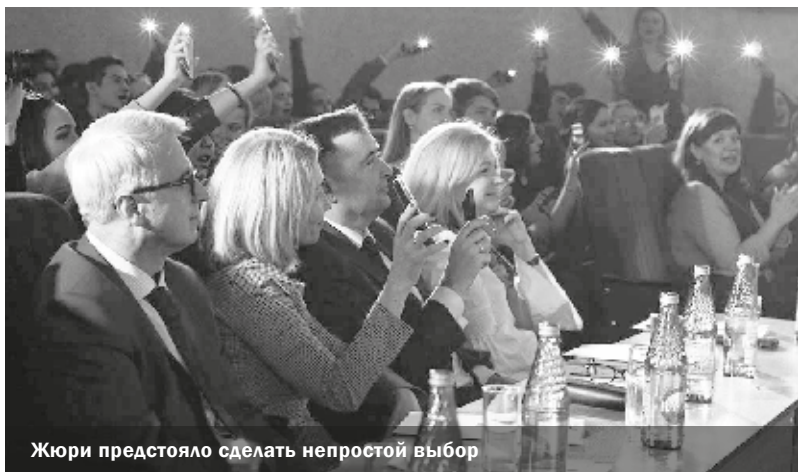
Жюри предстояло сделать непростой выбор

Состоялся заключительный этап конкурса «Мисс и Мистер Университет – 2018»