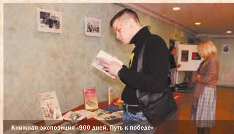
Книжная экспозиция «900 дней. Путь к победе»

75 лет прошло, но о блокаде еще не рассказано все до конца. О некоторых событиях того времени мы узнали из рассказа за студентов университета, которые постарались найти малоизвестные факты. Кроме того, в актовом зале университета была открыта выставка фотографий «Блокада Ленинграда 1941-1944» и книжная экспозиция «900 дней. Путь к победе».