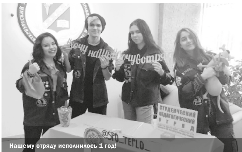
Нашему отряду исполнилось 1 год!

Как стать вожатым и получить от этого много положительных эмоций, обучают в Школе вожатского мастерства студенческого педагогического отряда «Тепло»