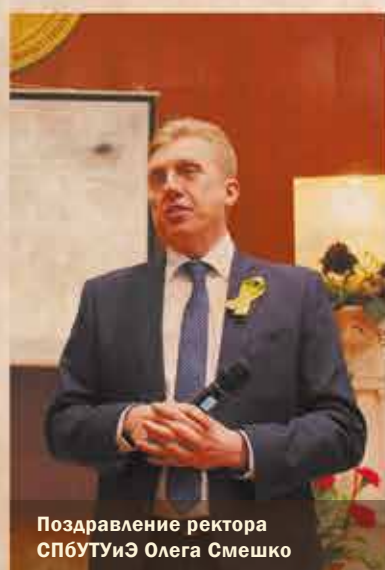
Поздравление ректора СПБУТУиЭ Олега Смешко