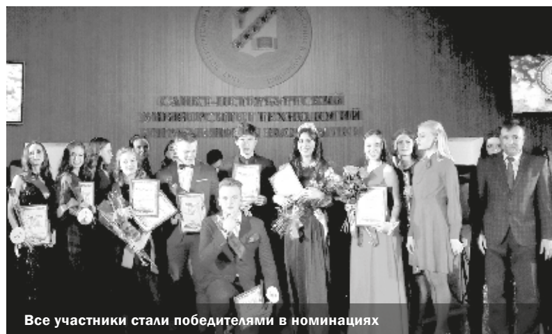
Все участники стали победителями в номинациях