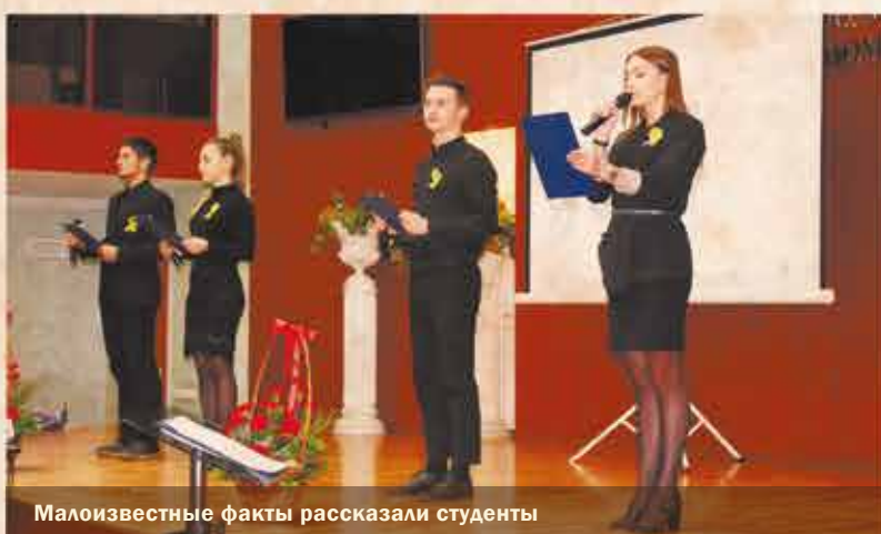
Малоизвестные факты рассказали студенты

Торжественно-траурная церемония возложения венков и цветов, приуроченная к 75-й годовщине полного освобождения Ленинграда от фашистской блокады, состоялась 26 января на Пискаревском мемориальном кладбище. Вместе с ветеранами Великой Отечественной войны, блокадниками, жителями и гостями города память о жертвах блокады почтили студенты Колледжа СПБУТУиЭ. Студенты университета, проживающие в УГК «Пушкинский» вместе с ветеранами Великой Отечественной войны, школьниками школ №459, №93 и жителями поселка Шушары 25 января 2019 года приняли участие в торжественном митинге и возложили цветы к памятному знаку «Защитникам Родины стоявшим на Шушарской земле».