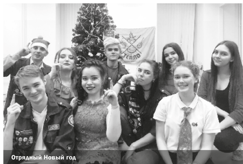
Отрядный Новый год

День рождения отряда бойцы отметили 30 ноября. Нашему отряду исполнился год! Нас поздравили представители студенческих отрядов Санкт-Петербурга, кандидаты, люди, которые как-либо связаны с отрядом. В тот день бойцы нашего отряда услышали много приятных слов от гостей. На празднике были игры,