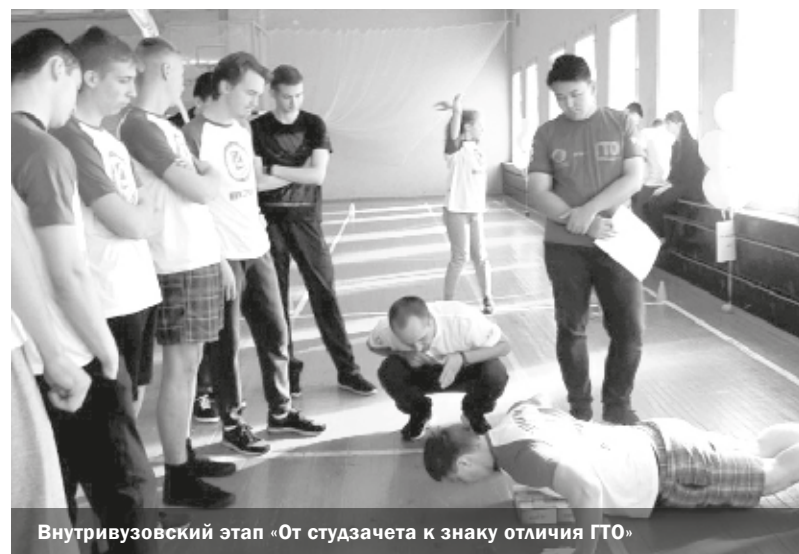
Внутривузовский этап «От студзачета к знаку отличия ГТО»

«Огонь Зимней универсиады – 2019 прибыл к нам из Грозного, а мы передадим эстафету Архангельску, – рассказал Александр Беглов. – Завершит огонь свой путь в Красноярске, где впервые пройдут Студенческие игры. На последних двух Универсиадах представители нашего города завоевали 4 золотые, 4 серебряные и 4 бронзовые медали. Я хотел бы пожелать, чтобы на Зимней универсиаде 2019 года в Красноярске наши