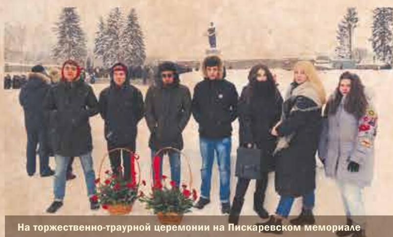
На торжественно-траурной церемонии на Пискаревском мемориале

В нашем университете прошел целый ряд мероприятий, посвященных 76-й годовщине прорыва блокады Ленинграда и 75-й годовщине полного освобождения города от фашистской блокады в годы Великой Отечественной войны.