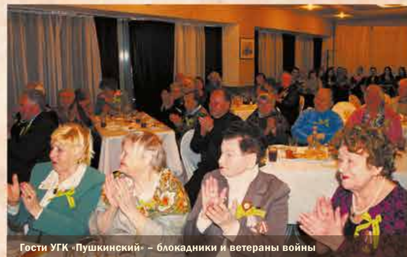
Гости УГК «Пушкинский» – блокадники и ветераны войны

музыкальный номер был наполнен добротой, искренностью, любовью и огромной благодарностью в адрес всех ветеранов и блокадников. Гости с удовольствием подпевали, слыша любимые песни – «Девочка из фильма», «Непокоренный Ленинград», «Катюша», «Эх, дороги», «Алёша», «Я люблю тебя, жизнь». А когда зазвучал гимн блокады – «Песня о Ладоге», ветераны и жители блокадного города дружно встали. Для них слова «недаром Ладога родная Дорогой жизни названа» будут дороги всегда.