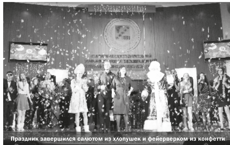
Праздник завершился салютом из хлопушек и фейерверком из конфетти

Деда Мороза в наш университет ноги привели, а вот Снегурочку он где-то по пути потерял. Зато на огонек зашел романтик Трубадур и попросил он дедушку исполнить его самое заветное желание – встретить свою любовь. Хитрый Дед Мороз согласился, а сам решил проверить Трубадура и отправил его в снежный лес. Много разных встреч было на пути, много красавиц в нашем университете.