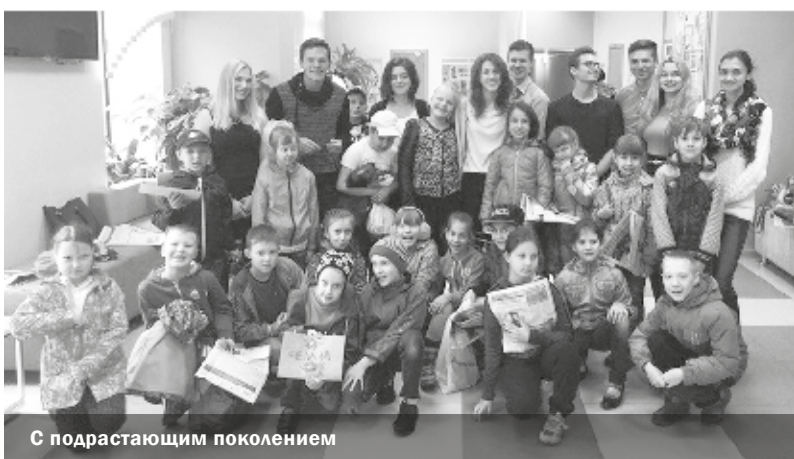
С подрастающим поколением

Молодежный совет МО «Дачное» – это не просто группа ребят, которые активно взаимодействуют с муниципальными депутатами и жителями района, это одна