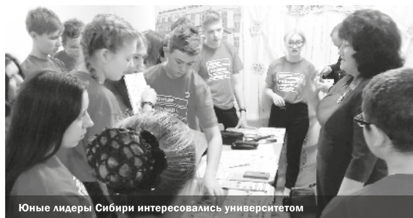
Юные лидеры Сибири интересовались университетом