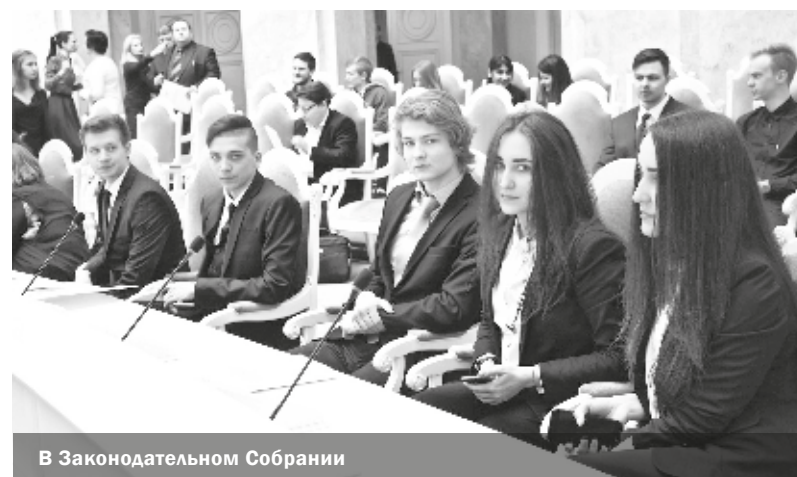
В Законодательном Собрании

новое поколение, и именно мы должны показывать пример нашим маленьким жителям района.