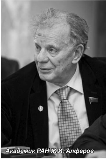
Академик РАН Ж.И. Алферов

16 февраля в Санкт-Петербургском научном центре РАН состоялось заседание Межведомственного Северо-Западного координационного совета при Российской академии наук по фундаментальным и прикладным исследованиям.