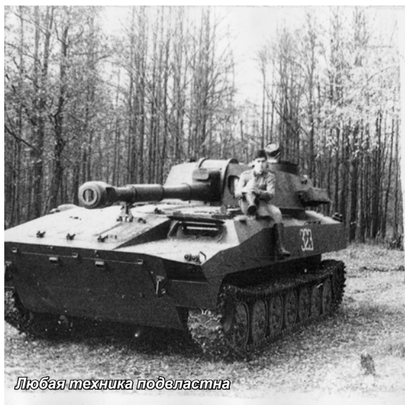
Любая техника подвластна

Хоть профотбор и психологическое сопровождение учебного процесса и занимали ведущее место