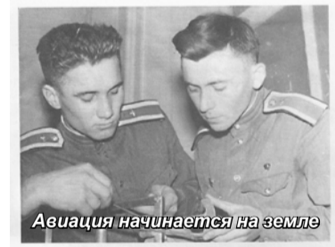
Авиация начинается на земле

В 1969 году я связал свою судьбу с юриспруденцией. В 1973 году окончил военно-юридический факультет Военно-политической академии им. В.И. Ленина. После этого многие годы работал на кафедре международного