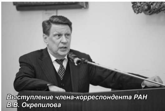
Выступление члена-корреспондента РАН В.В. Окрепилова

Ключевой темой заседания стало обсуждение проекта Комплексной научно-технической программы Северо-Западного федерального округа РФ до 2030 г. (КНТП СЗФО),