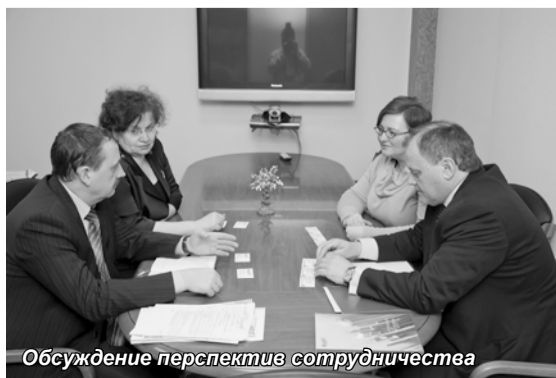
Обсуждение перспектив сотрудничества