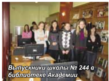
Выпускники школы № 244 в библиотеке Академии

Учебный год подходит к концу. Те школьники, которые еще не покидают стены своего учебного заведения, радуются предстоящим весенним и летним каникулам. А вот для выпускников наступает самая «горячая» пора – пора экзаменов и выбора дальнейшего жизненного пути. Куда пойти учиться? Какие предметы выбрать для сдачи экзаменов? Пока не все выпускники определились с ответами на эти жизненно важные вопросы. Помочь им в этом призвана и та профориентационная работа, которая ведется в Санкт-Петербургской академии управления и экономики.