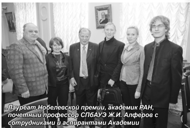
Лауреат Нобелевской премии, академик РАН, почетный профессор СПбАУЭ Ж.И. Алферов с сотрудниками и аспирантами Академии

левской премии, председатель СПб НЦ РАН, академик РАН, почетный профессор СПбАУЭ Ж.И. Алферов. В своем выступлении Жорес Иванович подчеркнул большое значение данного издания, так как лекции по своей сути представляют анализ проблем и опыт экономического развития.