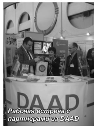
Рабочая встреча с партнерами из DAAD

В университетах уже открываются новые специальности и факультеты, разрабатываются программы по обмену студентами и обучения в странах ближнего и дальнего зарубе-