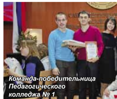
Команда-победительница Педагогического колледжа № 1

За право считаться лучшими боролись команды из Петровского колледжа, Педагогического колледжа № 8, Выборгского педагогического колледжа, Санкт-Петербургского технического колледжа, сборная команда СПбГАУЭ и два состава команды из