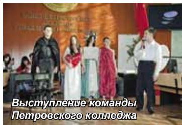
Выступление команды Петровского колледжа

принято решение присудить первое место команде из Педагогического колледжа № 1 им. Н.А. Некрасова (первый состав). Однако и проигравших не было, все команды стали победителями в различных номинациях: «Самая дружная», «Самая эрудированная», «Самая находчивая», «Самая музыкальная», «Самая креативная» команда.