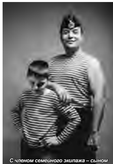
С членом семейного экипажа – сыном