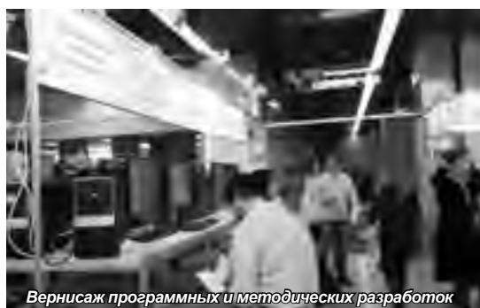
Вернисаж программных и методических разработок

В рамках конференции прошли пленарные и секционные заседания, мастер-классы по использованию программных продуктов фирмы «1С», вернисаж программных и методических разработок, отбор в программу У.М.Н.И.К. Фонда содействия развитию малых предприятий. Также участники смогли неформально пообщаться с коллегами, представителями фирмы «1С» и её партнёрами.