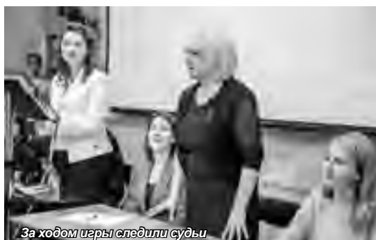
За ходом игры следили судьи