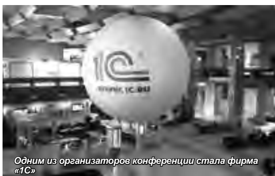
Одним из организаторов конференции стала фирма «1С»