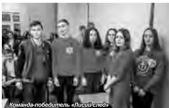
Команда-победитель «Лисий след»