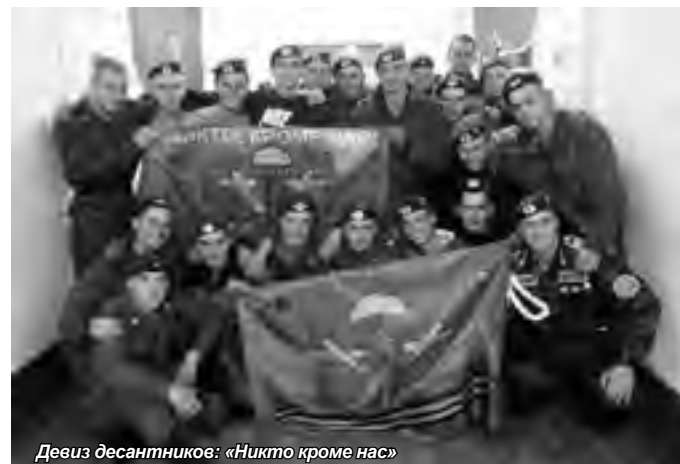
Девиз десантников: «Никто кроме нас»