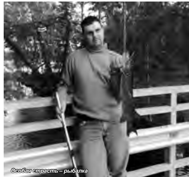
Особая страсть – рыбалка

Потом была интереснейшая стажировка в Европе, когда удалось познакомиться с рабо-