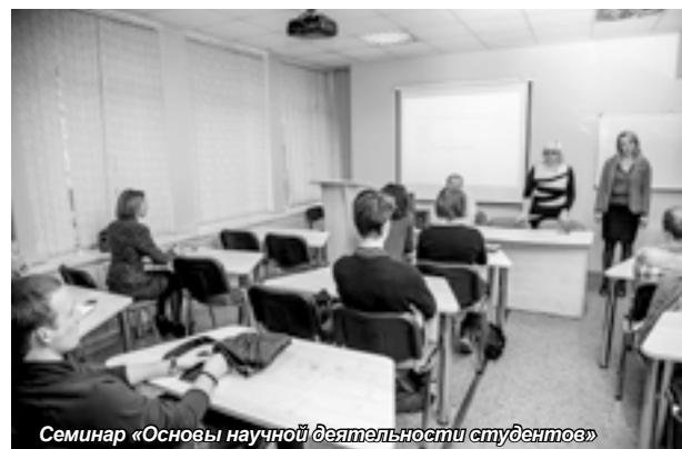
Семинар «Основы научной деятельности студентов»

описание требований, предъявляемых к их оформлению. Закрепление этих знаний направлено на повышение качества подготовки дипломных работ студентами и их заинтересованности в дальнейшем продвижении по научному пути.