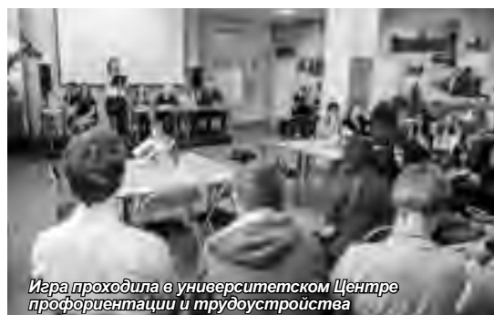
Игра проходила в университетском Центре профориентации и трудоустройства

Организаторы и члены жюри поддержали идею о необходимости дальнейшего проведения подобных мероприятий, ведь брейн-ринг вполне может стать кузницей будущих абитуриентов Университета.