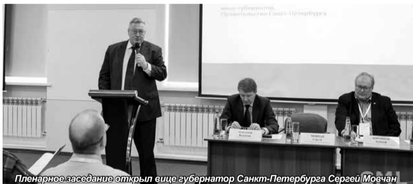
Пленарное заседание открыл вице-губернатор Санкт-Петербурга Сергей Мовчан

После пленарного заседания работа продолжилась по секциям: «Цифровое производство», «Развитие информационных технологий, радиоэлектроники, приборостроения, средств связи и инфотелекоммуникаций», «IT в единой энергетической системе России», «Информационная безопасность», «Импортозамещение IT».