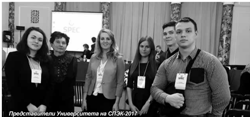
Представители Университета на СПЭК-2017

ученые научно-исследовательских институтов РАН, ведущих университетов и других научно-образовательных центров