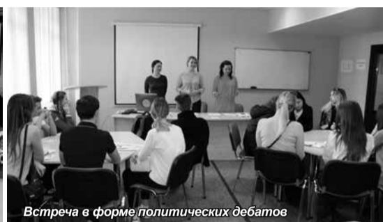
Встреча в форме политических дебатов