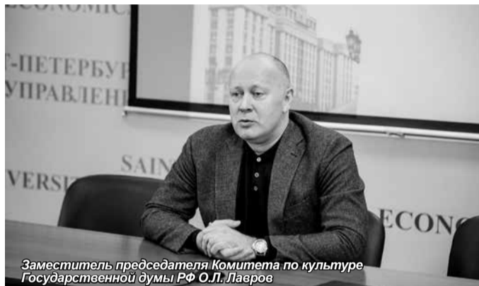
Заместитель председателя Комитета по культуре Государственной думы РФ О.Л. Лавров