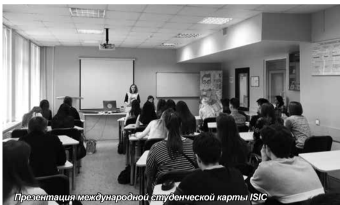
Презентация международной студенческой карты ISIC