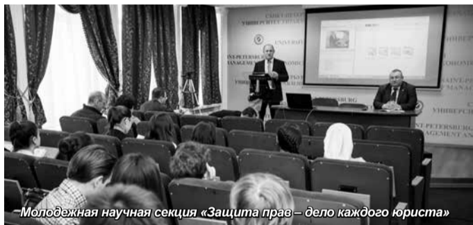
Молодежная научная секция «Защита прав – дело каждого юриста»

Подводя итоги конференции, ее участники внесли предложение о создании научно-исследовательского межвузовского центра для исследований проблем в сфере правозащитной деятельности. Также достигнута договоренность о проведении практических занятий для студентов с участием представителей Следственного управления Следственного комитета Российской Федерации по Ленинградской области, Международного Торгово-Хозяйственного Арбитража, отдела УФМС по Санкт-Петербургу и Ленинградской области.