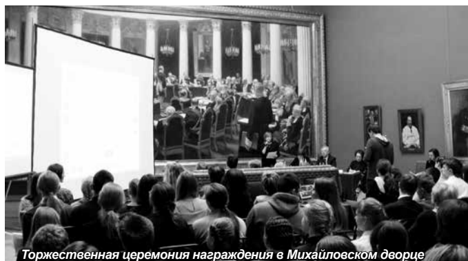
Торжественная церемония награждения в Михайловском дворце