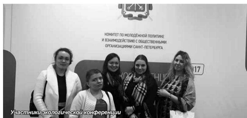
Участники экологической конференции

Во время работы на площадке участники обсудили вопросы борьбы с избытком мусора, промышленных отходов и приняли участие в деловых играх с известными петербургскими экспертами.