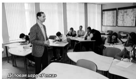
Деловая игра «Репка»

По сложившейся доброй традиции гостей сопровождали студенты-волонтеры института.