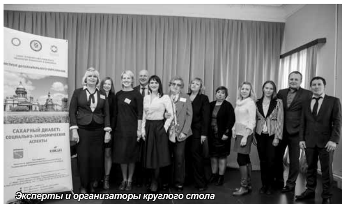
Эксперты и организаторы круглого стола