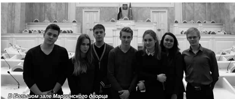
В Большом зале Мариинского дворца

Также студентам удалось посетить Большой зал, на месте которого первоначально располагался зимний сад, а сейчас проходят заседания, пройтись по коридо-