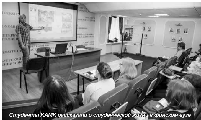
Студенты КАМК рассказали о студенческой жизни в финском вузе