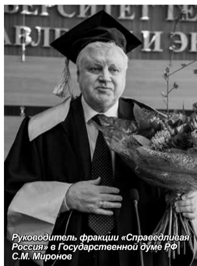
Руководитель фракции «Справедливая Россия» в Государственной думе РФ С.М. Миронов

Решением Ученого совета Санкт-Петербургского университета технологий управления и экономики депутат Государственной думы Федерального Собрания РФ VII созыва, председатель политической партии, руководитель фракции «Справедливая Россия» Сергей Михайлович Миронов избран почетным профессором Университета.