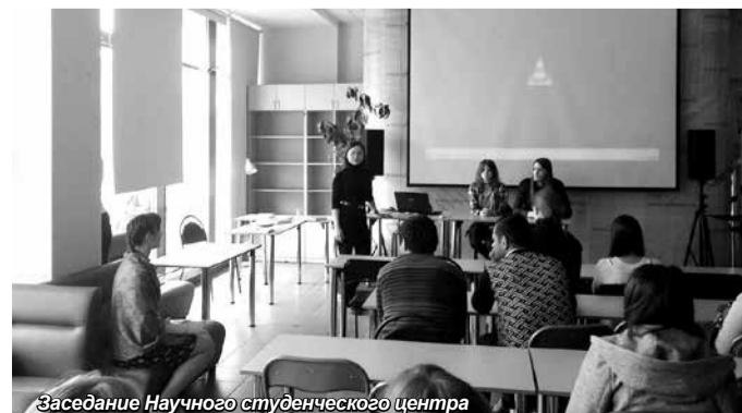
Заседание Научного студенческого центра