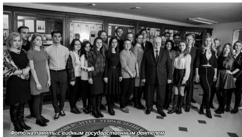
Фото на память с видным государственным деятелем

Конечно, аудитория поинтересовалась отношением политика к прошедшим в конце марта антикоррупционным митингам. С.М. Миронов считает, что это «тревожный звонок для тех, кто сегодня у власти». Власть должна понимать, почему люди выходят на протестные митинги, а главное – ответить гражданам на их вопросы, быть более открытой. Политик также заявил, что организаторы антикоррупционных митингов преследовали свои узкополитические цели, пытаясь ре-