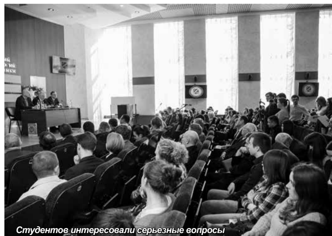
Студентов интересовали серьезные вопросы