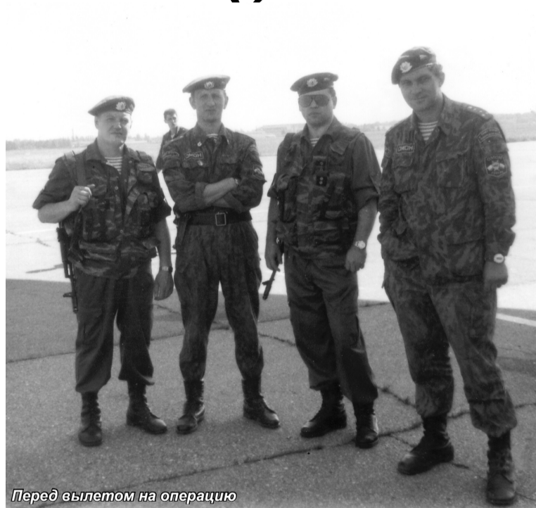
Перед вылетом на операцию