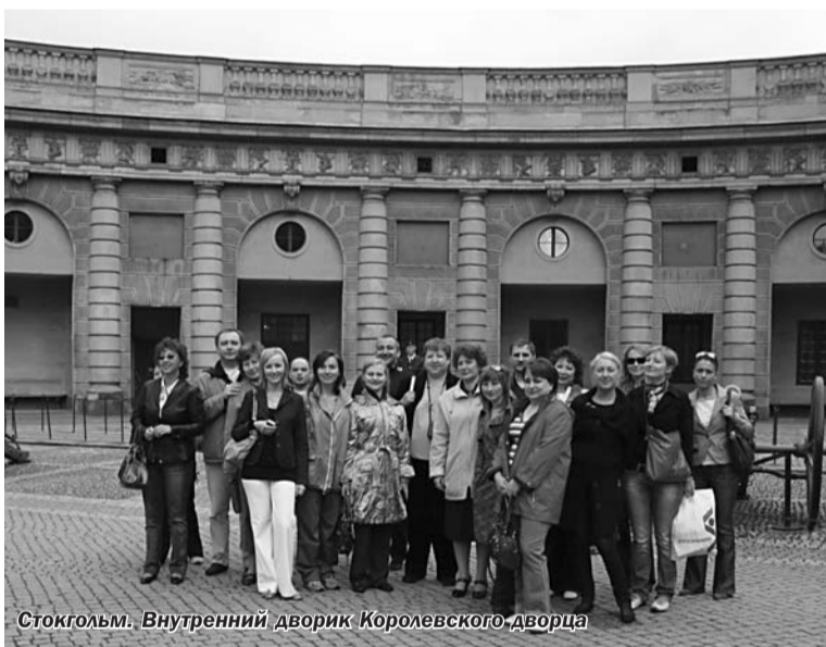
Стокгольм, Внутренний дворик Королевского дворца