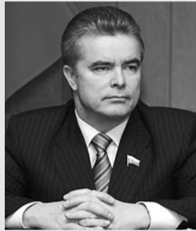
Депутат Государственной думы РФ, член комитета по