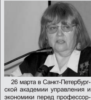
26 марта в Санкт-Петербургской академии управления и экономики перед профессорско-преподавательским составом и студентами выступила

заместитель председателя Комитета Государственной думы РФ по обороне С.Е. Савицкая.