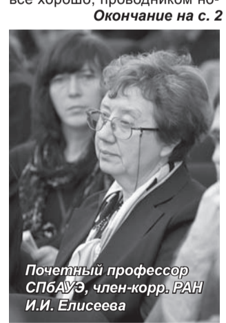
Почетный профессор СПбАУЭ, член-корр. РАН И.И. Елисеева

«Питер всегда был, как в сложные времена, так и во времена, когда казалось, что все хорошо, проводником на с. 2