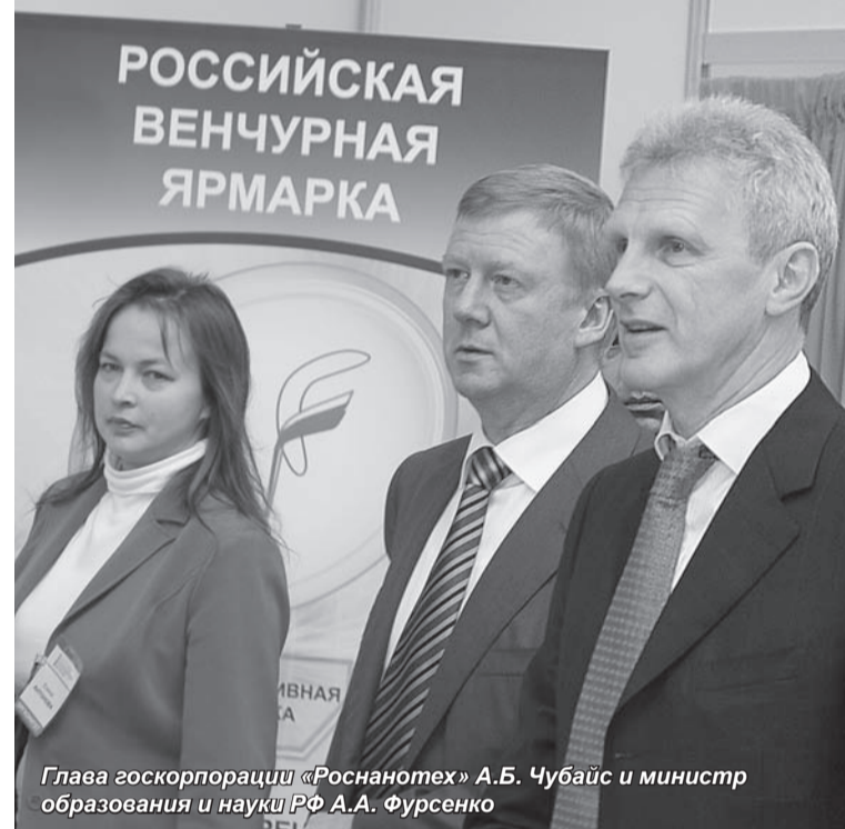
Глава госкорпорации «Роснано» А.Б. Чубайс и министр образования и науки РФ А.А. Фурсенко