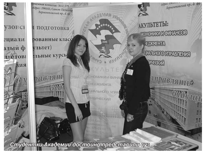
Студентки Академии достойно представили вуз