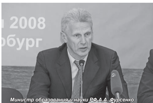
Министр образования и науки РФ А.А. Фурсенко

В Санкт-Петербурге 8-10 октября впервые состоялся Петербургский Международный инновационный форум, цель которого - способствовать формированию стратегии инновационного развития России.