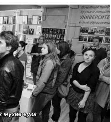
Гости из Чехии в музее вуза

Чешские студенты особое внимание уделили вопросам реализации краткосрочных программ изучения русско-