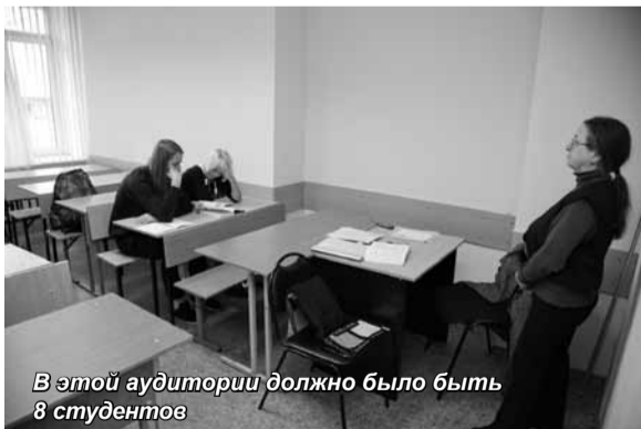
В этой аудитории должно было быть 8 студентов

В Санкт-Петербургском университете управления и экономики проведены проверочные рейды с целью определить, какова посещаемость лекций студентами.