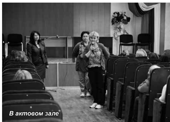
В актовом зале