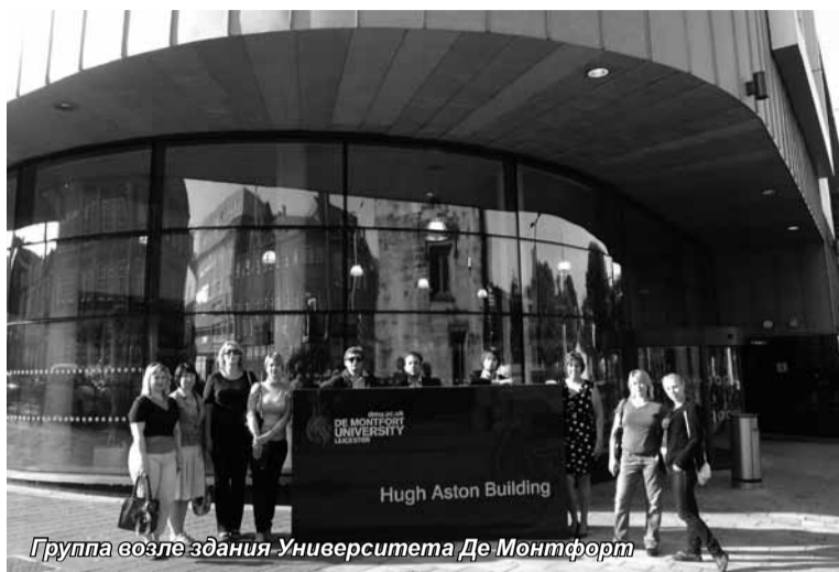
Группа возле здания Университета Де-Монтфорт

Слушатели программы MBA «Стратегическое управление предприятием» со 2 по 10 сентября проходили стажировку «Международный бизнес», организованную на базе Лестерской школы бизнеса и права Университета Де-Монтфорт в Великобритании.