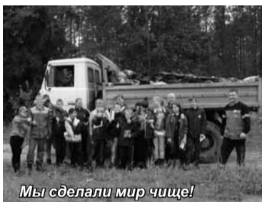
Мы сделали мир чище!

В 2012 году прошла всемирная акция «Сделаем!». Ее организаторы решили объединить всех людей на планете с благородной целью – очистить все страны от мусора. Россияне активно поддержали эту акцию, и 15 сентября в 83 регионах, 22087 муниципальных образованиях России она прошла как «Всемирный день уборки», цель которого – сделать мир чище.