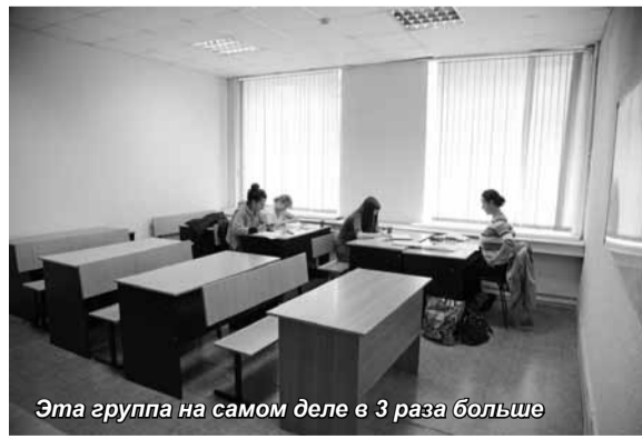
Эта группа на самом деле в 3 раза больше

личность преподавателей и сотрудников Университета». Прогуливая занятия, вы ставите под удар своих преподавателей – из-за вас они могут быть сокращены. Это не смотря на то, что нагрузка на преподавателя одинакова и тогда, когда в аудитории 2 человека, и когда 20 – объем преподаваемого материала от этого не меняется.