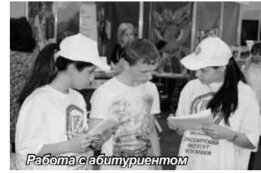
Работа с абитуриентом