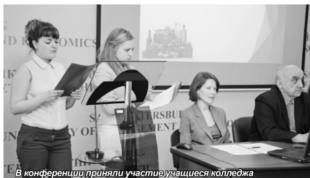
В конференции приняли участие учащиеся колледжа

В начале 90-х годов XX века произошел распад советского научно-технического комплекса, сопровождавшийся деградацией многих отраслей промышленности. В процессе реформирования российской экономики очень скоро стало понятно, что конкуренция в рыночном хозяйстве не способна решить все возникающие проблемы.