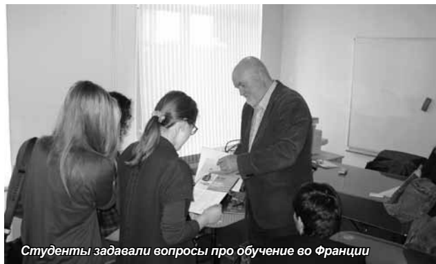
Студенты задавали вопросы про обучение во Франции

по словам г-на Робертса, во многих европейских странах. Направляя развитие своей предпринимательской деятельности по определенному отработанному пути, они не видят всей ширины возможностей, которые могли бы им открыться, пойдя они в своем развитии по нестандартному пути.