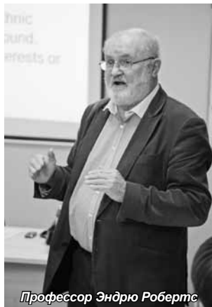
Профессор Эндрю Робертс

Однако большинство французских бизнесменов не хотят расширять свой бизнес, они стараются сохранить его небольшие масштабы, так