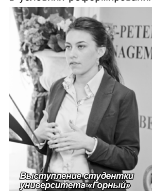
Выступление студентки университета «Горный»

Тематика круглых столов была обширна: «Управление инновационным развитием предпринимательских структур в условиях реформирования