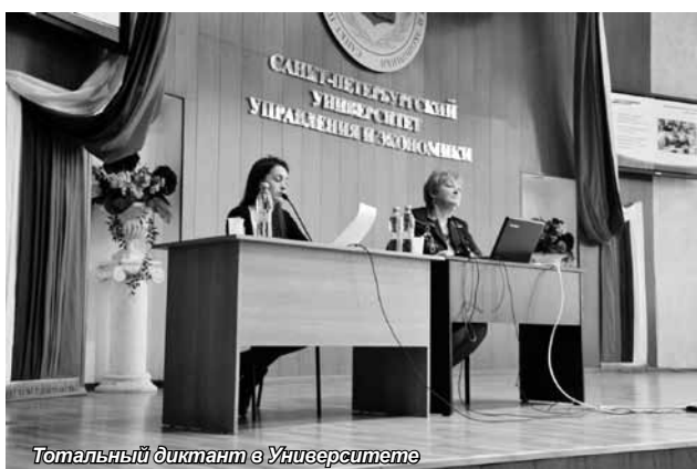
Тотальный диктант в Университете

В Санкт-Петербурге акция прошла на 8 площадках, всего в ней приняли участие 1800 человек, из них более 200 писали диктант в Санкт-Петербургском университете управления и экономики.