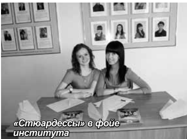
«Стюардессы» в фойе института

В Алтайском институте экономики прошел День открытых дверей под девизом «Готовимся к взлёту!»