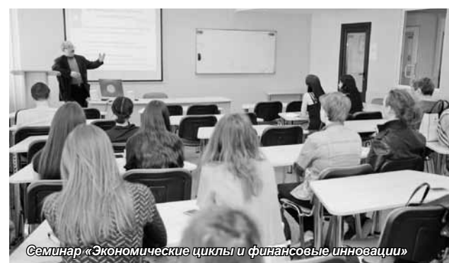
Семинар «Экономические циклы и финансовые инновации»

Научный семинар для студентов третьего курса «Экономические циклы и финансовые