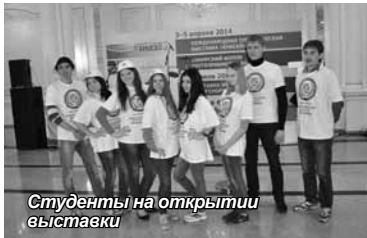
Студенты на открытии выставки

Красноярский институт экономики принял участие в XVI Международной туристической выставке «ЕНИСЕЙ-2014».