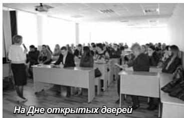
На Дне открытых дверей

Сотрудники Смоленского института экономики, проводя профориентационную работу, не только выезжают в школы, училища, колледжи с целью рассказать о вузе и предоставить рекламные информационные буклеты, но и с удовольствием приглашают всех желающих посетить День открытых дверей. И если театр начинается с вешалки, то вуз – со Дня открытых дверей. Именно после этого события большинство абитуриентов принимают окончательное решение: поступать или нет в выбранный институт.