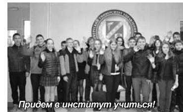
Придем в институт учиться!