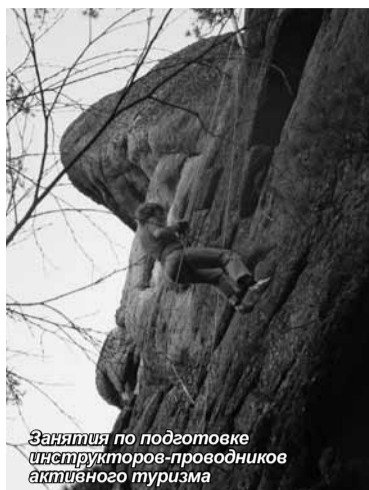
Занятия по подготовке инструкторов-проводников активного туризма

В Красноярске 16 мая прошла научно-практическая конференция «Влияние социально-оздоровительного туризма на устойчивое развитие регионов и дестинаций на примере Красноярского края».