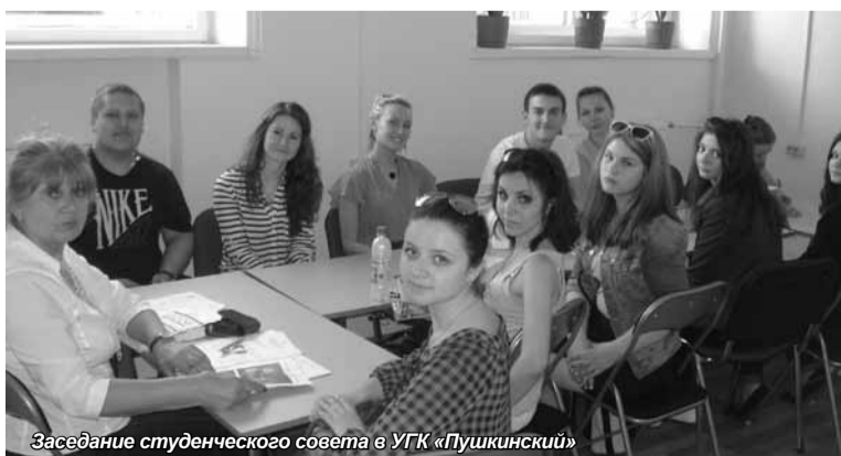
Заседание студенческого совета в УГК «Пушкинский»

Итоги работы Студенческого совета университета были подведены 26 мая на расширенном заседании, на котором также обсуждался план мероприятий на 2014/2015 учебный год.