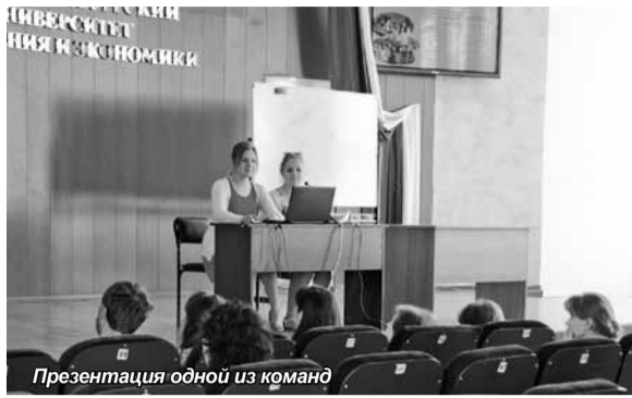
Презентация одной из команд

Студенты и магистры кафедры «Финансы и бухгалтерский учет» провели презентацию по результатам выездного научно-практического семинара «Финансовая система Австрии и Венгрии», который состоялся в период с 22 по 29 апреля 2014 года. В рамках учебной поездки за 7 дней группа посетила Вену, Будапешт и Братиславу. Презентации проводились для студентов 1 курса направления «Экономика» и «Менеджмент».