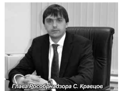
Глава Рособрназора С. Кравцов

Результаты свежего мониторинга будут окончательно утверждены в июне, проверять эти образователь-