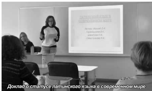
Доклад о статусе латинского языка в современном мире

Во вторник, 27 мая, состоялась студенческая межвузовская конференция «Языки и культура», которая была проведена кафедрой «Иностранные языки» Санкт-Петербургского университета управления и экономики.