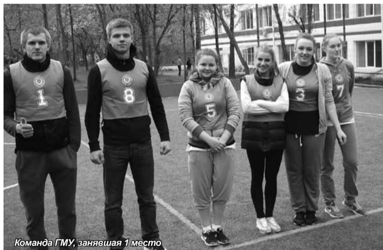
Команда ГМУ, занявшая 1 место

Студенты и преподаватели Красноярского института экономики разыграли Кубок Победы по волейболу.