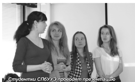
Студентки СПбУЭ проводят презентацию