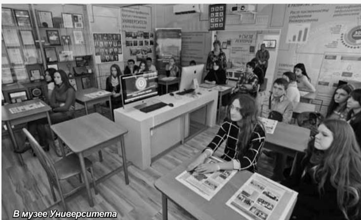
В музее Университета