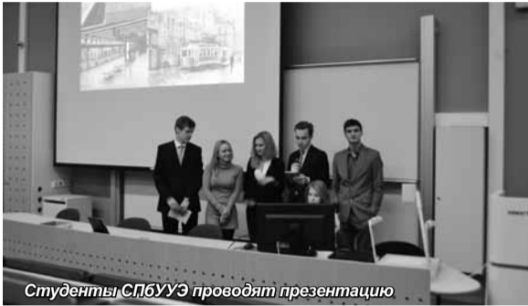
Студенты СПбУЭ проводят презентацию

Знакомство с современной столицей Финляндии – городом Хельсинки – состоялось ранее, на пути в Турку. Студенты осмотрели основные достопримечательности города: памятник композитору Яну Сибелиусу,