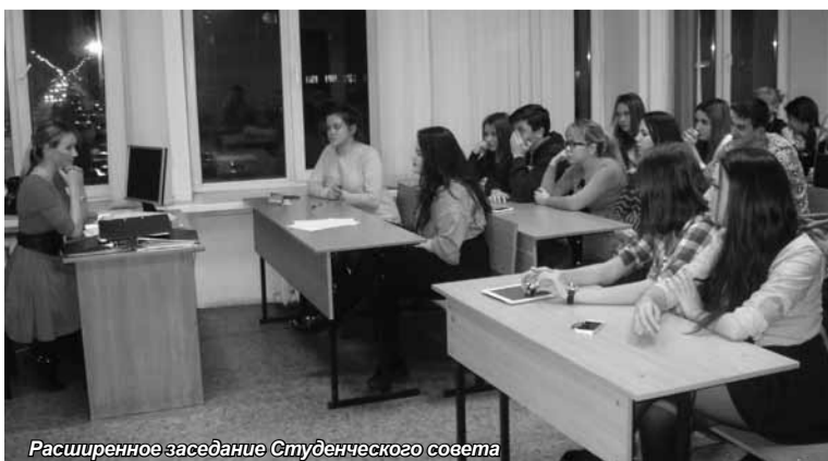
Расширенное заседание Студенческого совета