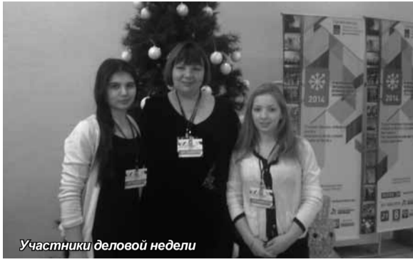
Участники деловой недели

С 17 по 21 ноября 2014 года в Мурманске традиционно прошла III Мурманская международная деловая неделя, организатором которой стало Правительство Мурманской области при поддержке Министерства регионального развития Российской Федерации, Министерства промышленности и торговли Российской Федерации, Федерального агентства по туризму, Торгово-промышленной палаты Российской Федерации.