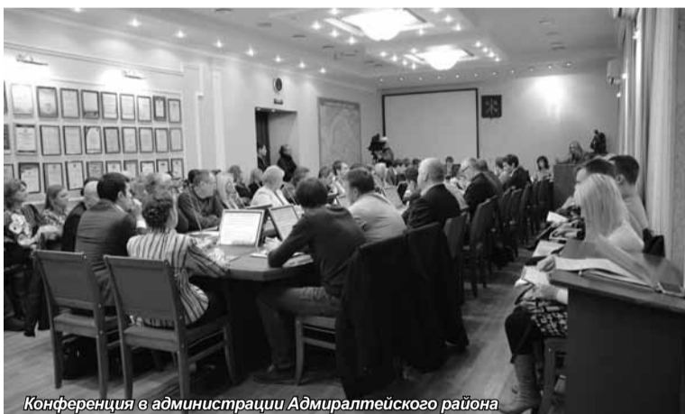
Конференция в администрации Адмиралтейского района

Общественный Совет по развитию малого предпринимательства при Губернаторе Санкт-Петербурга совместно с администрацией Адмиралтейского района 13 ноября провели конференцию на тему «Актуальные вопросы развития малого предпринимательства Адмиралтейского района».