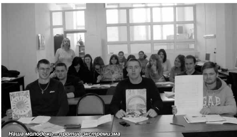
Наша молодежь – против экстремизма

туристических брендов в России» для специалистов органов местного самоуправления и туристических компаний Мурманской области. Семинар был очень интересным и насыщенным, включал практику работы и конкретные примеры, были проанализированы плюсы и минусы тех или иных маркетинговых стратегий, подходов и идей, указаны типовые ошибки