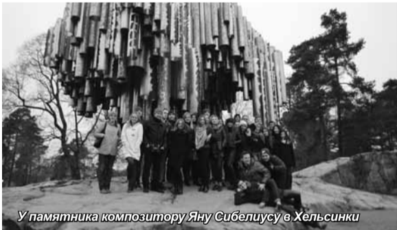
У памятника композитору Яну Сибелиусу в Хельсинки

Российские студенты остались довольны поездкой в эту скандинавскую страну, как ее называют сами финны – Суоми. Не смотря на то, что им пришлось испытать на себе «прелести» Севера, попав под сильный снегопад, в памяти остались гостеприимство хозяев и впечатления от первого зна-