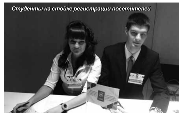
Студенты на стойке регистрации посетителей