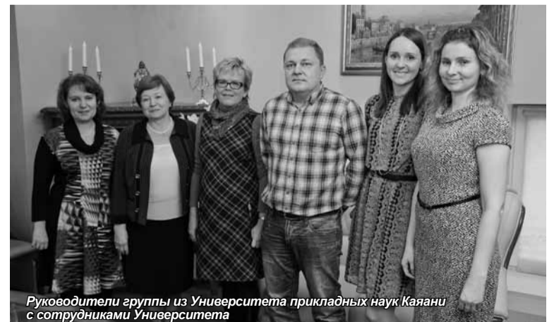
Руководители группы из Университета прикладных наук Каяани с сотрудниками Университета

Интересный факт заключается в том, что русские больше, чем представители других национальностей, тратят денег из своего бюджета на одежду. Наша бизнес культура подразумевает, что человек должен представительно выглядеть.