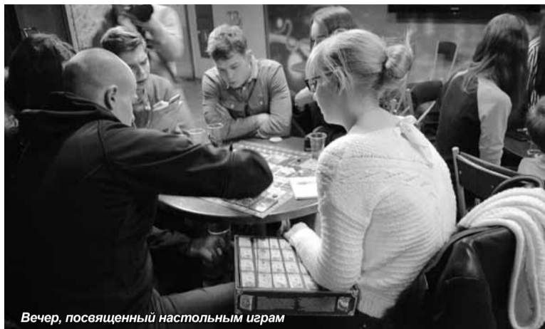
Вечер, посвященный настольным играм

В наш стремительный век информационных технологий порой так не хватает живого общения между людьми. Мы все реже ходим в гости к друзьям: просто попить чаю, поиграть в лото или в другие игры. Общаемся как-то на бегу, задавая вопрос по телефону и иногда не успевая услышать ответ на него, потому