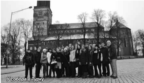
У собора в Турку

Университет прикладных наук г. Турку (TUAS) – один из ведущих университетов прикладных наук в Финляндии, в котором обучается около 9500 человек. Из них более 350 – это иностранные студенты, в большинстве своем обучающиеся по программам обмена.