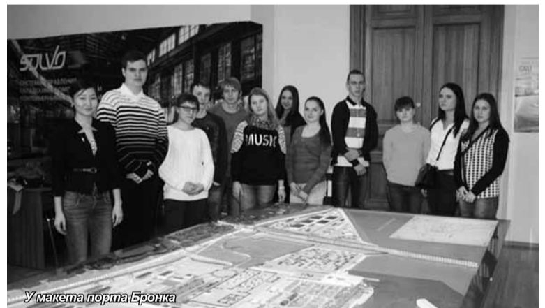
У макета порта Бронка

Студенты Института экономики, менеджмента и информационных технологий, обучающиеся по направлению «Менеджмент», профиль «Логистика», 17 ноября посетили музей логистики.