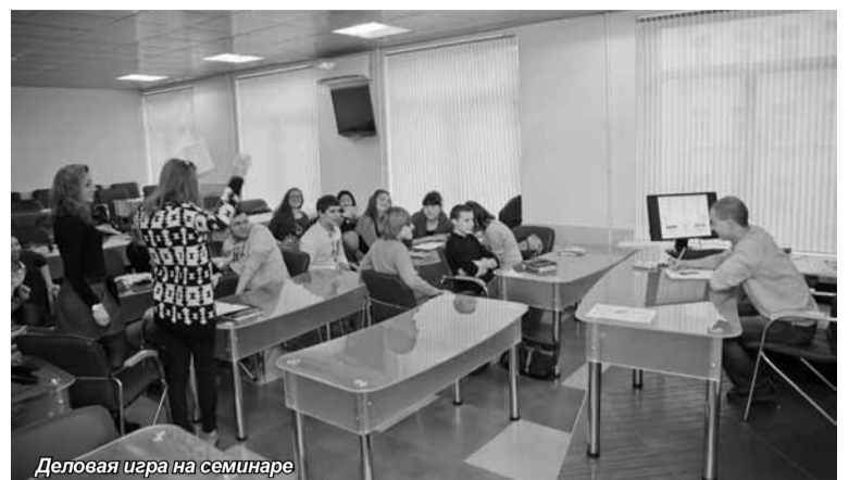
Деловая игра на семинаре

Кафедра «Менеджмент и государственное и муниципальное управление» Института экономики, менеджмента и информационных технологий организовала семинар «Научно-практическая деятельность студентов».