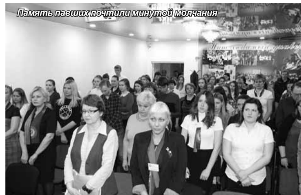
Память павших почтили минутой молчания

Никто не забыт и ничто не забыто, несмотря на то, что прошло 70 лет, и родилось четвертое поколение людей, не видевших ужасов войны. И, пожалуй,