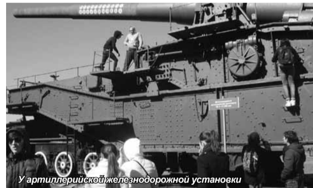
У артиллерийской железнодорожной установки

Особенно понравилась незабываемая прогулка по лесу: свежий воздух и солнце поднимали настроение, несмотря на военную тематику поездки, природа стала одним из самых запоминающихся этапов экскурсии. Было невозможно