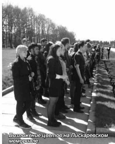
Возложение цветов на Пискаревском мемориале

«Не стареют душой ветераны», – поется в известной песне. Но в силу возраста многим из них здоровье уже не позволяет принять активное участие в праздничных мероприятиях. Каждый год накануне Дня Победы студенты навещают ветеранов Адмиралтейского района – с цветами, подарками, поздравлениями и, конечно, со словами благодарности. В этом юбилейном году своих подшефных молодые люди поздравляли 28 и 29 апреля.