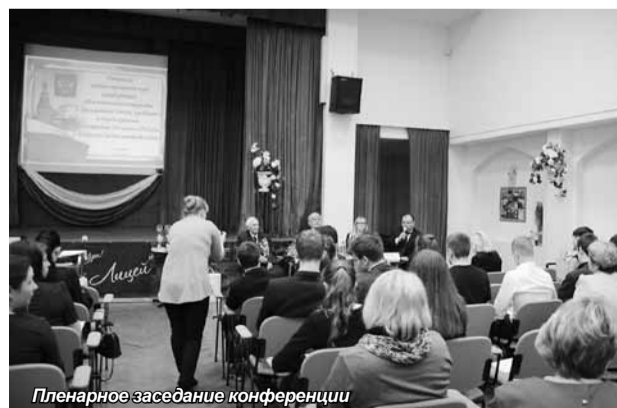
Пленарное заседание конференции

войны, труда, Вооруженных Сил и правоохранительных органов Ленинградской области выступил с докладом на тему «Фальсификация российской истории как способ разложения патриотического сознания населения». Начальник сектора по молодежной политике комитета по культуре, делам молодежи и спорту администрации