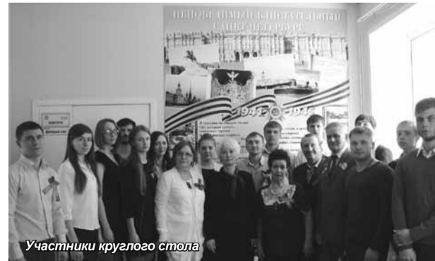
Участники круглого стола

в третий раз проходит в краевой столице: среди участников дети, внуки, правнуки тех воинов, которые отдали свои жизни за наше будущее. В колонне с портретами родственников-фронтовиков прошли и представители нашего института.