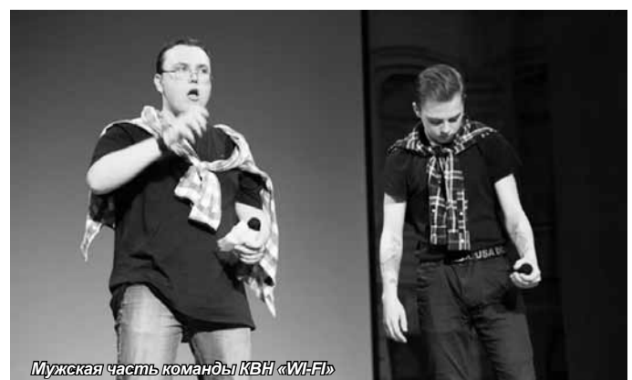
Мужская часть команды КВН «Wi-Fi»