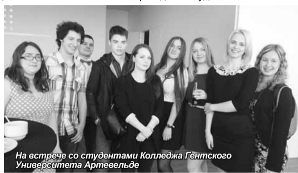
На встрече со студентами Колледжа Гентского Университета Артевельде