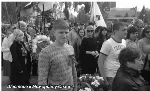
Шествие к Мемориалу Славы