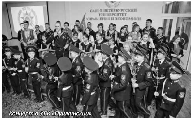
Концерт в УГК «Пушкинский»

Трагизм и величие, скорбь и радость, боль и память... Всё это – Победа. Не случайно День Победы – это праздник, который с годами не только не тускнеет, но занимает всё более важное место в нашей жизни. В этом году человечество отметило 70-летие Победы советского народа в Великой Отечественной войне. Вместе со всеми россиянами 9 мая отпраздновали студенты Санкт-Петербургского академического университета управления и экономики – поздравляли ветеранов, принимали участие во многих торжественных мероприятиях, приуроченных к этому дню.