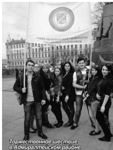
Торжественное шествие в Адмиралтейском районе

Университет предложил своим студентам собрать эти истории и издать книгу. Также в издание вошли воспоминания блокадников Адмиралтейского района. Книга позволит сохранить и передать священную память о родных и близких, об участниках войны от сердца к сердцу. Пока мы помним – мы живем! Презентация книги «Ваша победа,