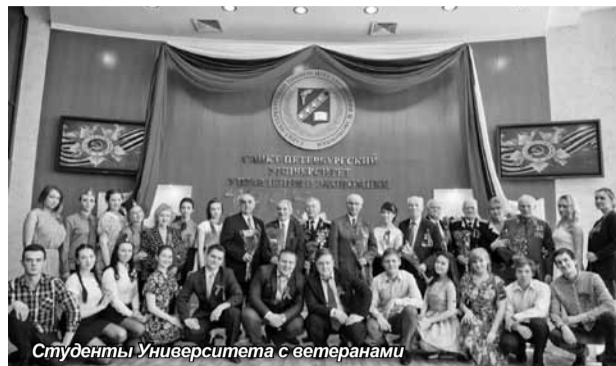
Студенты Университета с ветеранами

наша память», изданной к 70-летию Великой Победы в СПбАУиЭ прошла 5 мая в Университетском центре и 6 мая в Доме молодежи «Рекорд».