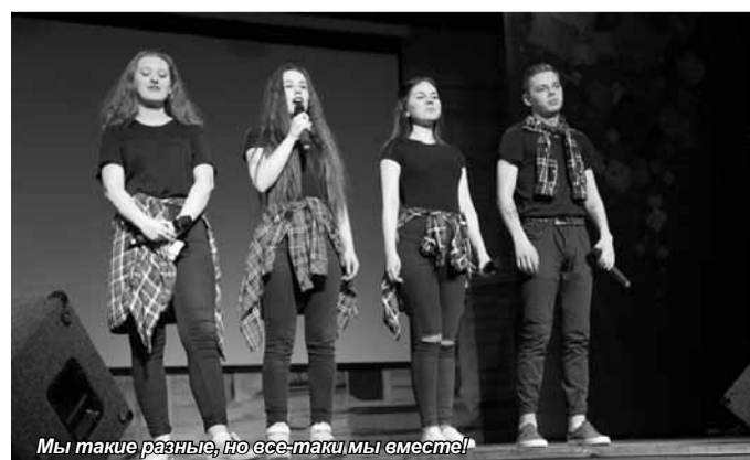
Мы такие разные, но все-таки мы вместе!