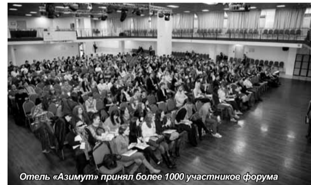
Отель «Азимут» принял более 1000 участников форума

Сегодня в Санкт-Петербурге функционирует более 200 компаний, специализирующихся на работе с кадрами. Спикеры