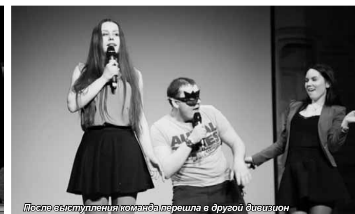
После выступления команда перешла в другой дивизион