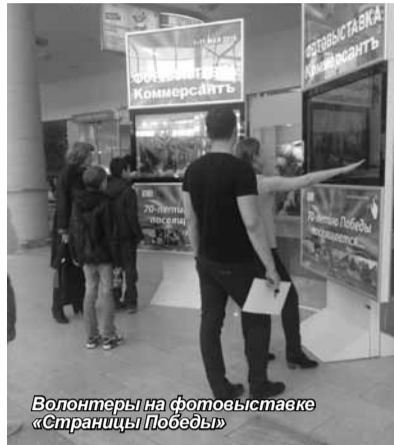
Волонтеры на фотовыставке «Страницы Победы»

28 апреля состоялся «Вечер памяти», участие в котором приняли студенты и преподаватели института. Трогательные и проникновенные слова о войне и По-