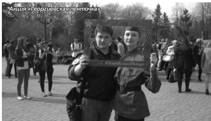
Акция «Георгиевская ленточка»