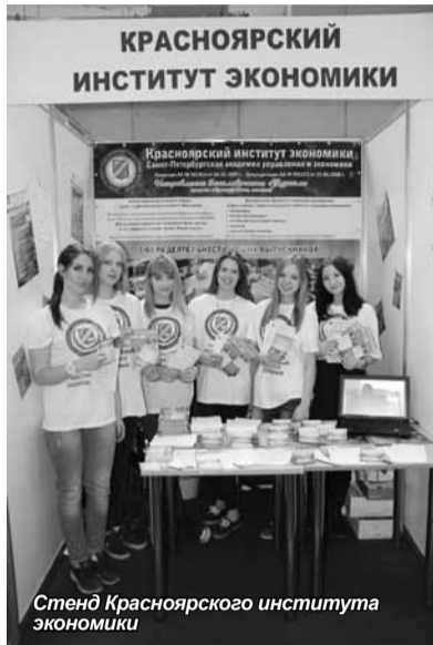
Стенд Красноярского института экономики

Студенты и преподаватели Красноярского института экономики по традиции приняли самое активное участие в мероприятии.