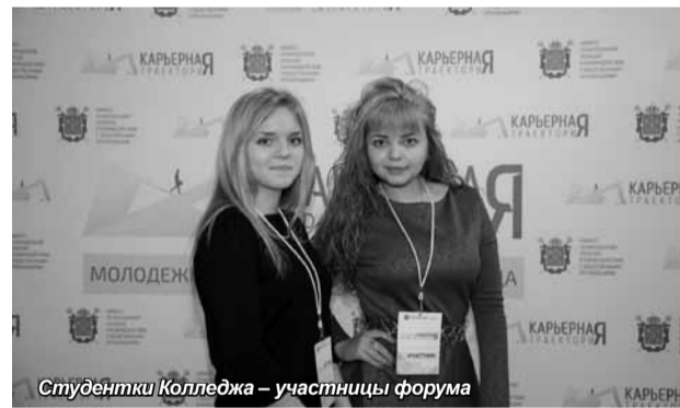
Студентки Колледжа – участницы форума

По итогам форума состоялось пленарное заседание и принята Резолюция, которая направлена в правительство для рассмотрения возможности ее реализации.