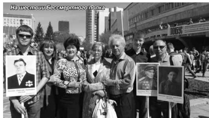
На шествии Бессмертного полка