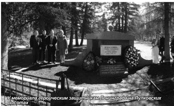
У мемориала героическим защитникам Ленинграда на Пулковских высотах