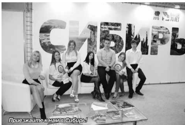
Приезжайте к нам в Сибирь!