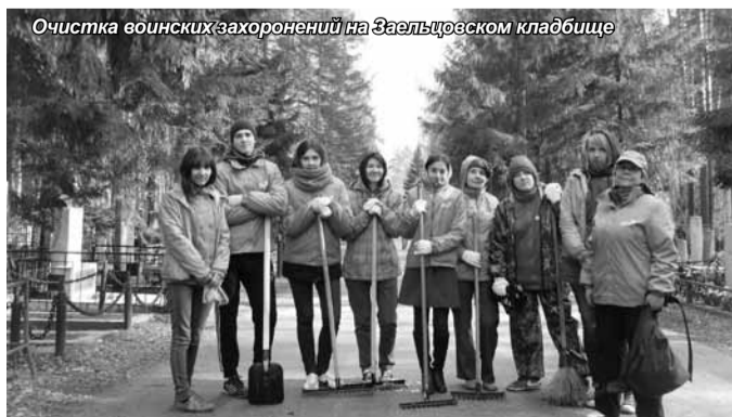
Очистка воинских захоронений на Заельцовском кладбище