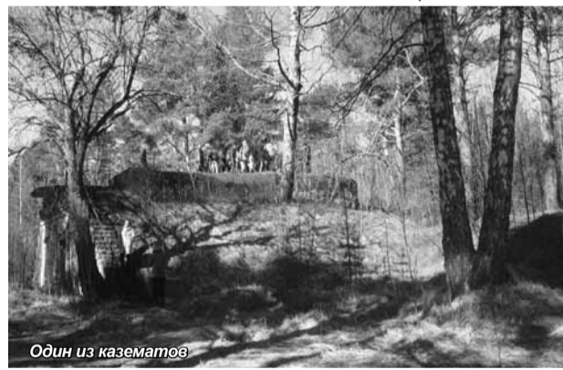
Один из казематов

Нам была предоставлена возможность самостоятельно пройти по бетонным казематам одной из орудийных батарей и минно-прожекторной станции. Темные, совершенно пустые, мрачные коридоры, которые хорошо сохранились до нашего времени, не оставили никого равнодушными.