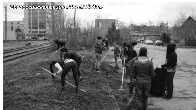
Всероссийская акция «Лес Победы»

9 мая – завершение Вахты Памяти. Студенты и преподаватели Новосибирского филиала вышли с портретами своих родственников – участников Великой Отечественной войны и прошли по Красному проспекту в составе Бессмертного полка.