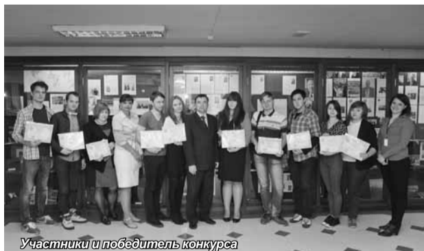
Участники и победитель конкурса

В Санкт-Петербургском академическом университете управления и экономики с 16 февраля по 30 апреля 2015 г. проходил