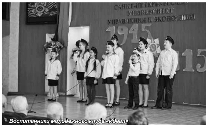
Воспитанники молодежного клуба «Идеал»

В День Победы, 9 мая, представители Университета работали волонтерами на концерте «Поклонимся великим тем годам» на Исаакиевской площади – для ветеранов, жителей и гостей города пел народный артист России Василий Герелло. Наши студенты также приняли участие в гражданской акции памяти «Бессмертный полк» – шествии по Невскому проспекту.