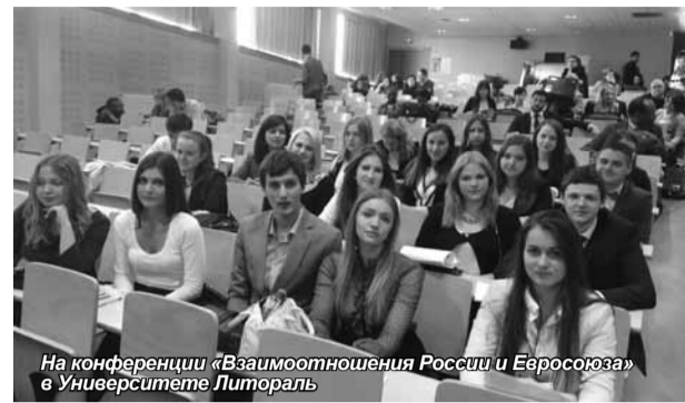
На конференции «Взаимоотношения России и Евросоюза» в Университете Литтораль

В связи с нестабильной ситуацией в Бельгии, Франции и Германии, которая была вызвана забастовкой государственных служащих этих стран, группа была вынуждена сменить маршрут для возвращения в Санкт-Петербург. Но сложившаяся ситуация способствовала тому, что студенты смогли посетить столицу Голландии Амстердам и столицу Латвии Ригу. В Амстердаме у студентов не было свободного времени, однако в Риге они смогли прогуляться по городу, купить сувениры и отведать национальную кухню.