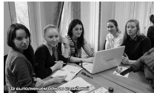
За выполнением одного из заданий

В этом году победу одержал Ухтинский государственный технический университет, и мы от души его поздравляем! Хотя мы не одержали победу, не пожалели, что участвовали – ведь это опыт, который не получишь сидя за партой, это трамплин,