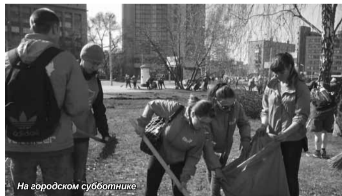
На городском субботнике