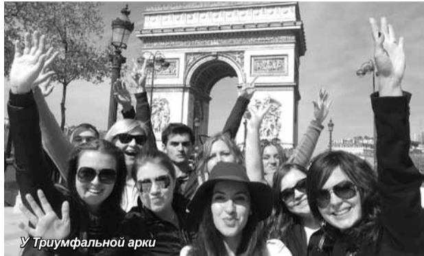
У Триумфальной арки