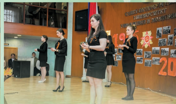
Памяти павших будьте достойны... Студенты Университета достойно встретили День Победы