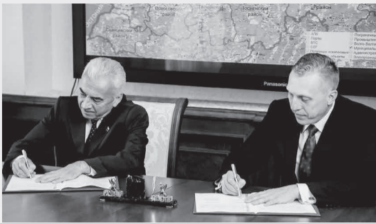
Газета «Менеджер» № 9, 31 мая

Предметом соглашения является сотрудничество по улучшению качества законотворческой деятельности, подготовке кадров и расширению научных исследований, направленных на дальнейшее социально-экономическое развитие Ленинградской области.