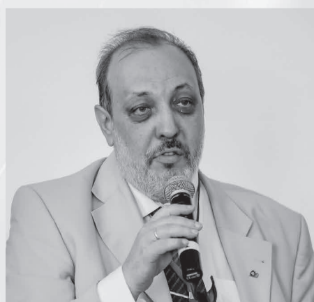
Газета «Менеджер» № 9, 31 мая