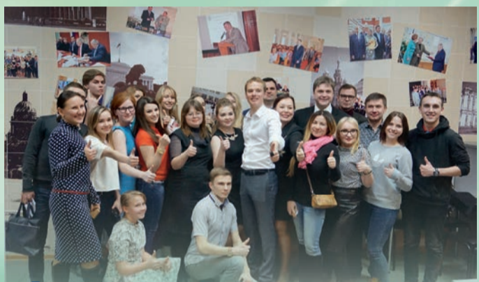
Встречи с интересными людьми, мастер-классы от специалистов-практиков — все это нужно, чтобы состояться в выбранной профессии