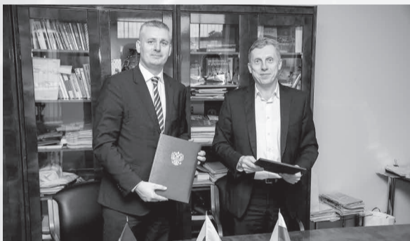
Газета «Менеджер» № 2, 15 февраля

После официальной части состоялись переговоры, на которых более подробно обсуждались ближайшие планы совместной работы. Меморандум – первый шаг на пути долгосрочного сотрудничества. Вторым этапом станет подписание соглашения о студенческом обмене, которое сейчас разрабатывается.