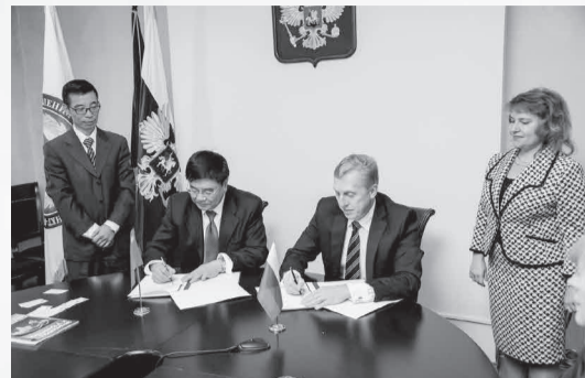
Газета «Менеджер» № 15, 30 сентября