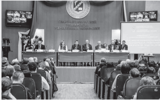
Газета «Менеджер» № 18, 17 ноября