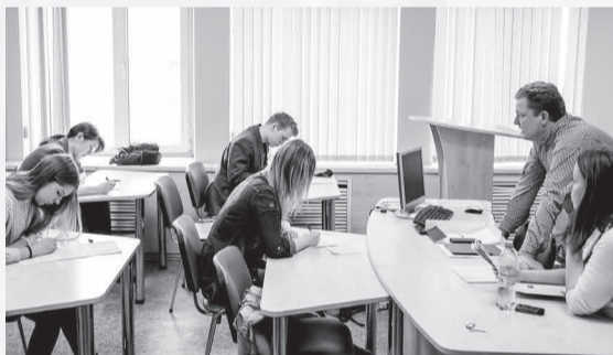
Газета «Менеджер» № 6, 15 апреля