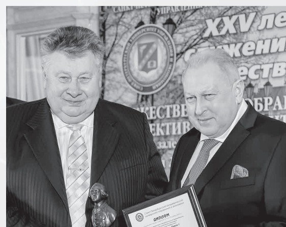
Газета «Менеджер» № 1, 29 января