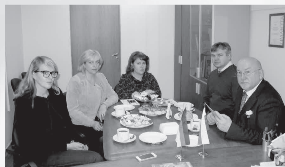
Газета «Менеджер» № 1, 29 января

Основной целью визита стало обсуждение возможных направлений сотрудничества, касающихся мобильности преподавателей и студентов, специализирующихся в области государственного и муниципального управления. Итогом визита стало подписание соглашения между Санкт-Петербургским академическим университетом и Университетом прикладных наук Вильдау о сотрудничестве. В дальнейшем предстоит совместная работа над программами двойных дипломов для направлений «Менеджмент» и «Логистика».