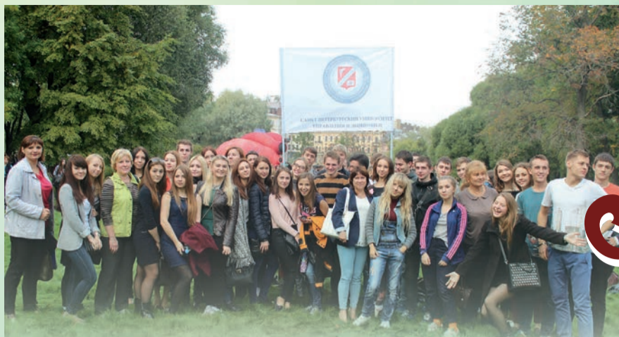
Здорово жить — здорово! Студенты приняли участие в ежегодной профилактической молодежной акции