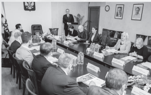
Газета «Менеджер» № 2, 15 февраля