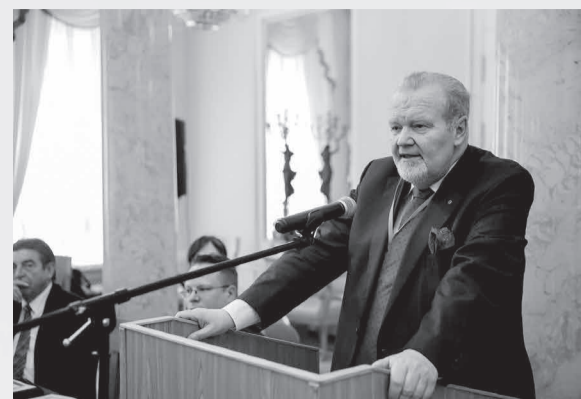
Газета «Менеджер» № 9, 31 мая