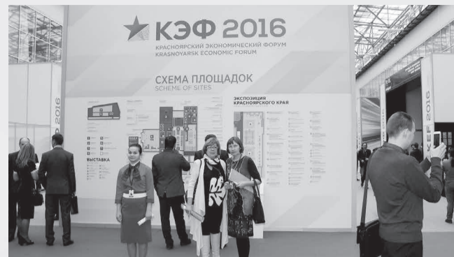
Газета «Менеджер» № 5, 28 марта

Группа студентов дневного отделения направления «Туризм» 18 февраля посетила молодежную площадку «Поколение-2030», с которой стартовал форум. Ее тема – построение «Нового общественного договора», а в фокусе обсуждения – механизмы создания благоприятного климата для активного вовлечения граждан в общественные процессы. 20-го же делегация института побывала на мероприятии, непосредственно отвечающем их профессиональным интересам, – круглом столе «Большой туризм для большой страны. Новый долгосрочный драйвер экономики?».