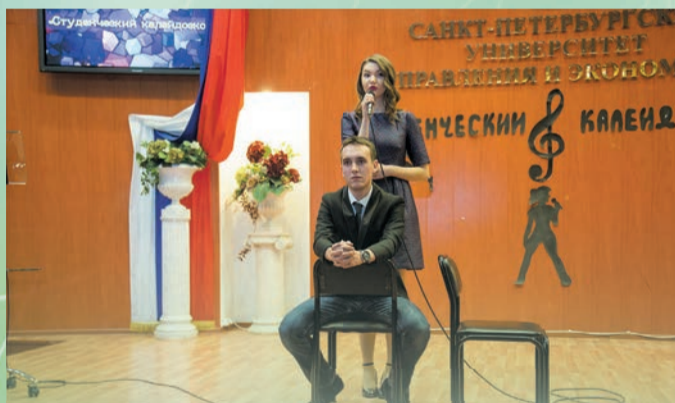
Калейдоскоп талантов. Во Всемирный День студента в вузе проходил новый конкурс — первый «Студенческий калейдоскоп»