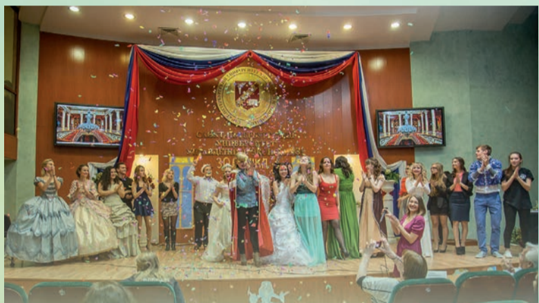
В Университете написали новую историю Золушки. Участницы конкурса «Мисс Первокурсница» стали настоящими принцессами