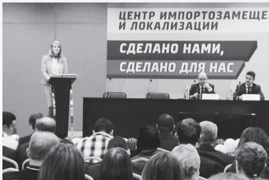
Газета «Менеджер» № 17, 18 ноября