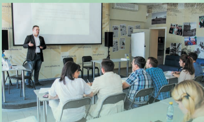
Студенты активно занимаются научной деятельностью. Ежегодный конкурс на лучшую студенческую научно-исследовательскую работу в 2015/2016 учебном году прошел успешно