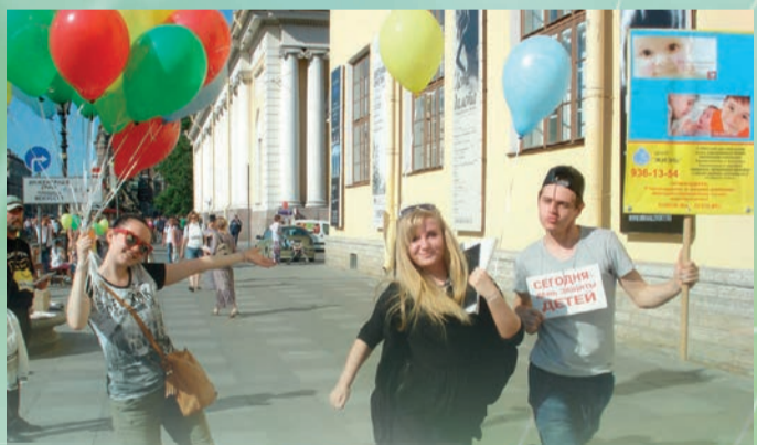
Студенты приняли активное участие в акции центра «Жизнь», посвященной Дню защиты детей