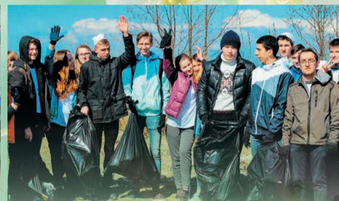
Международная экологическая акция объединила молодежь трех стран. Студенты Университета стали участниками акции «Чистый берег»