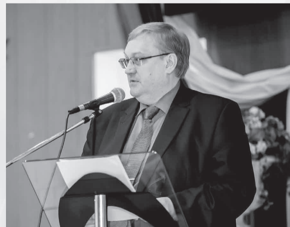
Газета «Менеджер» № 6, 15 апреля