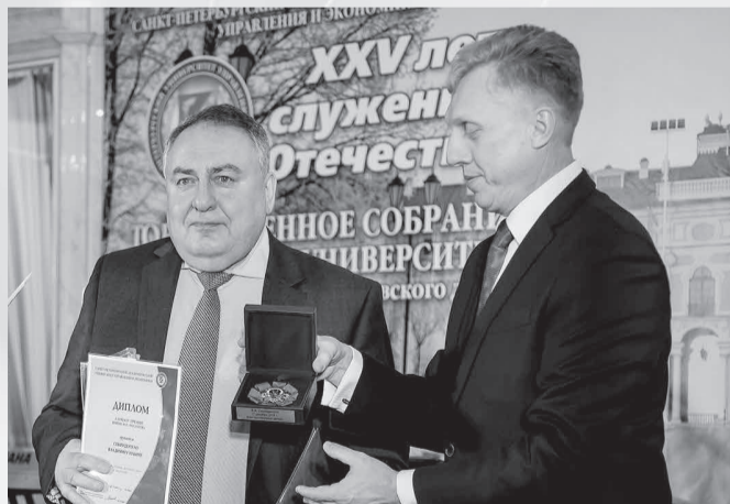
Газета «Менеджер» № 1, 29 января

Первый заместитель прокурора Санкт-Петербурга Э.Э. Артюхов выступил на пленарном заседании II международной научно-практической конференции «Правозащитная деятельность в современной России: проблемы и их решение» с докладом на тему: «Правозащитная роль органов прокуратуры». Он отметил, что иногда граждане пытаются использовать возможности правозащитной деятельности не в тех целях, для которых она предназначена. Ратую за более активное формирование правозащитных организаций, Э.Э. Артюхов отметил, что этой деятельностью нужно заниматься исключительно в рамках права, и если организация такие нормы нарушает, она не имеет права называться правозащитной.