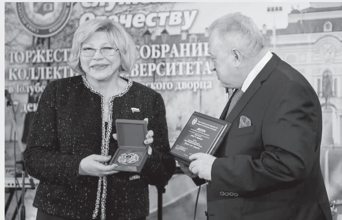
Газета «Менеджер» № 1, 29 января

Первый заместитель председателя Комитета по культуре Государственной думы РФ, почетный профессор САУ Е.Г. Драпеко награждена орденом им. Державина «За вклад в развитие словесности и гуманитарного образования». Уважая ее всегда принципиальную позицию как парламентария, в Университете ее ценят и за тот вклад, который она внесла в воспитание молодого поколения как педагог. Свое искреннее «спасибо» Елена Григорьевна сказала не столько за оценку ее деятельности, сколько за выпускников Университета: «Самостоятельность мышления, которая опирается на научную базу, делает их заметными среди других управленцев».