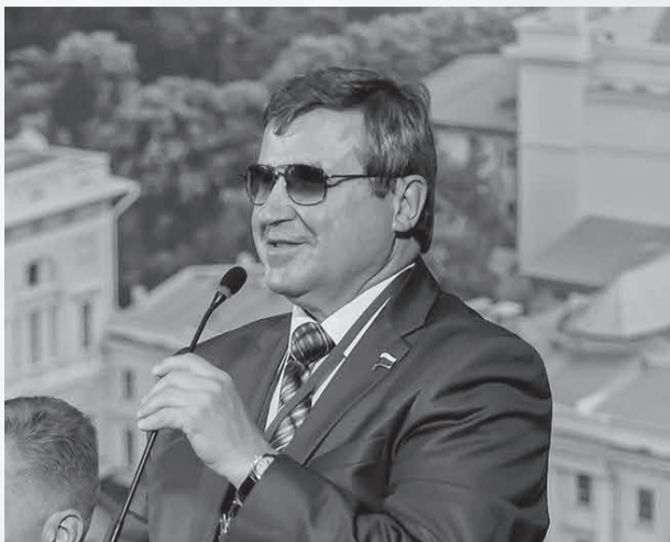
Газета «Менеджер» № 14, 17 сентября.

Первым с началом учебного года первокурсников поздравил первый заместитель председателя Комитета Государственной думы РФ по образованию, почетный профессор САУ О.Н. Смолин. «В России, к сожалению, есть заблуждение, что у нас слишком много студентов. У нас не студентов много, у нас специалистов не хватает», - отметил депутат. О.Н. Смолин уверен, что те молодые люди, которые присутствовали в зале, сделали правильный выбор. Потому что решили получить высшее образование и выбрали для себя хорошие специальности. Во-вторых, что поступили в САУ: в Университете обучение ориентировано на практику, вуз имеет хорошие связи с зарубежными университетами, большое внимание в нем уделяется науке.