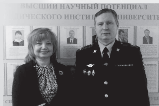
Газета «Менеджер» № 5, 28 марта

Итогом встречи станет подписание соглашения о сотрудничестве.