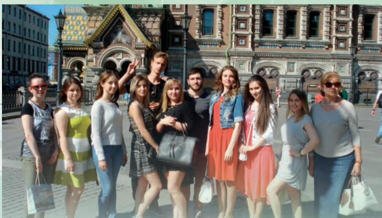
Не знаящие свое прошлое не смогут построить будущее. Историю так интересно изучать на экскурсиях по Санкт-Петербургу, его пригородам