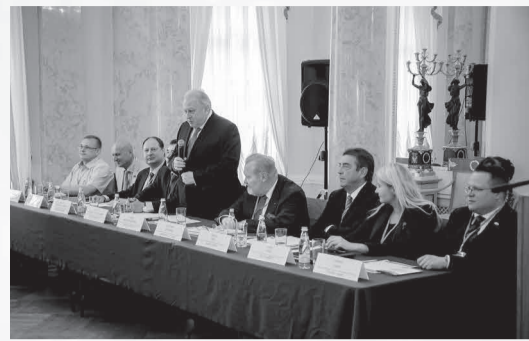
Газета «Менеджер» № 9, 31 мая