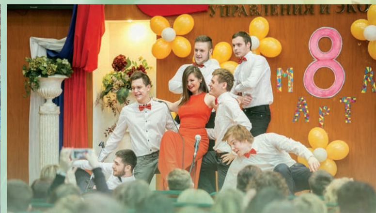
Ни один праздник в Университете не обходится без студенческого концерта. Международный женский день — не исключение