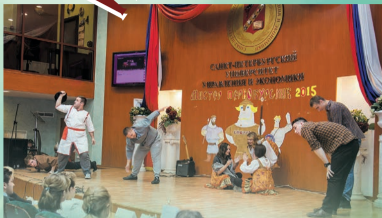
Не перевелись еще богатыри на земле русской! Это с успехом доказали наши студенты, принявшие участие в конкурсе «Мистер Первокурсник»