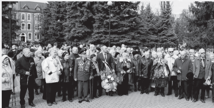
Газета «Менеджер» № 7, 28 апреля

Мы, молодое поколение, обязаны чтить и помнить подвиг наших дедов и прадедов и сохранить тот мир, за который они боролись без разделения на своих и чужих. Только сообща мы можем противостоять современным вызовам и угрозам. Созная себя наследниками народа-победителя, мы должны помнить о том, что теперь мы несем свою долю ответственности за судьбу своего края, своей Родины.