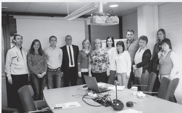
Газета «Менеджер» № 17, 18 ноября

В ходе деловой встречи с представителями Университета Кюменлааксо стороны обменялись мнениями по эффективности применяемой кредитной технологии обучения в образовательном процессе и студентоориентированной модели образования. Состоялся обстоятельный диалог о возможности подписания двустороннего договора о сотрудничестве.