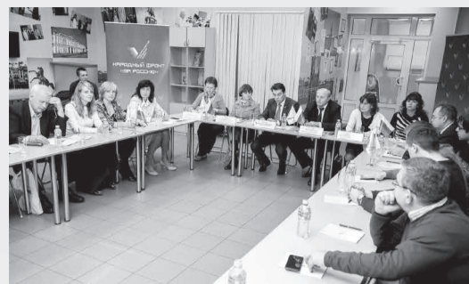
Газета «Менеджер» № 19, 30 ноября