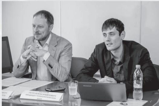
Газета «Менеджер» № 15, 30 сентября