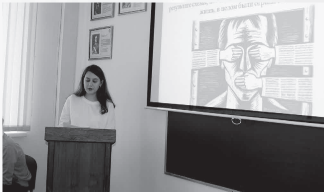
Газета «Менеджер» № 6, 15 апреля

На конференции рассматривались проблемы экономико-правового и социально-культурного развития России и Алтайского края в современных условиях.