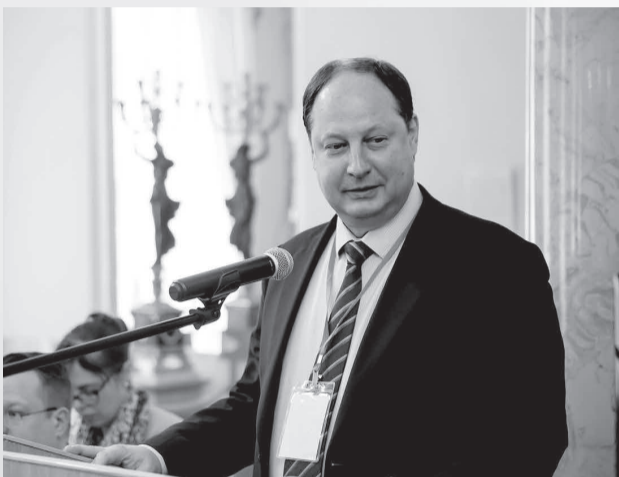
Газета «Менеджер» № 9, 31 мая