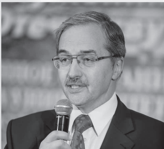
Газета «Менеджер» № 1, 29 января

Первый заместитель председателя Комитета по культуре Государственной думы РФ, почетный профессор САУ Е.Г. Драпеко награждена орденом им. Державина «За вклад в развитие словесности и гуманитарного образования». Уважая ее всегда принципиальную позицию как парламентария, в Университете ее ценят и за тот вклад, который она внесла в воспитание молодого поколения как педагог. Свое искреннее «спасибо» Елена Григорьевна сказала не столько за оценку ее деятельности, сколько за выпускников Университета: «Самостоятельность мышления, которая опирается на научную базу, делает их заметными среди других управленцев».