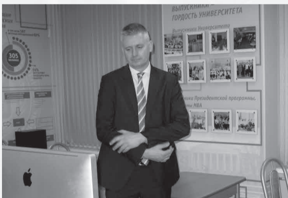
Газета «Менеджер» № 1, 29 января

Наш гость посетил музей Университета, где с большим интересом познакомился с его историей, а также с программами виртуального филиала Русского музея.