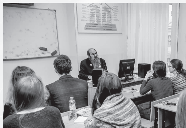
Газета «Менеджер» № 1, 29 января