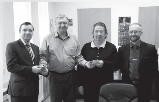
Газета «Менеджер» № 7, 28 апреля

На рабочем совещании был подписан договор о сотрудничестве в научно-образовательной сфере между Санкт-Петербургским академическим университетом и КБ «Арсенал», обсуждены планы взаимодействия организаций.