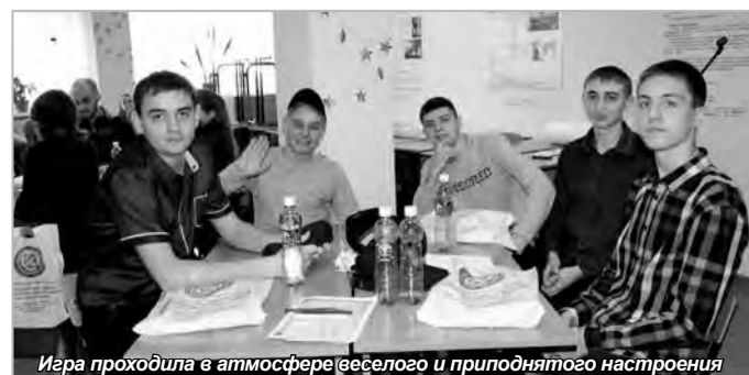
Игра проходила в атмосфере веселого и приподнятого настроения

Игра стала прекрасным поводом вспомнить историю российского студенчества, рассказать о сегодняшних перспективах получения высшего образования и возможностях обучения в Санкт-Петербургском университете технологий управления и экономики.