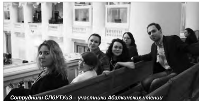
Сотрудники СПбТУиЭ – участники Абалкинских чтений