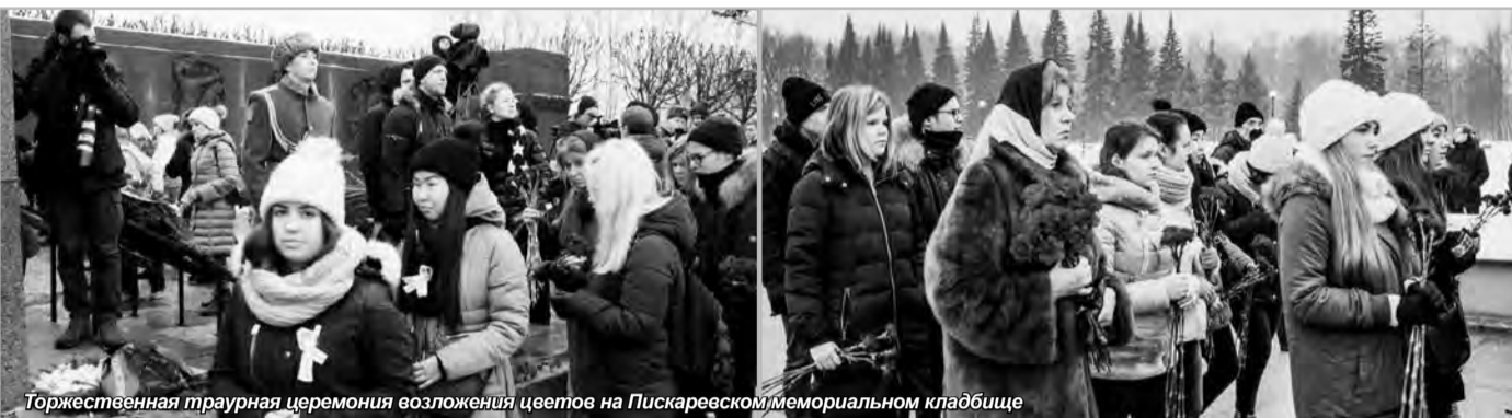
Торжественная траурная церемония возложения цветов на Пискаревском мемориальном кладбище

В этот же день для студентов Колледжа СПБТУиЭ прошли уроки мужества, на которых рассказывалось о блокаде, о тех, кто не смог пережить эти страшные 900 дней.