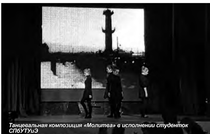
Танцевальная композиция «Молитва» в исполнении студенток СПбУТУиЭ