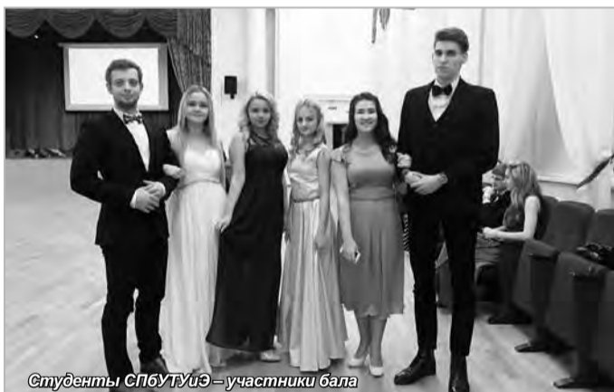
Студенты СПбУТУиЭ – участники бала