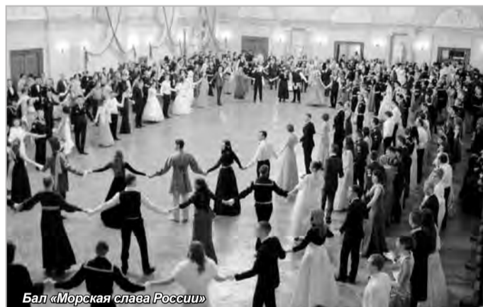
Бал «Морская слава России»

Нас окружили порхающие по залу дамы в великолепных вечерних платьях и кавалеры, одаривающие их восхищенными взорами. Эта невероятная атмосфера словно погрузила нас в XIX век. И вот, спустя мгновение, мы ощутили себя героями произведений Пушкина, Лермонтова или Толстого, кружась в вальсе, танцуя веселую кадрили или медленный грациозный менуэт. Мы очень благодарны администрации нашего Университета за предоставленную возможность оказаться в эпицентре такого события.