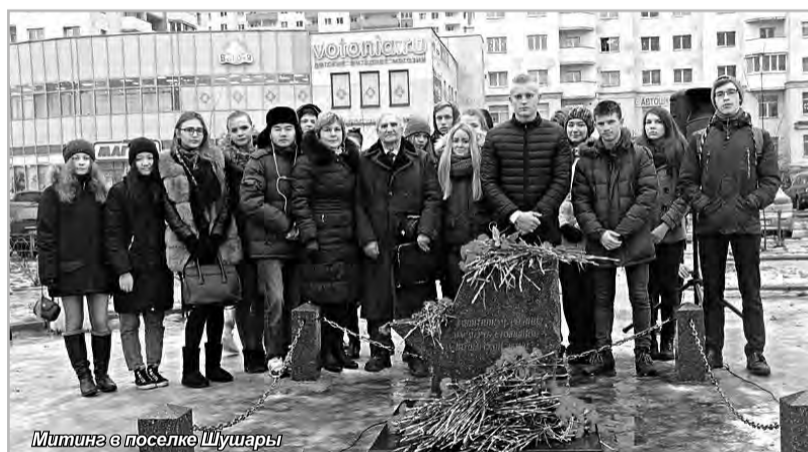
Митинг в поселке Шушары

Мы все – студенты, школьники, ветераны и простые жители поселка – несли красные гвоздики к памятнику «Защитникам Родины, насмерть стоявшим на Шушарской земле», несли их как символ нашей вечной памяти об отваге героев, удержавших город от фашистов ценой своих жизней.