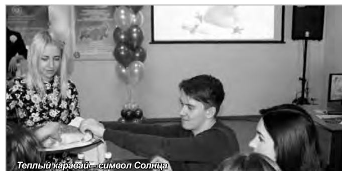
Теплый каравай – символ Солнца