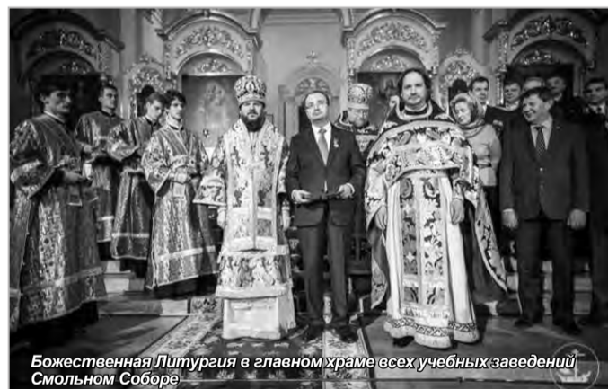
Божественная Литургия в главном храме всех учебных заведений Смольном Соборе