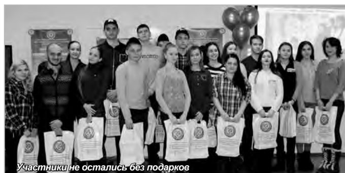
Участники не остались без подарков