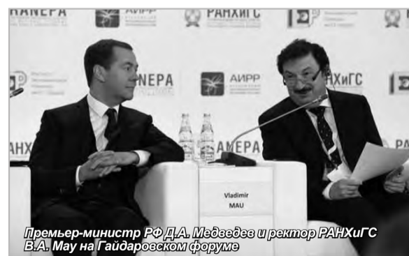
Премьер-министр РФ Д.А. Медведев и ректор РАНХиГС В.А. Мау на Гайдаровском форуме

Вопросы образовательной сферы, кадрового потенциала были затронуты на нескольких мероприятиях второго дня