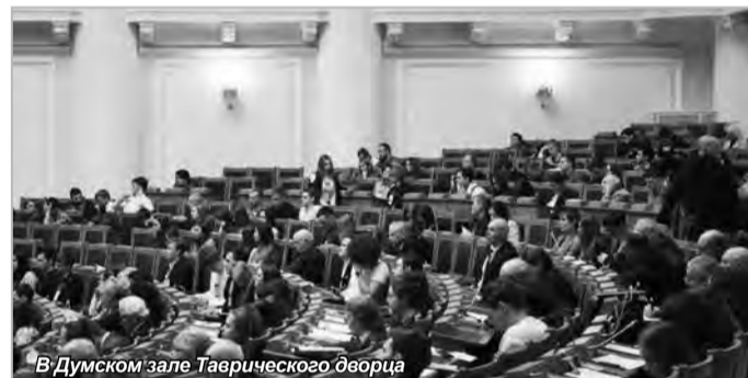
В Думском зале Таврического дворца