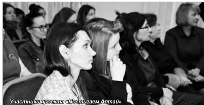
Участники проекта «Постигаем Алтай»