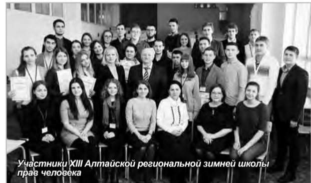
Участники XIII Алтайской региональной зимней школы прав человека

В г. Белокуриха Алтайского края 30-31 января 2017 года состоялась очередная XIII Алтайская региональная зимняя школа прав человека для студентов и магистрантов «Проблемы реализации конституционных прав граждан при предоставлении государственных и муниципальных услуг», целью которой являлось привитие специальных знаний и практических навыков в деле обеспечения конституционных прав российских граждан, а также формирование посредством свободного общения со своими сверстниками, авторитетными экспертами, практикующими юристами