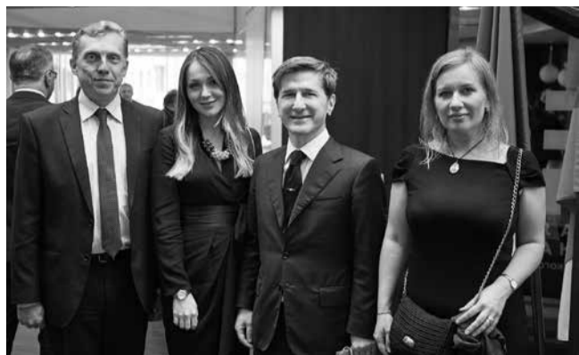
печатную рекламную продукцию вуза и именное приглашение на день выпускника.

В Генеральном консульстве Италии в Санкт-Петербурге 5 июня прошел прием по случаю Дня провозглашения Итальянской Республики.