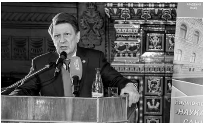
Газета «Менеджер» № 2, 15 февраля

О том, что Санкт-Петербург остается одним из крупнейших центров образования и науки в стране, в своем приветственном слове к участникам конференции «Наука – Образование – Санкт-Петербургу» отметил академик РАН, генеральный директор ФБУ «ТЕСТ-С.-Петербург», почетный профессор СПбУТИЭ В.В. Окрепилов, который является членом Экономического совета при Губернаторе и одним из разработчиков Стратегии экономического и социального развития Санкт-Петербурга до 2030 года.