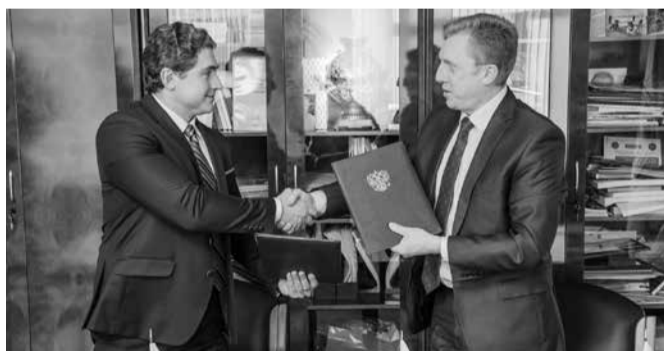
Газета «Менеджер» № 4, 7 марта

Студенты будут проходить стажировку с апреля по сентябрь на Анталийском побережье. В течение мая они пройдут курс подготовки, а далее непосредственно погрузятся в работу в гостиничном бизнесе.