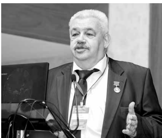
Газета «Менеджер» № 19, 30 ноября

Тему своего доклада «Роль интеллектуального капитала в развитии бизнеса Санкт-Петербурга» он посвятил проблемам изучения роли интеллектуального капитала в развитии бизнеса и процессу становления современного экономико-социологического подхода к изучению интеллектуального капитала.