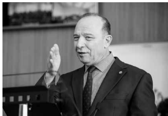
СПБТУИЭ В.Л. Квинта «Философские основы и формирование теории стратегии».

В Санкт-Петербургском университете технологий управления и экономики 16 марта состоялась открытая лекция выдающегося экономиста, теоретика и практика стратегирования, доктора экономических наук, профессора, иностранного члена Российской академии наук, Заслуженного работника высшей школы Российской Федерации, члена президиума Экономического совета при Губернаторе Санкт-Петербурга, заведующего кафедрой финансовой стратегии Московской школы экономики и руководителя Центра стратегических исследований Института математических исследований сложных систем МГУ им. М.В. Ломоносова, почетного профессора