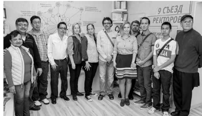
на английском и испанском языках, показали университетскую библиотеку, ответили на вопросы зарубежных коллег.

Санкт-Петербургский университет технологий управления и экономики 4 октября посетили профессора из Гватемалы, находящиеся в России с визитом в целях знакомства с российскими потенциальными вузными партнерами.