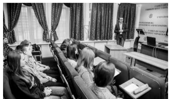
Газета «Менеджер» № 20, 16 декабря

В завершении делового визита студенты СПбУТУиЭ прослушали открытую лекцию профессора Ф. Унгена на английском языке на тему «Международный контекст для развития в области финансов и управления».