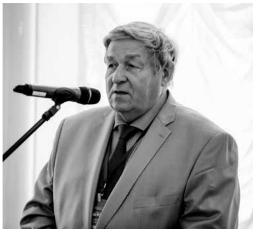
Газета «Менеджер» № 19, 30 ноября

Точками развития ученый выделит обновление МТП сельскохозяйственных машин, внедрение системы точного земледелия, системы автоматизации на фермах.