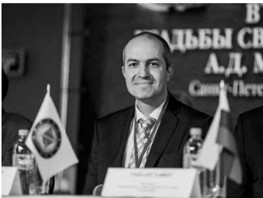
Газета «Менеджер» № 15, 28 сентября

Декан факультета экономики и бизнеса УПН Вюрцбурга – Швайнфурта, профессор Х. Больсингер, выступая на торжественной церемонии посвящения в студенты первокурсников СПбУТУиЭ, выразил сожаление, что он не говорит на русском языке. «Международный отдел нашего университета имеет сотрудников, для которых русский – родной язык, так как Россия очень важный партнер для Германии. А для нас один из важнейших партнеров – Санкт-Петербургский университет технологий управления и экономики. Мы сотрудничаем уже 5 лет. Вы будете формировать будущее этой страны, и вам очень повезло, что ваше будущее начинается здесь», – заверил первокурсников профессор.