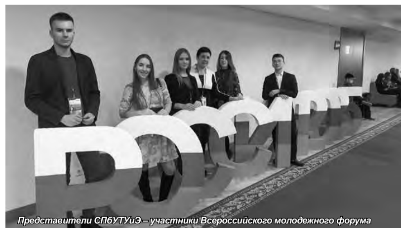
Представители СПбГУИЭ – участники Всероссийского молодежного форума