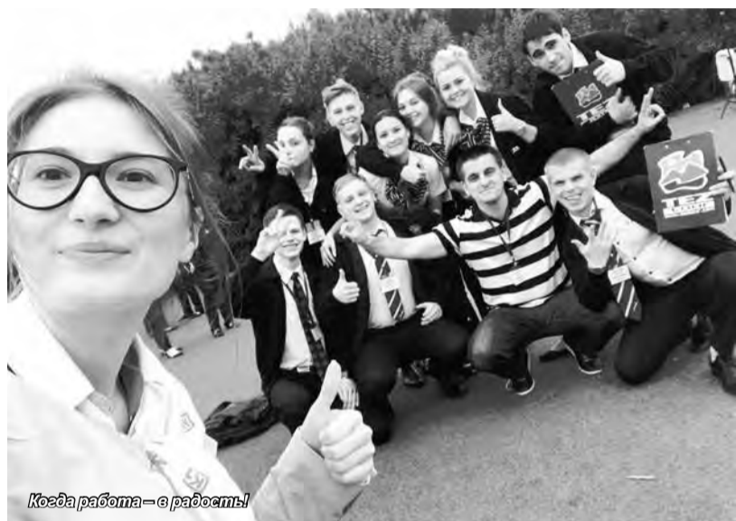
Когда работа – в радость!

Мы прожили в Турции 7 месяцев. Масса эмоций, новых впечатлений, полученных знаний и большое количество нового опыта – это главное, что мы привезли из этой прекрасной страны. Было сложно? Да, безусловно! Зная все сложности, хотим ли мы вернуться снова? Да, безусловно! – поделились проходившие там практику студенты.