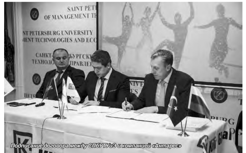
Подписание договора между СПбУТУиЭ и компанией «Антарес»

Вторая встреча студентов с представителями компании состоялась 8 декабря. На ней своим опытом работы в Турции поделились проходившие там практику студенты.