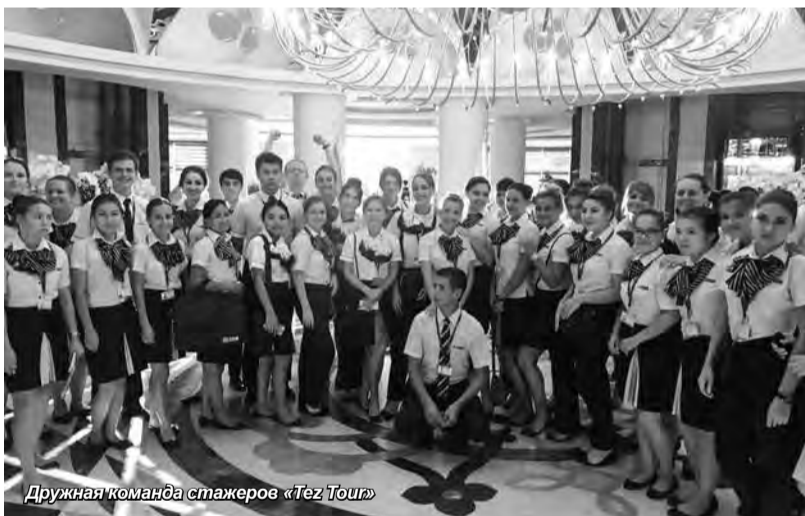
Дружная команда стажеров «Tez Tour»

Успешная стажировка в известной компании – хороший старт для карьеры