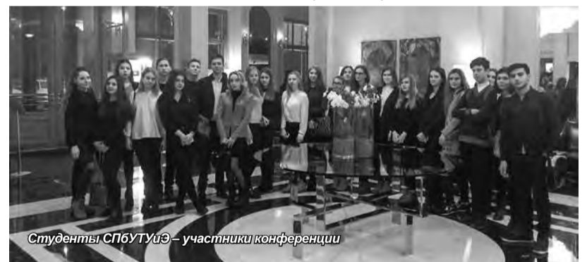
Студенты СПбГУИЭ – участники конференции

Центральным мероприятием конференции стала деловая сессия в формате дизайн-мышления на тему «Качественная трансформация как основная предпосылка создания туристского форума будущего». В рамках сессии российские и зарубежные эксперты создали широкоформатные макеты стратегии развития с